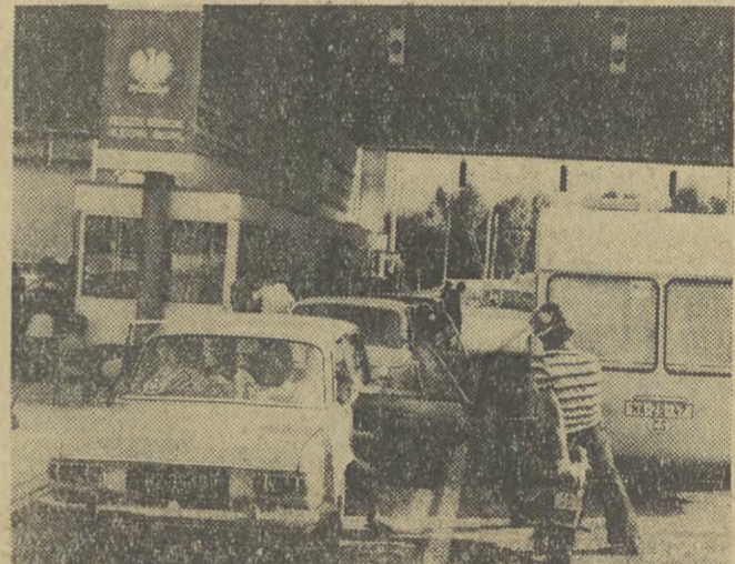
Sezon turystyczny w pełni. Na zdjęciu: przebieg granicze w Kudowej-Słomem (woj. wrocławskie), które przekracza dziennie do 6 tys. osób, głównie turystów z CSRS, Francji, Włoch i NRF.