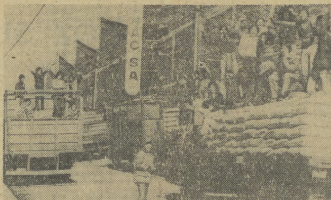
Dla wyrażenia swego poparcia dla S. Allende, liczne grupy młodzieży Chile zgłosiły pomoc przy przewożeniu i rozdaniu towarów konsumpcyjnych.

SANTIAGO (PAP) W ciągu miesiąca zanotowano w Chile prawie 400 poważnych przypadków naruszenia porządku publicznego, wśród których większość stanowiły akty sabotażu. Tragiczny bilans 30 ostatnich dni zamyka się liczbą 7 zabitych i ok. 40 rannych. Tylko w ciągu ostatnich 48 godzin chilijscy faszyci przeprowadzili ponad 70 akcji terrorystycznych.