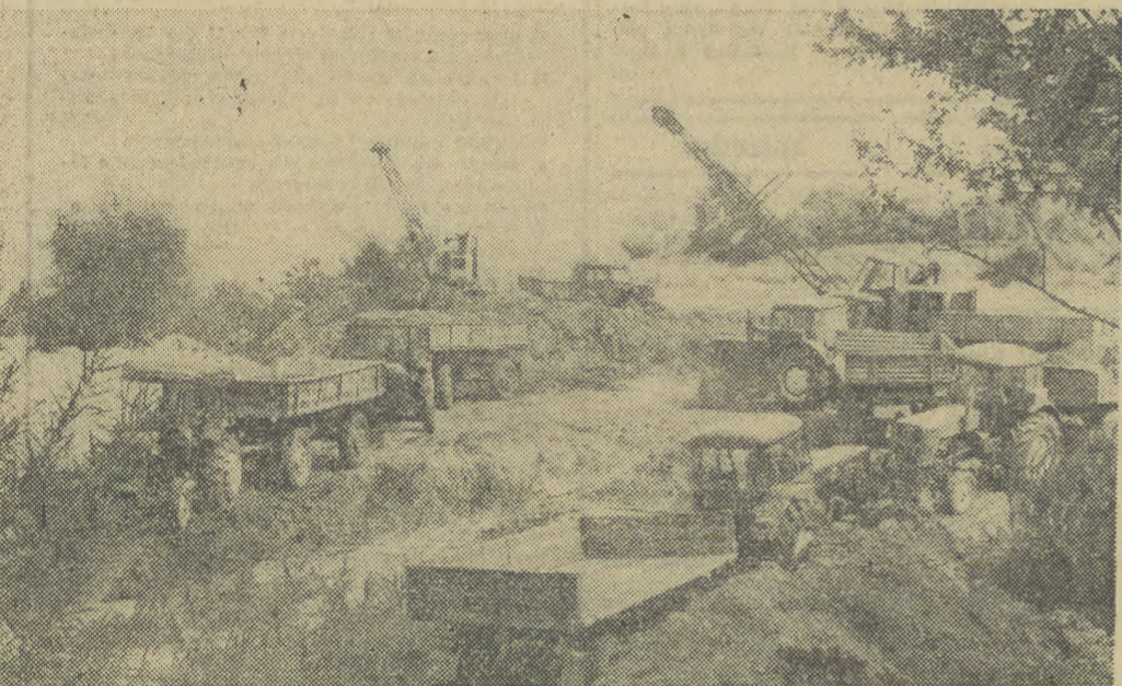
W powiecie dąbrowskim przeprowadza się wielkie prace melioracyjne i buduje nowe wały przeciwpowodziowe. Na ten cel przeznaczono w br. ponad 66 mln zł.