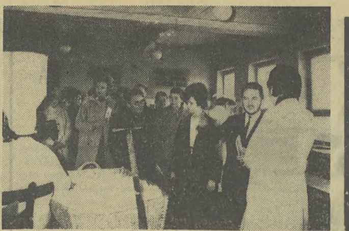
Uczestnicy zwiedzają dział produkcji kremów kosmetycznych.

ZAMIEŃCIE Kwaterunkowa 3 pokoje, kuchnia, c.o., telefon 26-12, Koszalin, na 2 pokoje, kuchnia, c.o., nowe budowlentwo w Krakowie, Oferty: Biuro Ogłoszeń, Koszalin — pod nr 12-21. K-3706