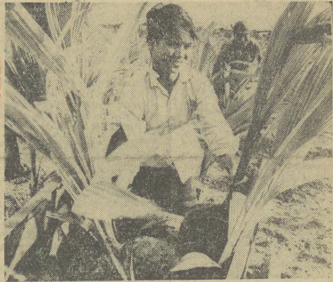
Na terenach wyzwolonych Wietnamu Pół w prowincji Quang Tri, założono kilkanaście szkółek drzewek. Na zdj. sadzonki palm kokosowych.

KAIR (PAP) Po wizycie radzieckiego ministra spraw zagranicznych Andrieja Gromyki i amerykańskiego sekretarza stanu Henry Kissingera w Kairze, obserwatorzy odnotowują ożywienie działalności dyplomacji egipskiej. Ministerstwo Spraw Zagranicznych ARE zapowiada na następne tygodnie kilka wizyt w Kairze szefów dyplomacji państw europejskich. Do Egiptu wybierają się m. in. ministrowie spraw zagranicznych Bułgarii, Rumunii, Węgier, RFN i Szwecji. Przeprowadzą oni w Kairze rozmowy w sprawach politycznych i gospodarczych na temat stosunków dwustronnych, a także sytuacji politycznej na Bliskim Wschodzie. Obecnie przebywa w Egipcie przewodniczący komisji spraw zagranicznych parlamentu francuskiego — Couve de Murville. Został on przyjęty przez prezydenta Egiptu Anwar Sadata. Kair jest również areną ważnych wydarzeń w płaszczyźnie międzyarabskiej. Ostatnio obradowała tu Rada Obrony Ligi Arabskiej, zwołana na prośbę Libanu. Obecnie obraduje w Kairze, w siedzibie Ligi Arabskiej, konferencja ministrów informacji krajów arabskich.