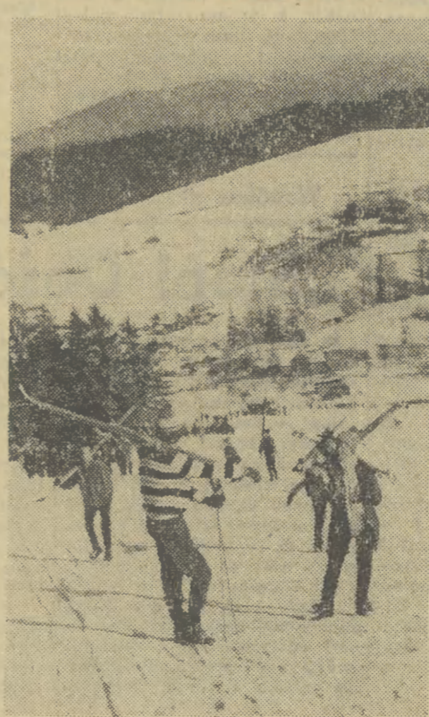
Znowu nad Polską wylądował piękna słońca pogoda i silny mroź. Przebijająca na zimowych feriach w Zakopanem, Bukownie, Szczawnicy czy Rabce młodzież szkół średnich spędza czas na zimowej zabawie. Także studenci wielu uczelni — którzy uporali się ze swymi egzaminami, podnoszą swoje umiejętności w dziedzinie narciarskiej. Na zdj.: studenci AGH w drodze na codzienny trening odbywany na Maciejowej kolo Rabki.

Według biblijnej legendy, zawartej w „Księdze Rodzaju” Jakub syn Izaaka podstępem wyłudził od swojego brata Ezaawy przywilej pierworodności a potem przybierając jego szaty, uzyskał błogosławieństwo od umierającego ojca. Uciekając przed zemstą Ezaawy do Charanu, zatrzymał się na nocleg w „miejscu świętym” — i we śnie objawił mu się Jahwe, błogosławiając Jakuba i jego potomstwo. „A gdy Jakub zbudził się ze snu, pomyślał: Prawdziwie Jahwe jest na tym miejscu, a ja nie wiedziałem. I zdętym trwozą rzekł: O, jakie miejsce to przejmuję grozą.” Wydarzeniem inauguracyjnym koncertu X Dni Muzyki Organowej było polskie prawykonanie „PRZEBUDZENIA JAKUBA” PENDERECKIEGO. Inspiracja literacka, tak charakterystyczna dla twórczości Pendereckiego, przybrała tym razem jedynie postać tytułu, a nie samodzielnej warstwy słownej. Utwór przeznaczony został na orkiestrę symfoniczną, ale jest właściwie programowym poematem symfonicznym nawiązującym wyraźnie do tradycji muzyki romantycznej. Powiem więcej: znajduję w nim wyraźną kontynuację polskich tradycji muzycznego Romantyzmu, poematów Karłowicza, twórczości Szymanowskiego. Muzyka Pendereckiego jest podobnie poetycka, intensywna i żarliwa emocjonalnie, apelująca