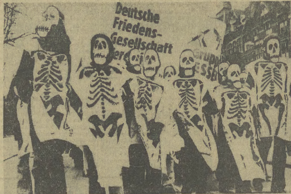
HOLLANDIA. W krajach Europy nie słabnie fala protestów przeciwko produkcji ludobójczej broni, jaką jest bomba neutronowa. Na zdjęciu: demonstracja zorganizowana niedawno w Amsterdamie, w której wzięło udział 50 tys. osób.

tronowej między USA a ich zachodnioeuropejskimi sojusznikami z NATO zostały przejętowo zawieszona. Dyskusje są kontynuowane, głównie w trybie dwustronnym. Dowodzą tego zeszytologiczne konsultacje w Bonn i w Londynie podsekretarza stanu USA, Warren’a Charlisa (DOKOŃCZENIE NA STR. 2)