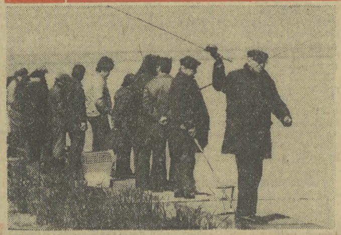
Wiecej ryb czy wędkarzy?