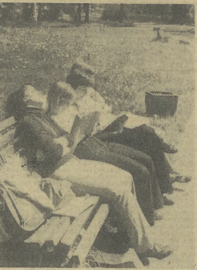
Sejsja egzaminacyjna tuż, tuż ale jak tu się uczyć w taki upał...

wierów „Polifarb”. E. Gierek obejrzał również plac budowy nowego wydziału produkcyjnego markłowickiej fabryki. Następnie E. Gierek zapoznał się z pracą gospodarstwa zootechnicznego Zakładu Doświadczalnego PAN w Grodzie Śląskim, specjalizującego się w no-