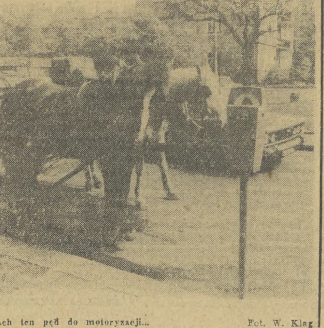
Ach ten pęd do motoryzacji...

We wtorek w Mini-Trybunie poinformowaliśmy o kłopotach MPEC i VIII LO w Krakowie ze zdobyciem tzw. lupin nakrywanych E-2, których brak uniemożliwia zakończenie wykonywanych przez MPEC w czynie społecznym prac przy podłączeniu budynku liceum do miejskiej sieci ciepłowniczej. Reakcja na nasz apel o pomoc była natychmiastowa, czego dowodem poniższy list, który otrzymaliśmy z Oddziału Budowlano-Montażowego „Stomilu” w Wolbromiu: „W odpowiedzi na apel Mini-Trybuny zamieszczony w „Gazecie Krakowskiej” z dnia 10. VI. 75 r. o lupiny E-2 dla VIII Liceum Ogólnokształcącego w Krakowie, informujemy uprzejmie, że możemy odstąpić 27 szt. poszukiwanych lupin. niewielka to ilość, ale może w jakimś stopniu przy pomocy jeszcze innych Przedsiębiorstw pomoże skompletować potrzebną ilość. Po odbiór należy zgłosić się wraz z zamówieniem codziennie do godz. 12 własnym środkiem transportu.” Serdecznie w imieniu zainteresowanych dziękujemy. (ms)