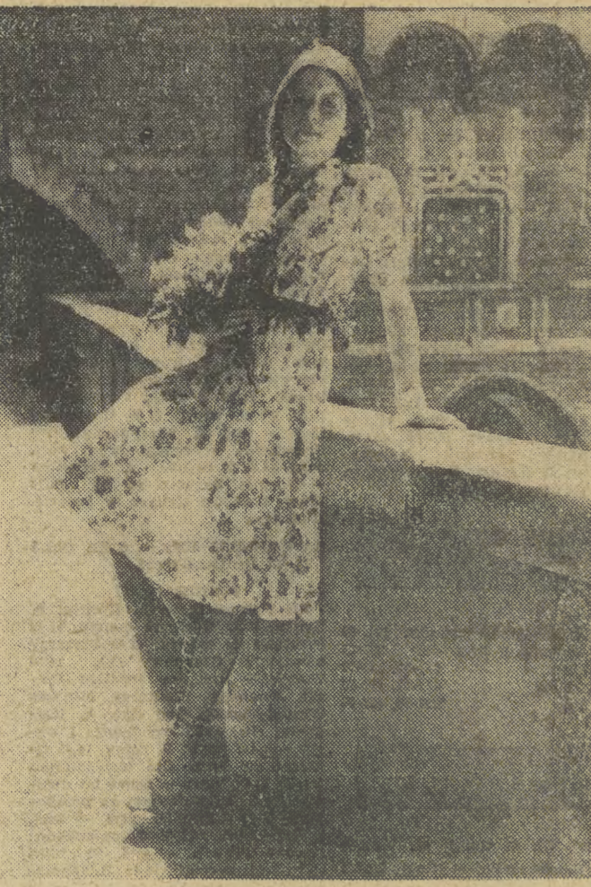
Oczekiwania CAF — Sochor