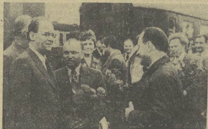
Powitanie delegacji ukraińskiej na Dworcu Głównym w Krakowie.

Jak podają agencje zachodnie wczoraj po południu wykonany został w Rijadzie wyrok śmierci na zabójcy saudyjskiego króla Fajsała, księcia Bin Musada Abd-El Aziz.