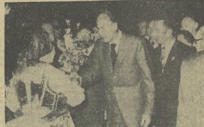
Wizytanka kwiatów dla prezydenta Francji od krakowianek kwiaciarek.

W planach naszych i ich realizacji mamy mocne oparcie w bliskiej współpracy z Związkiem Radzieckim i innymi krajami RWPG, dysponującymi potężnym potencjałem i chłonnym przeszło 350-milionowym ryn-