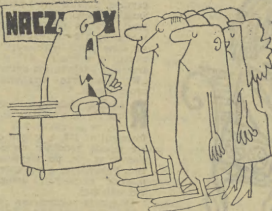
— Mój wlop proszę traktować jako wczasy dla was!