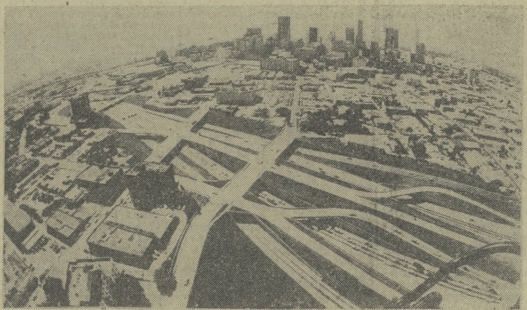
Dallas w „krzywym obiektywie” amerykańskiego fotoreportera. Zdjęcie zostało wyróżnione na międzynarodowej wystawie fotograficznej poświęconej problemom przeliczenia świata.

Sekretarz generalny Ligi Arabskiej, Mahmud Riad oświadczył w środę w Kairze, że Liga nadal będzie popierać ruch palestyński oraz bronić integralności terytorialnej Libanu. Potwierdził on również wiadomość o wycofaniu się oddziałów syryjskich z rejonu Sajdy. Mimo kolejnych apeli o przerwanie walk, sytuacja wojskowa w Libanie nie uległa zasadniczym zmianom. Nadal docierają informacje o starciach o większym lub mniejszym nasileniu w różnych rejonach kraju, m. in. w Baalbecku we wschodnim Libanie, w okolicach portu Tripoli, jak i w rejonie Bejrutu, głównie w obleganym nadal przez siły prawicy chrześcijańskiej, palestyńskim obozie Tel El-Zaatar.