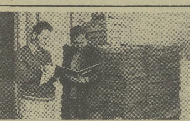
Fot. Otto Link