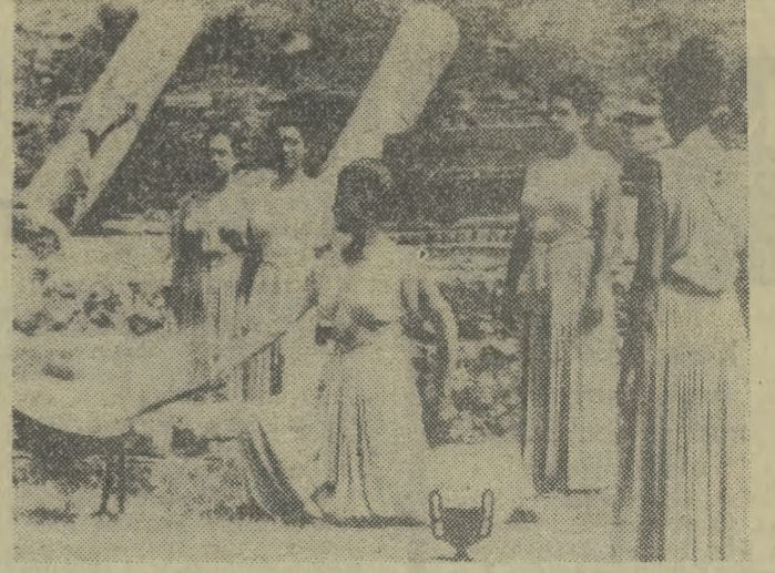
13 bm. w Olimpii o godzinie 9.00 nastąpiło zapalenie znicza olimpijskiego. Wzniesienie ognia, zgodnie z tradycyjnym i uroczystym rytuałem powtarzającym się przed każdymi Igrzyskami Olimpijskimi, dokonała aktorka Maria Moscholou.

DZIENNIK POLSKIEJ ZJEDNOCZONEJ PARTII ROBOTNICZEJ KRAKÓW ■ NOWY SĄCZ ■ TARNÓW