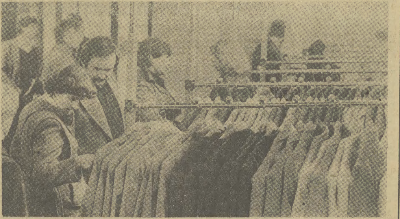
Tylko jak trafić na dostawę towaru...

Tu nie ma na razie kłopotów surowcowych; dziwny wyjątek czy dobra współpraca z kooperantami