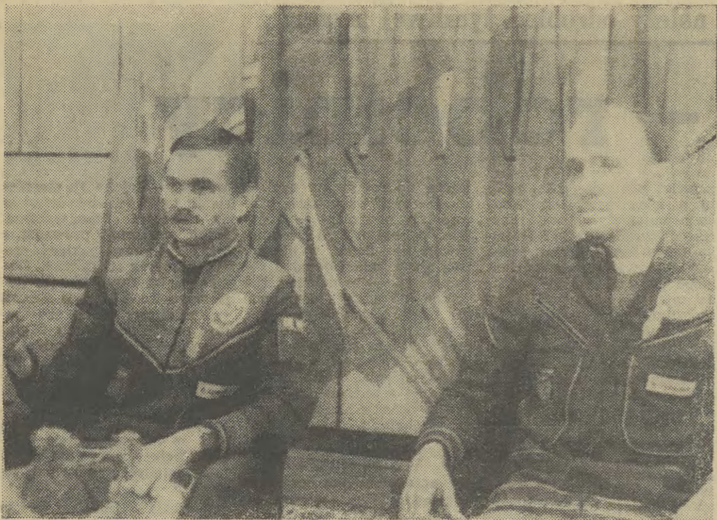
211 dni na orbicie