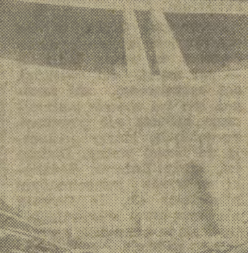
Widok z lotu ptaka na ulicę w Krakowie.

Przykład sąsiadów z południa dowodzi, że praca wydatnie pomaga przewyciężyć ciężki szok psychiczny, jakiemu nieuchronnie ulega społeczeństwo pod wpływem głębokiego kryzysu instytucji politycznych. Proponuję preto, by ogniewa Patriotycznego Ruchu Odnowienia Narodowego, które zaczęły działalność, od zatławiania spraw drobnych, podjęły teraz sprawy najważniejsze, a wśród nich — sprawę odnowy Krakowa i innych narodowych obowiązków.