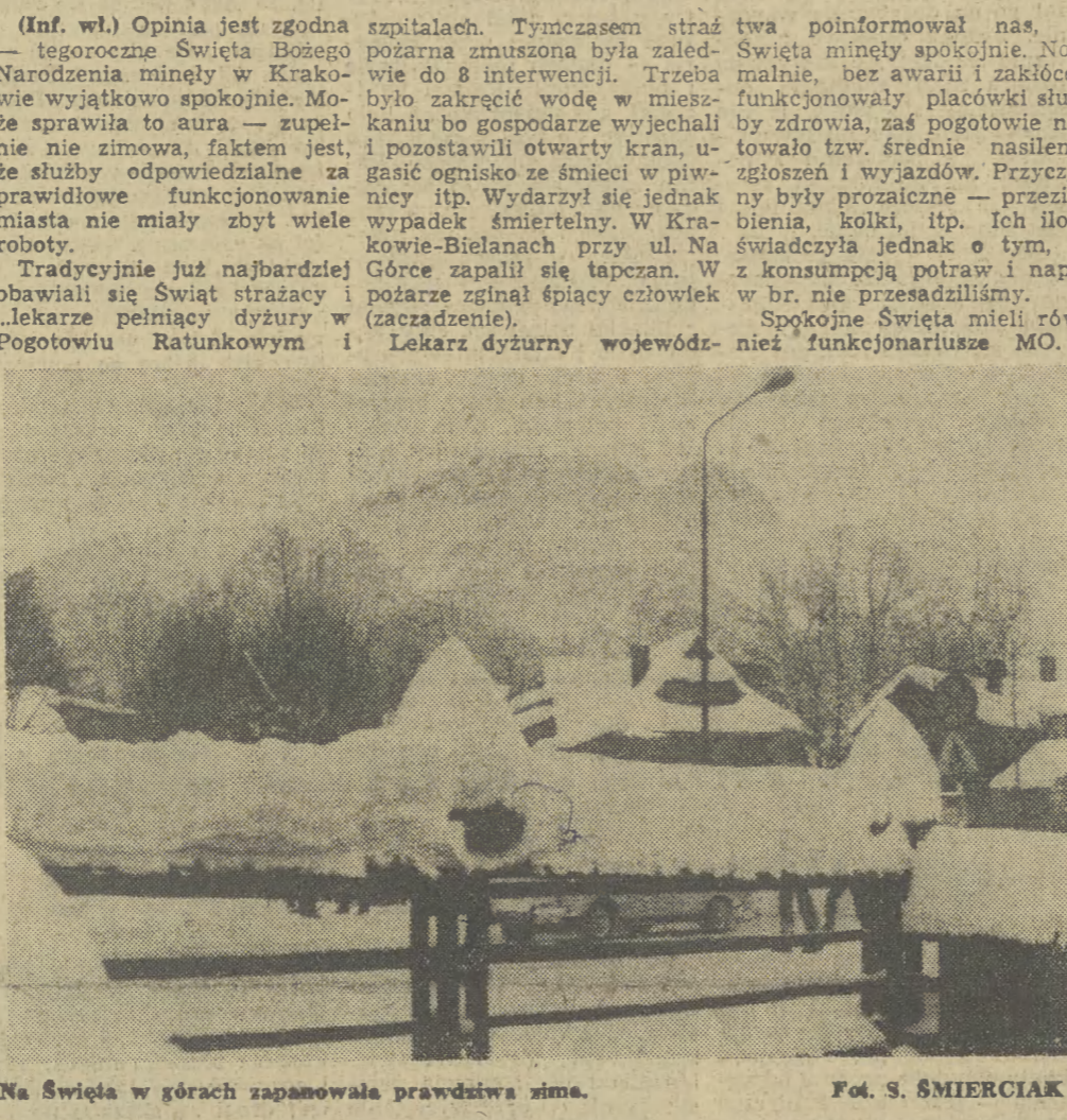
Na Święta w górach zapanowała prawdziwa zima.

MOSKWA (PAP). Agencja TASS ogłosiła następujące oświadczenie. Ostatnio w niektórych państwach zachodnich rozpowszechnia się niedorzeczne insynuacje, jakoby pewne państwa socjalistyczne były zamieszane w próbę zamachu na papieża Jana Pawła II w maju ubiegłego roku. Ostrze tej kampanii, na wskroś przepojonej kłamstwami, godzi w Bułgarię, choć podjęte zapętki zdają się także wobec Związku Radzieckiego. Na tego rodzaju absurdy nie należałoby w ogóle zwracać uwagi, tym bardziej, że oszczercy już dostali za swoje. Chodzi jednak o próby grania na uczuciach ludzi naiwnych, szczególnie na uczuciach wierzących. Fakty świadczą, że brudne nici tej prowokacji prowadzą do tych, którzy popierają represyjne reżimy w rodzaju chilijskiego czy salwadorskiego, którzy patronują izraelskim agresorom i terrorystom, którzy przywykli do codziennych przejawów gwałtu w swoich własnych państwach. W każdym uczciwym człowieku wybrkiłki pozabawionych skrupułów imperialistycznych służb wywiadowczych wywołują niesmak. Czy tylko służb wywiadowczych? Nie ulega wątpliwości, że zawiodła rachuba w zmniejszeniu niechęci do Związku Radzieckiego i do innych państw socjalistycznych, na odwrócenie w jakimś stopniu uwagi od psychozy militarystycznej, która towarzyszy przygotowaniom Zachodu do wojny, budzącym coraz większy niepokój szerokie mas, niezależnie od przekonań społecznych czy wyznania.