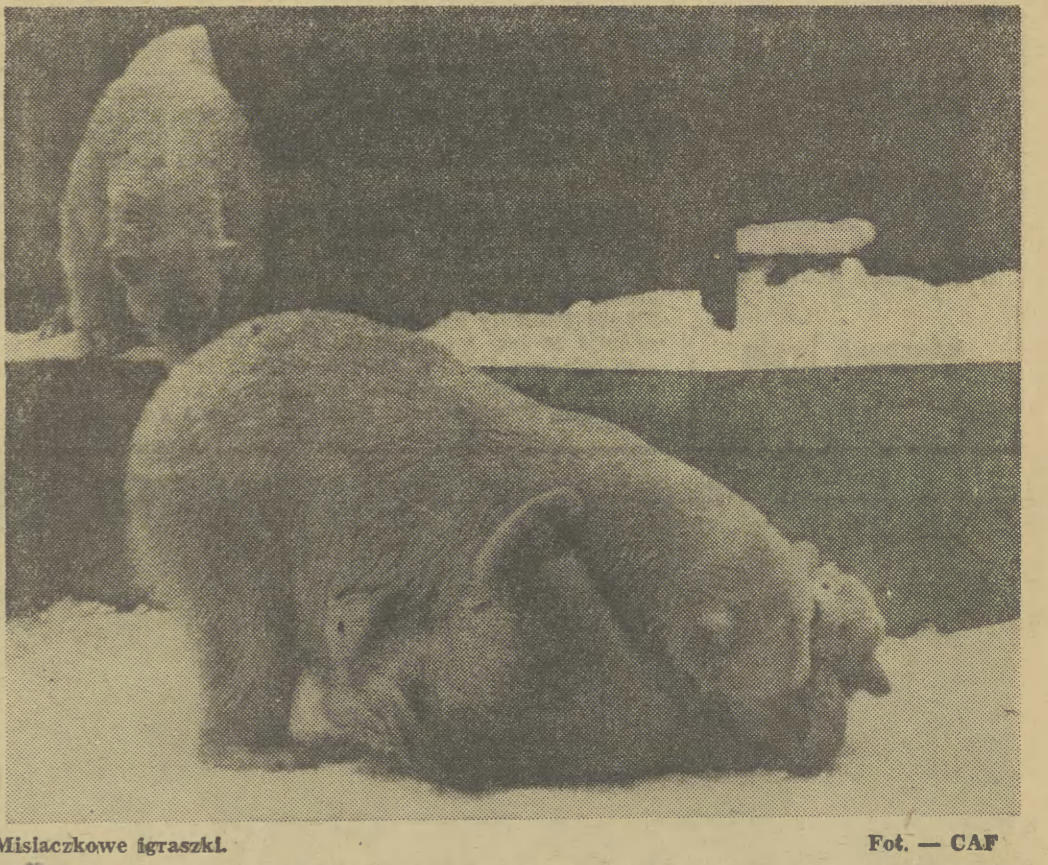
Misłackzkowe igraszki.