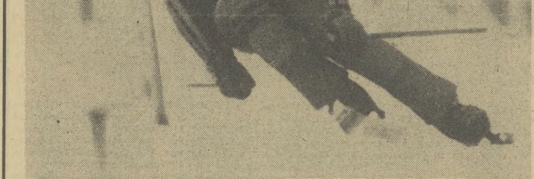
Najlepsi narciarze świata mają kilkudniową przerwę. Kolejne zawody slalomowe o Puchar Świata rozegrane zostaną dopiero na początku stycznia. Na zdjęciu Sławek I. Stenmark, który prowadzi w klasyfikacji slalomu specjalnego wspólnie ze swym rodakiem S. Strandem — po 45 pkt. Narciarskie Puchary Świata przyniosły na samym początku sezonu kilka niespodzianek dużego kalibru. Jak będzie w styczniu?