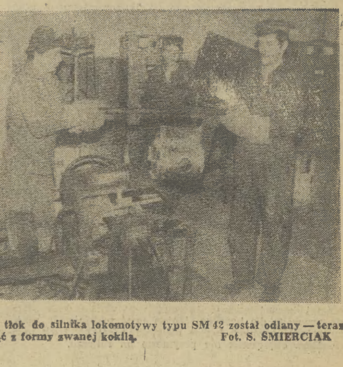
ZNTK NOWY SĄCZ — kolejny tłok do silnika lokomotywy typu SM 42 został odlany — teraz trzeba go bardzo delikatnie wyjąć z formy gwanej kokila.

cji, która pozwoli zaoszczędzić kilkaset tysięcy dolarów w skali roku. W ZNTK jeszcze nie ochłonęli po udanych próbach, a już myślą o jutrze. O budowie nowej odlewni, w której można by produkować tłoki dla 4 pokrewnych zakładów w kraju. W drodze ze Swiebodzina jest piec-gigant do wyzarzania. Fundament pod niego postawiono w 3 dni i nocie, kiedy specje od budownictwa mówili o 2 miesiącach. Droga od decyzji do rozruchu trwała niezwykle krótko: mniej niż rok. „Tylko nie piszcie o japońskim tempie. Mamy własne wzorce. To było kolejarzkie tempo. Nasi استادowie, kolejarze tego właśnie zakładu wnieśli dom robotniczy w 2 lata. A działo się to na początku naszego stulecia” — notuje na zakończenie krótkiej wizyty w ZNTK. KAZIMIERZ BRYNDZA