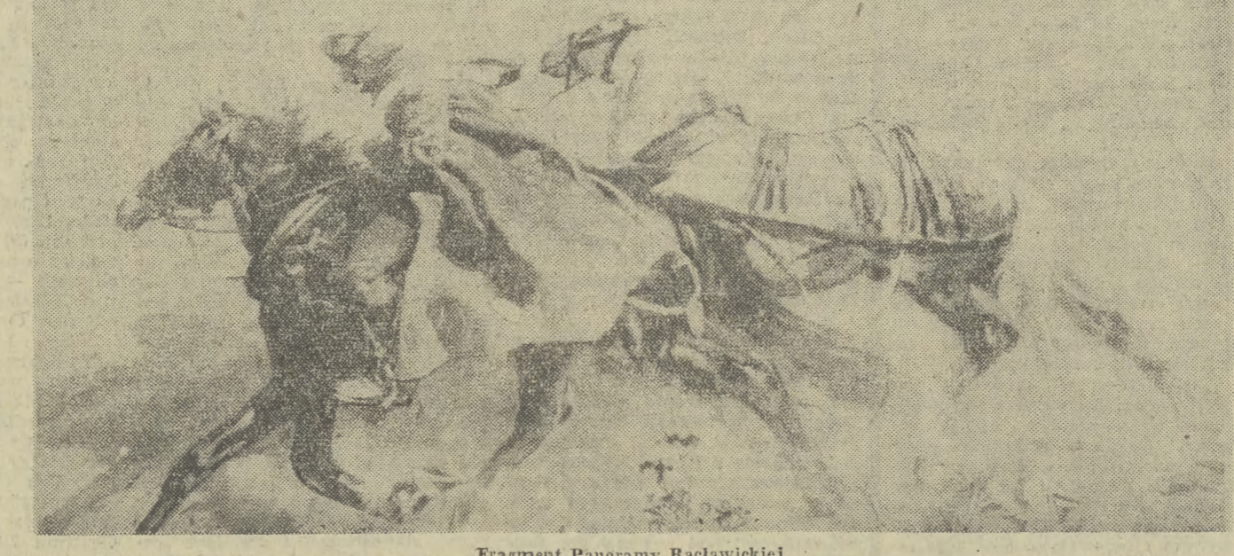
Fragment Panoramy Racławickiej