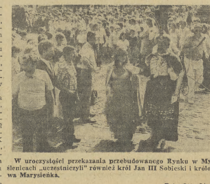
W uroczystości przekazania przebudowanego Ryнку w Myślenicach „uczestniczyli” również król Jan III Sobieski i królowa Marysińska.