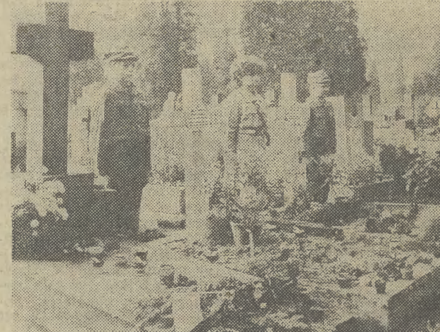
W Nowym Sączu przy grobach harcerzy zamordowanych przez hitlerowców warty zaciągnęli druhowi i druhowie ze szczebu przy szkole nr 8.