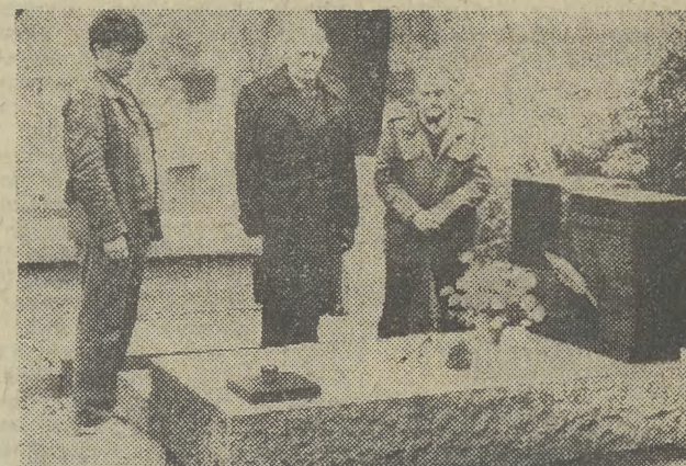
Przedstawiciele redakcji „Gazety Krakowskiej” składają kwiaty na grobie redaktora Wacława Piłtuy.

(Inf. wł.) Święto Zmarłych w Polsce to dzień żałoby i pamięci o tych, którzy odeszli od nas na zawsze. Na cmentarzach, w miejscach pamięci narodowej zaświecy się tysiące zniczy. W Krakowie i województwie trzy świąteczne dni upłynęły godnie i spokojnie. Zapłonęły lampki żałobne na kilku-nastu krakowskich cmentarzach. Składano hołd tym, którzy odeszli — swym najbliższym i tym, którzy zginęli w walce o wolność i niepodległość naszej Ojczyzny. Już w czwartkowe przedpołudnie społeczeństwo Krakowa wyruszyło na groby. Na cmentarzu Rakowickim spotkałam grupkę uczniów ze Szkoły Podstawowej nr 95. Przyszli oni tutaj, aby zapalić znicze pod obeliskiem ofiar faszyzmu, który został uroczystie odsłonięty w ubiegłym tygodniu. Tysiące świec oświetliło komin krematorium — symbol (CIĄG DALSZY NA STR. 2)