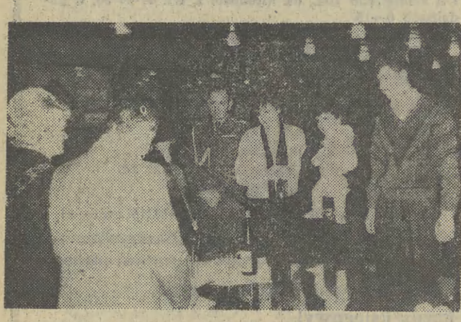
Po raz pierwszy w historii działalności Domu Kultury i Nauki „Mors” w Debicy odbyła się uroczystość nadania imion dzieciom pracowników Kombinatu Rolno-Przemysłowego „Igluopol” w Debicy. W czasie uroczystości, która zgromadziła rodziców i przedstawicieli władz miasta nadano imiona 21 dzieciom. Uroczystość uświetniły występy kapeli ludowej Zespołu Pieśni i Tańca „Igluopolanie”.