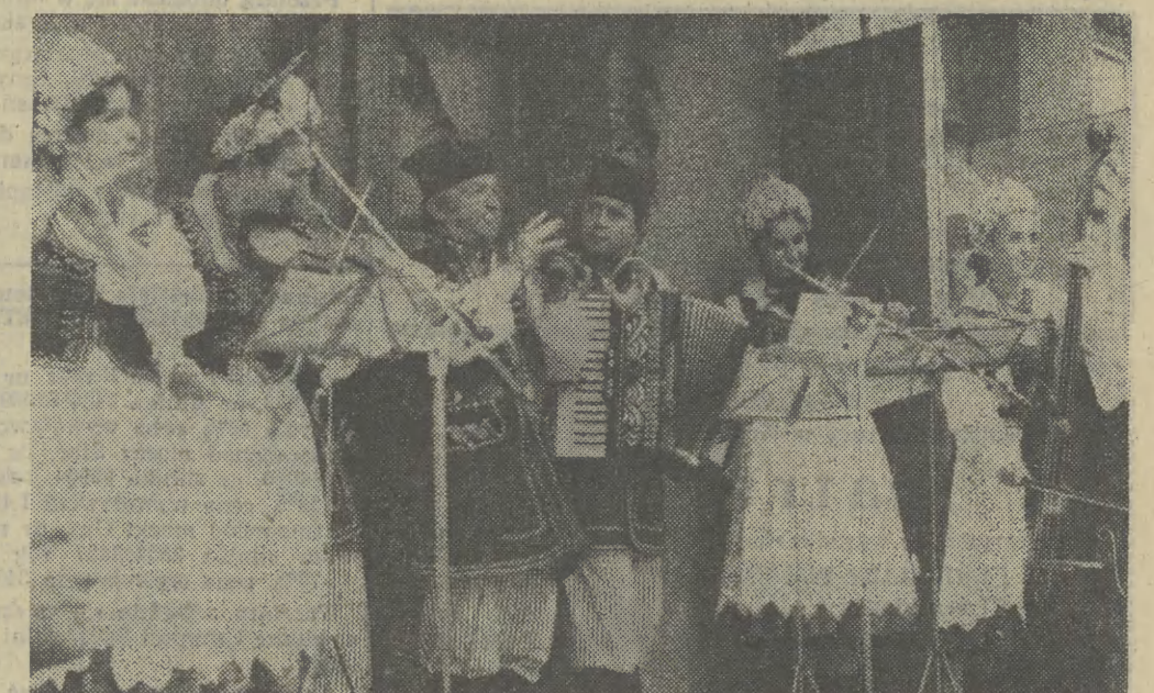
„Sobólka” — taką nazwę nosi regionalny zespół i kapela działające od 10 lat przy Domu Kultury Zakładów Mechanicznych w Tarnowie. Na zdjęciu: gra kapela „Sobólka” z Tarnowa.

pogotowie TARNÓW (Dzierzynieckiego 5) — tel. 999 BOCHNIA (22 Lipca 25) — tel. 999 BRZESKO (Kosciuszki 66) — tel. 999 i 307-01 DĄBROWA TARNOWSKA (Szpitalna 1) — tel.