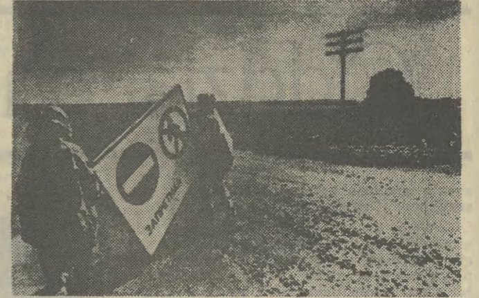
Akcja ratunkowa wokół Czarnobyla

W dalszej części artykułu prof. Z. Jaworowski opisuje przebieg wypadku, podjęte działania ratownicze i skutki całego zdarzenia, opierając się przy tym głównie na raportach radiologicznych i raporcie Komitetu Naukowego Narodów Zjednoczonych ds. Skutków Promieniowania Atomowego (UNSCEAR) przygotowanym dla Zgromadzenia Ogólnego NZ w 1988 r. Raport UNSCEAR oparty jest na danych dostarczonych przez 34 kraje i stanowi najpełniejsze z dotychczasowych opracowań na temat zagrożeń radiacyjnych wywołanych katastrofą w Czarnobylu.