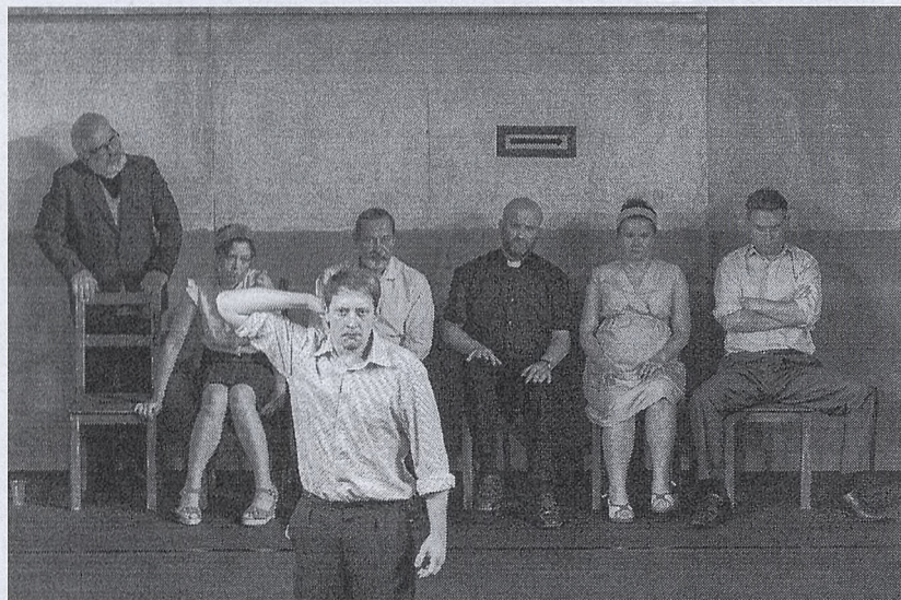
'Gdy przyjdzie sen,' Teatr Ludowy z Krakowa, reż. M. Bogajewska

W Zabrzu zakończył się XIX Festiwal Dramaturgii Współczesnej "Rzeczywistość Przedstawiona". Nagrodę publiczności zgarnął spektakl tutejszego Teatru Nowego "Żli Żydzi" w reż. Marcina Sławińskiego.