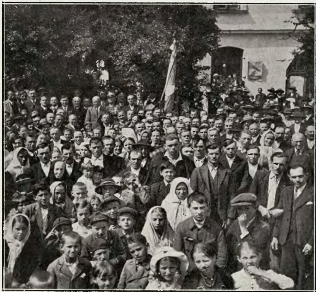
Zjazd Związku Podhalan w dniu 9 sierpnia 1936 r. na Rynku w Czarnym Dunajcu.