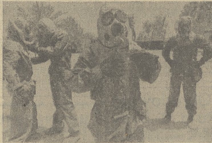
Amerkańscy żołnierze stacjonujący w Arabii Saudyjskiej przemieszczają uniformy chroniące przed skutkami użycia broni chemicznej przez Irak.

Katar jest piątym z kolei państwem arabskim rejonu Zatoki Perskiej, który zgodził się na stacjonowanie wielonarodowych sił