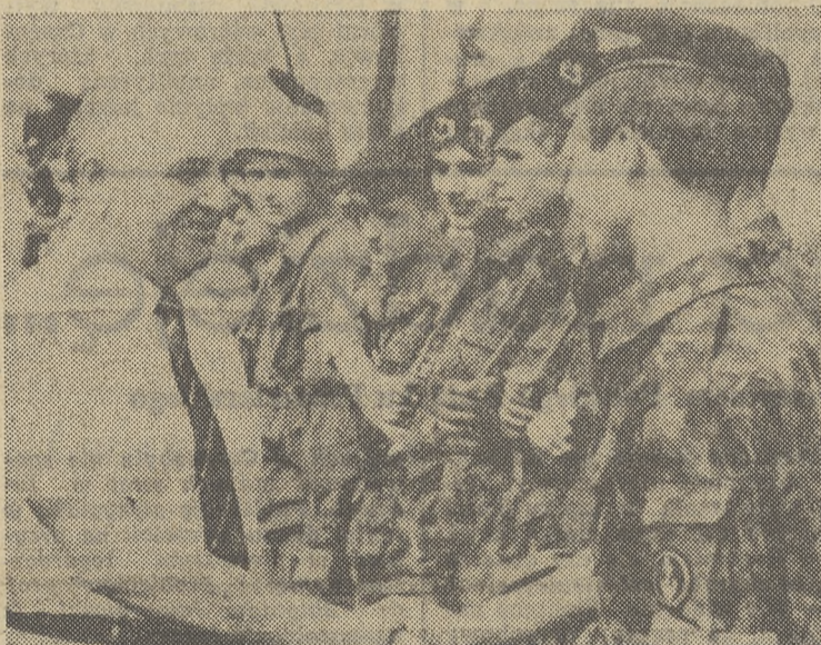
Michaił Gorbaczow w czasie spotkania z żołnierzami w Odessie.

Czy tak będzie rzeczywiście zobaczymy w najbliższym czasie. W każdym razie wiadomo, że dla ratowania swej gospodarki Związek Radziecki musi dokonać radykalnych zmian. Nie tylko zresztą w dziedzinie gospodarki. Dodajmy, że ostatnio Michaił Gorbaczow w czasie spotkania z żołnierzami, uczestniczącymi w manewrach u wybrzeży Morza Czarnego oświadczył, że Związek Radziecki w obecnej formie wyczerpał swoje możliwości i całkowicie się przeżył, i że nieodzwrotnie jest przebudowa stosunków własnościowych i narodowościowych w Związku Radzieckim.