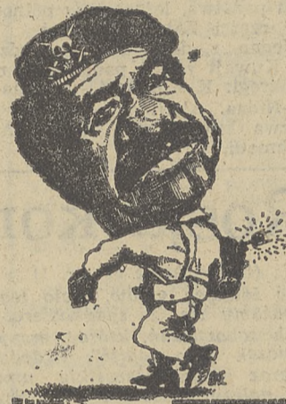
Prezydent Iraku: Saddam Husajn

wczesnego ostrzeżenia, sprzęt do prowadzenia wojny elektronicznej i zakłócania systemów broni ofensywnej przeciwników oraz rakiety wyrzeliwane z pokładu samolotów. Systemy te były (Dokończenie na str. 2)