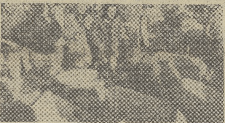
Policjanci usuwają z drogi „wipowców” blokujących dojazd do zapory.