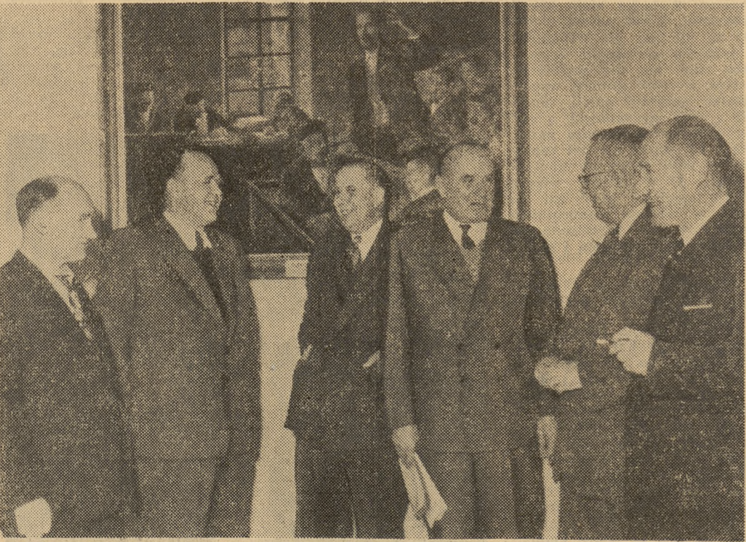
Grupa działaczy związkowych w czasie przerwy w obradach

W miarę jednak rozwijającej się dyskusji lody pękaly i chociaż trudno byłoby to określić jako ogólnozwiązkowe „kochajmy się”, to w każdym razie atmosfera coraz bardziej się ocieplała. Nie było różnic, gdy delegaci wyrażali głęboką troskę i poczucie odpowiedzialności za stan oświaty, kiedy wskazywali na najdrażliwsze i najjaskrawsze zaniedbania i błędy na odcinku oświaty, kiedy szukali wspólnie środków naprawy. Nie było też znaczących rozbieżności, kiedy oceniali dotychczasowe role Związku, jego działalność, jego błędy. Merytoryczna ocena przyjmowana była na ogół z aprobatą. Forma tej oceny budziła jednak mniej lub więcej gwałtowne sprzeci-