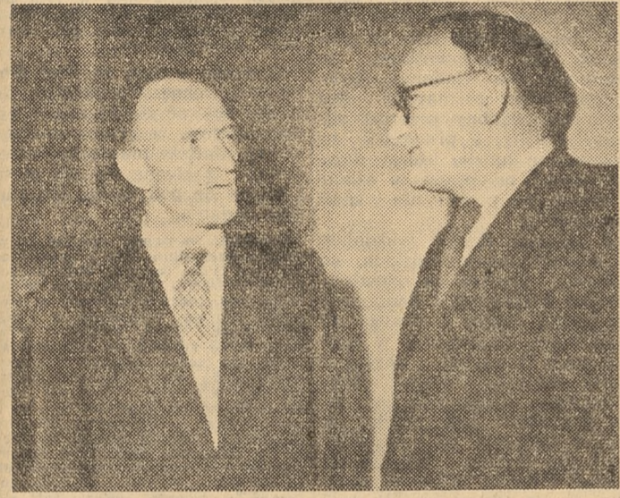
Minister Bienkowski w rozmowie z kol. Woźniakowskim z Łodzi

M USZE Wam, Drodzy Towarzysze, Przejaciele, zrobić mały zawód, mianowicie oświadczyć, że dziś Wam nie powiem i to z bardzo prostych przyczyn. Przede wszystkim dlatego, że powołanie mnie na stanowisko wypadło w okresie zasadniczych i głębokich przemian w Polsce. To znaczy, że tu nie wystarczy gdzieś tam jakiś jeden trybik przesunąć i pchać dalej, ale trzeba całą maszynę poważnie przebudować. Wszelka raptowna przebudowa byłaby niewskazana. Trzeba robić to rzeczy z głębią myśla. Podejmuję to pracę w momencie, kiedy zagadnień duzych, ogólnopanstwowych, ogólnonarodowej wagi jest wiele i jeszcze przez te dni wiele spraw odciągać mnie po prostu chociażby z tej sali. Nie mogłem, jak się to mówi po warszawsku, wymigać się od całego szeregu spraw politycznych czy gospodarczych o zasadniczym dla kraju znaczeniu.