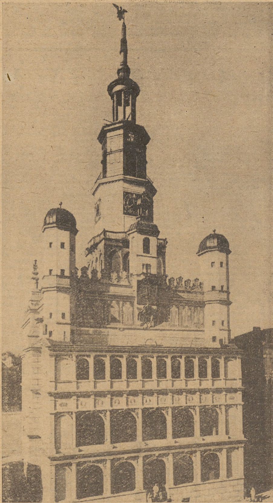
Ratusz w Poznaniu

Podobnie jak sama krytyka — nawet najostrzejsza — występujących w pracy związkowej braków nie decyduje jeszcze o powodzeniu w pracy tego czy innego ognia organizacyjnego, tak i poprzestanie na ustaleniu nawet najsluszniejszych programów działania nie zapewni dalszego rozwoju działal-