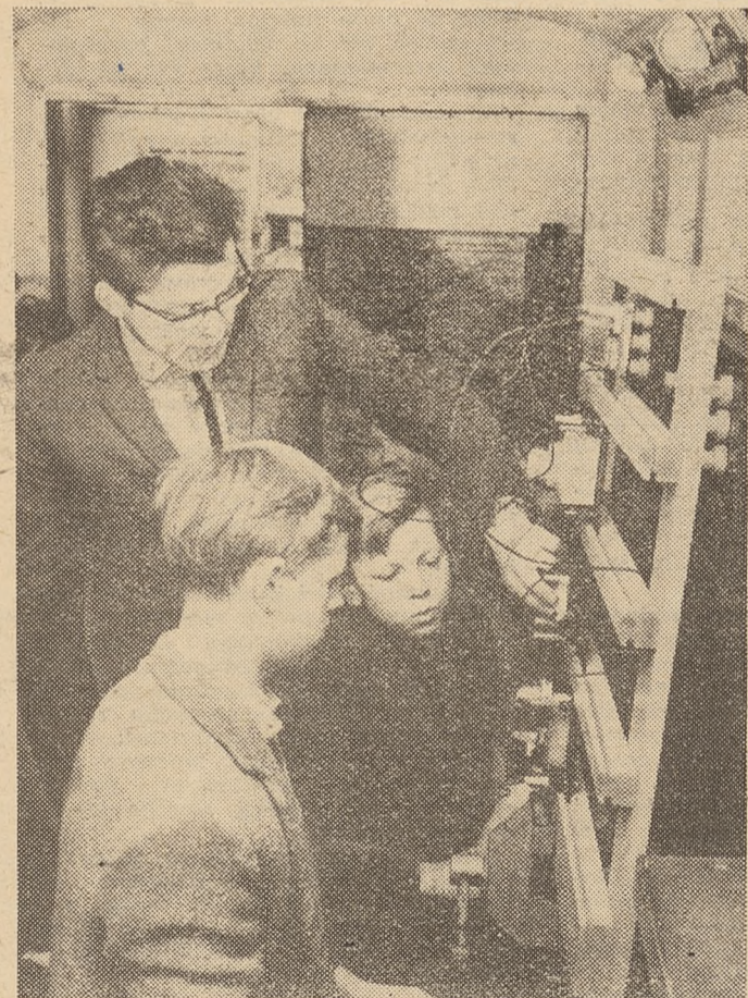
W powiecie Cottbus NRD — dla politechnicznego kształcenia w zakresie elektrotechniki na terenie wsi — zorganizowano ruchomy gabinet elektrotechniczny. Jednorazowo może korzystać z niego 20 uczniów, którzy przeprowadzają w nim pod kierunkiem nauczyciela różne eksperymenty.