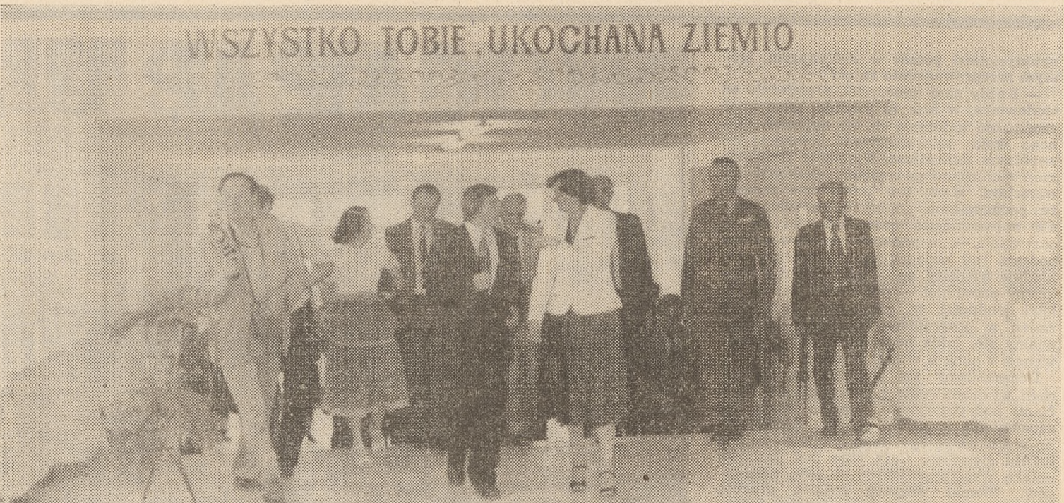
Goście dopisali — z Warszawy i z województwa