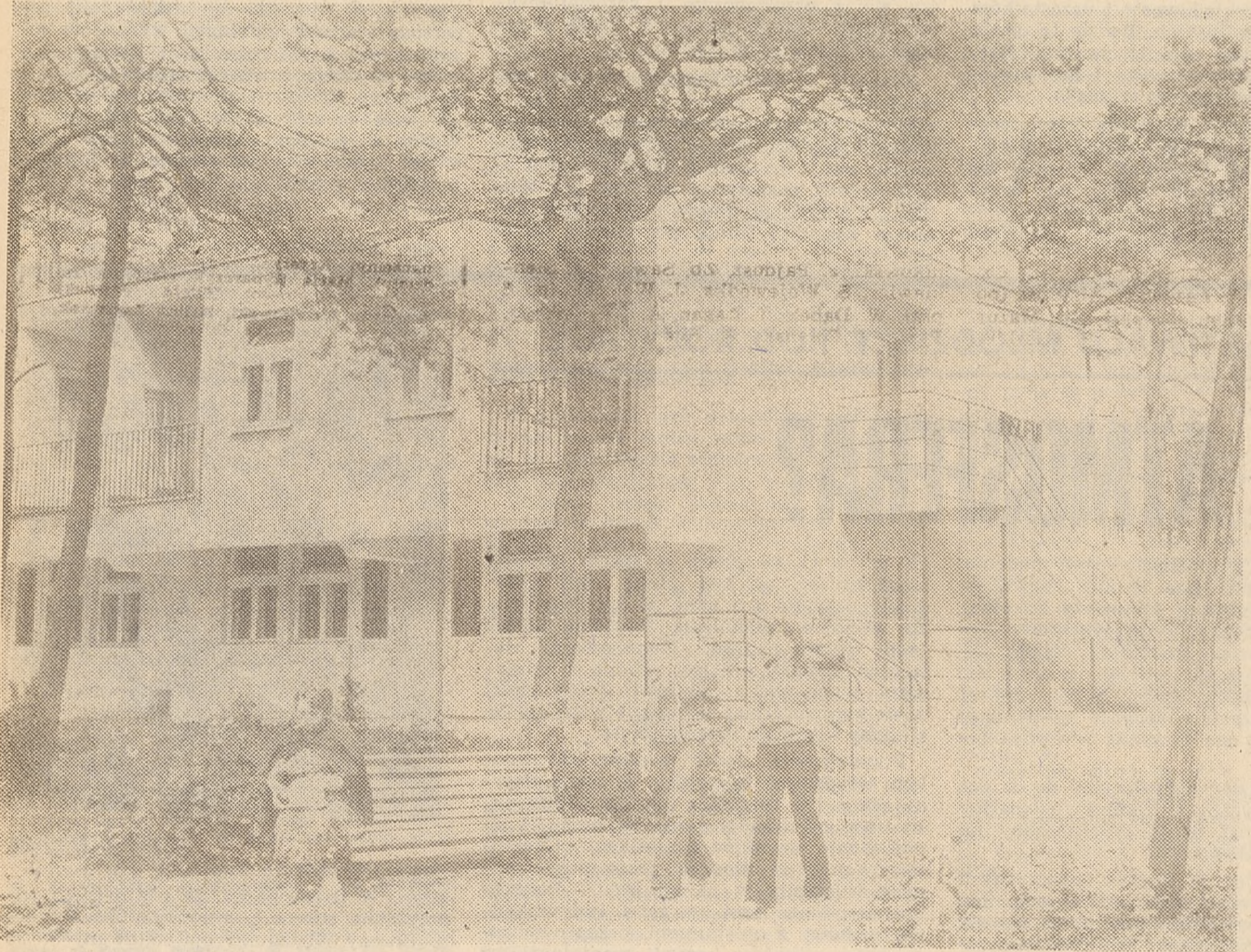
Dom wczasowy ZNP w Krynicy Morskiej

W następnym odcinku o organizowaniu pracy związkowej i planowaniu działalności.