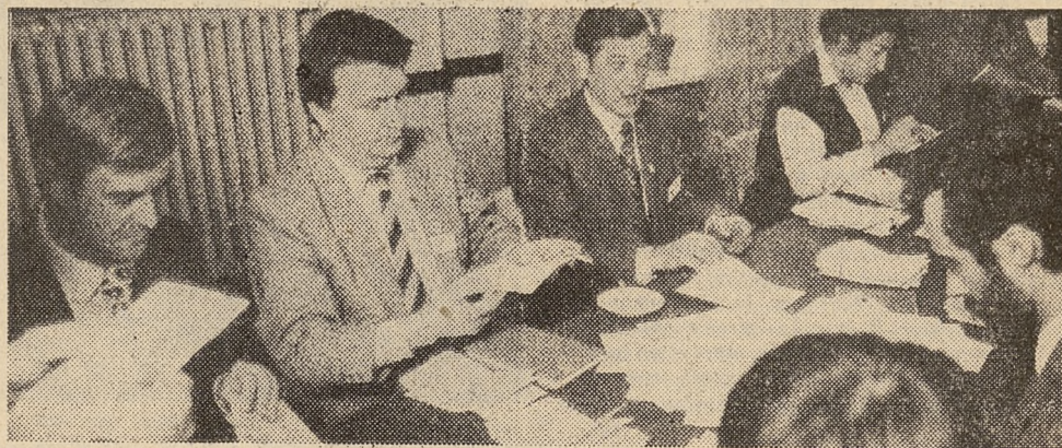
Pracuje komisja skrutacyjna...