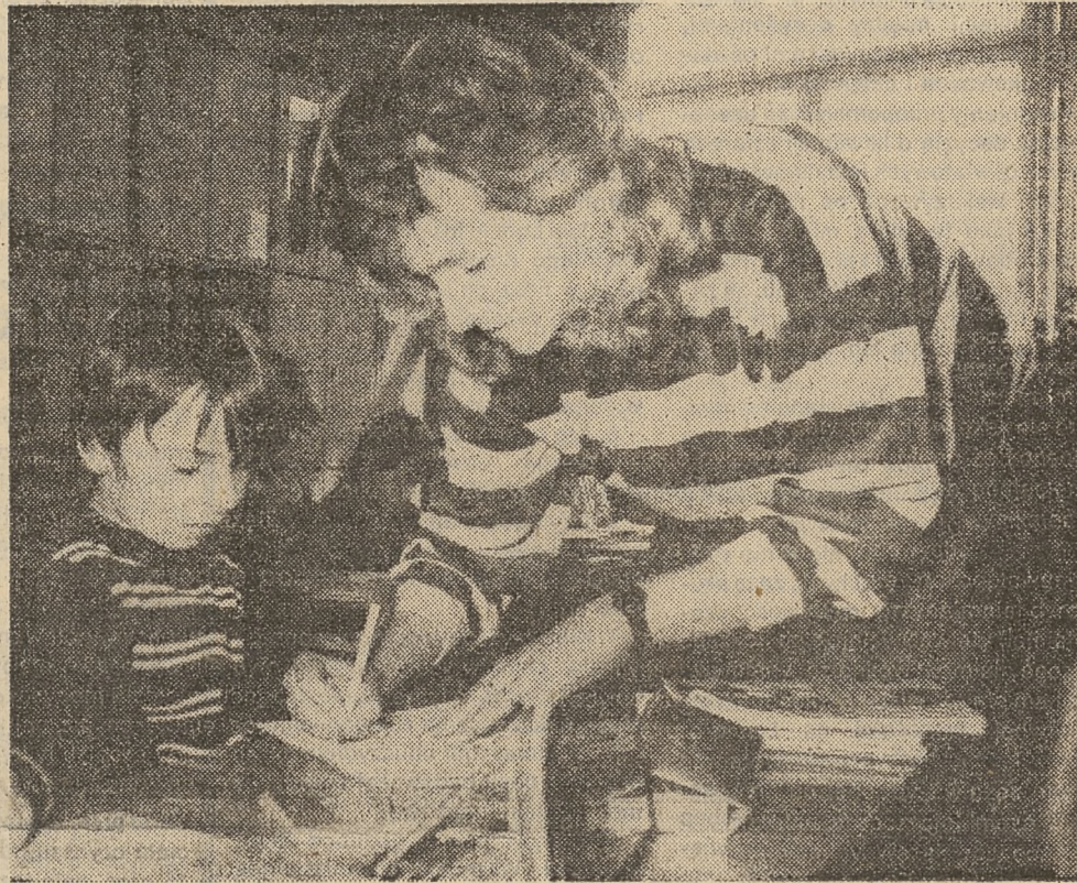
W Szkole Podstawowej nr 9 na ul. Białobrzeskiej w Warszawie. Pani zawsze pomoże.

Z kroniki szkolnej: „W dniu 17.04.1983 r. podjęto rozmowy na zebraniu miejskim w Zagórzcu na temat rozbudowy szkoły”