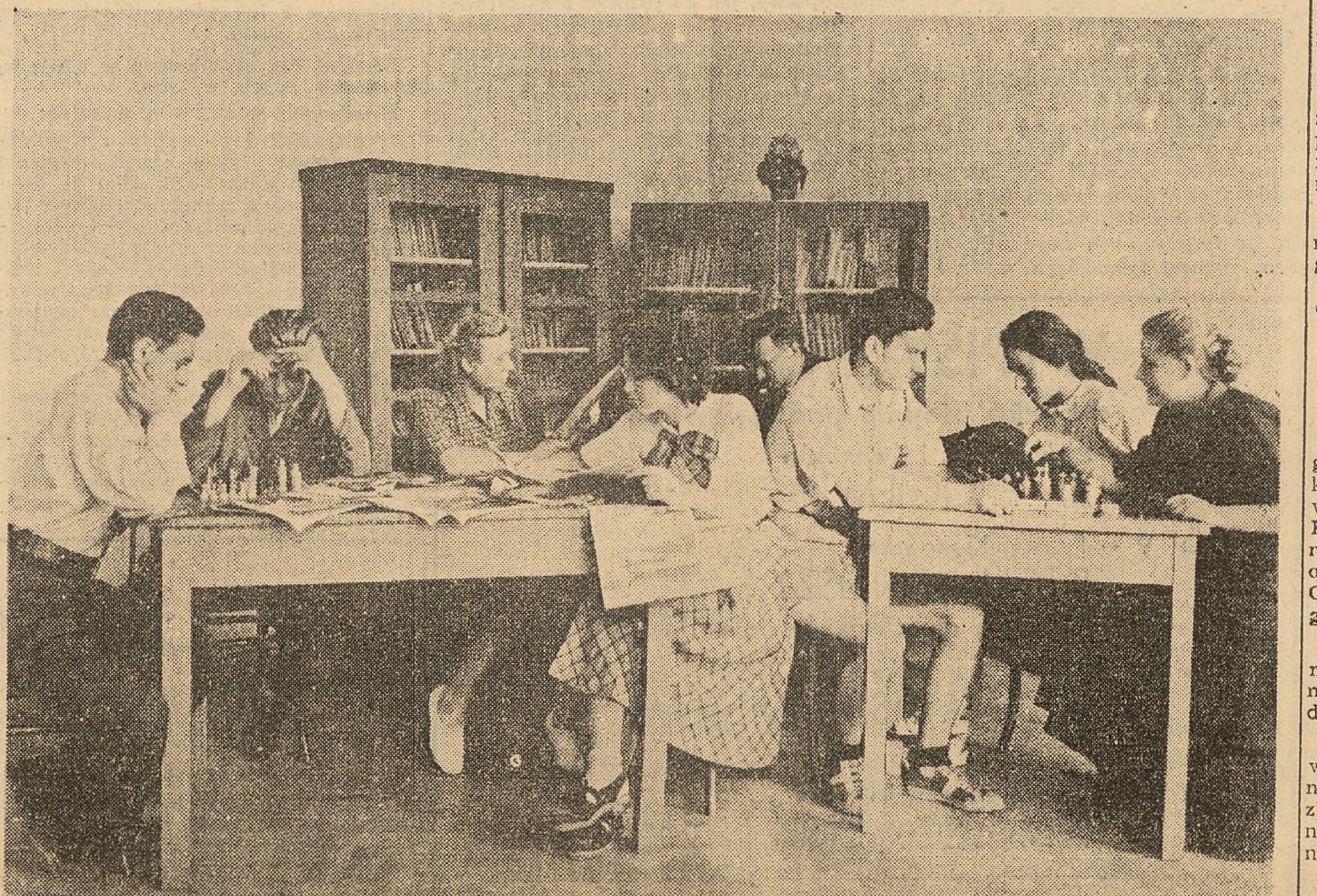
W dobrze urządzonej świetlicy przy szkole Im. Zeromskiego w Warszawie młodzież chętnie spędza wolne chwile.