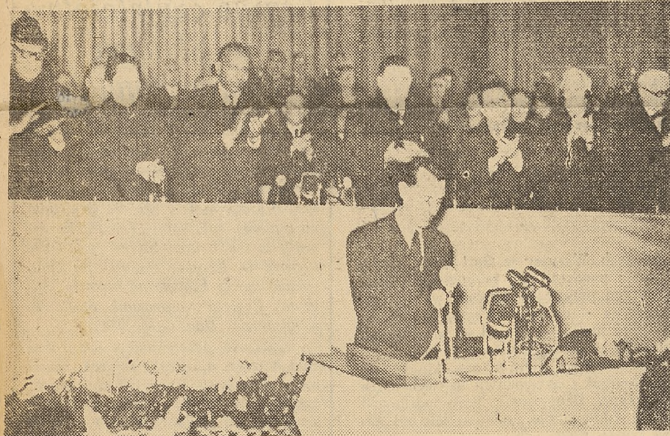
Inauguracja obrad Kongresu

Wiedeń jest w chwili obecnej ośrodkiem zainteresowania opinii publicznej świata. 2200 delegatów reprezentujących 100 krajów rozpoczęło obrady nad dalszym ustokrośnieniem akcji w obronie pokoju, nad wyszukaniem i nakreśleniem dróg i środków tej walki. Obok siebie siedzą Amerykanie i Koreańczycy, Francuzi i Wietnamczycy, Anglicy i Malajczycy nie jak wrogowie, ale jak przyjaciele przepojeni jedną wspólną myślą: nie dopuścić do nowej pozoży wojennej, nie dopuścić do tego, by znów nowe miliony ludzi poniosły śmierć.