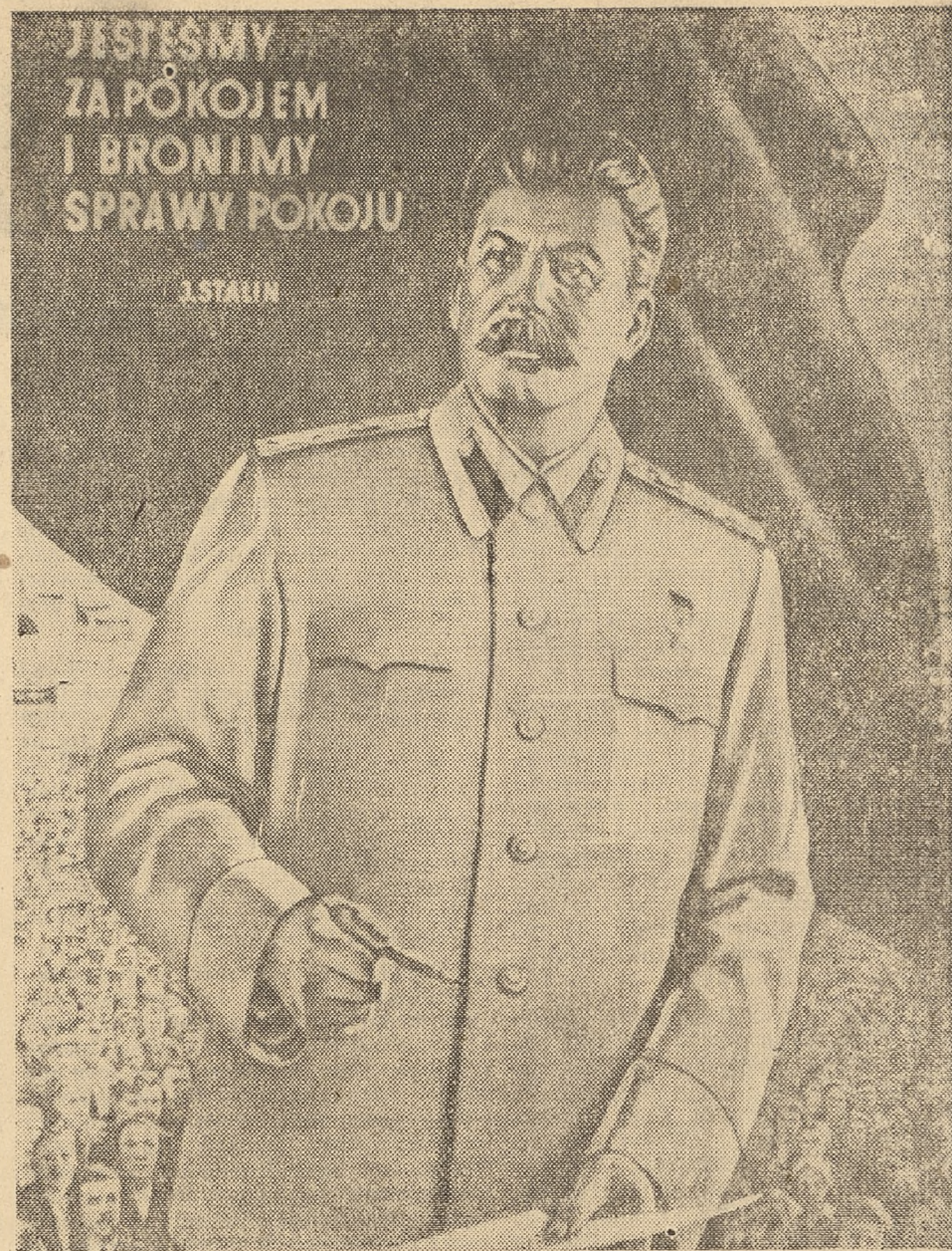
W 73 rocznicę urodzin Józefa Stalina