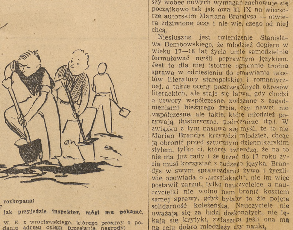
Miczurinowiec z konieczności...