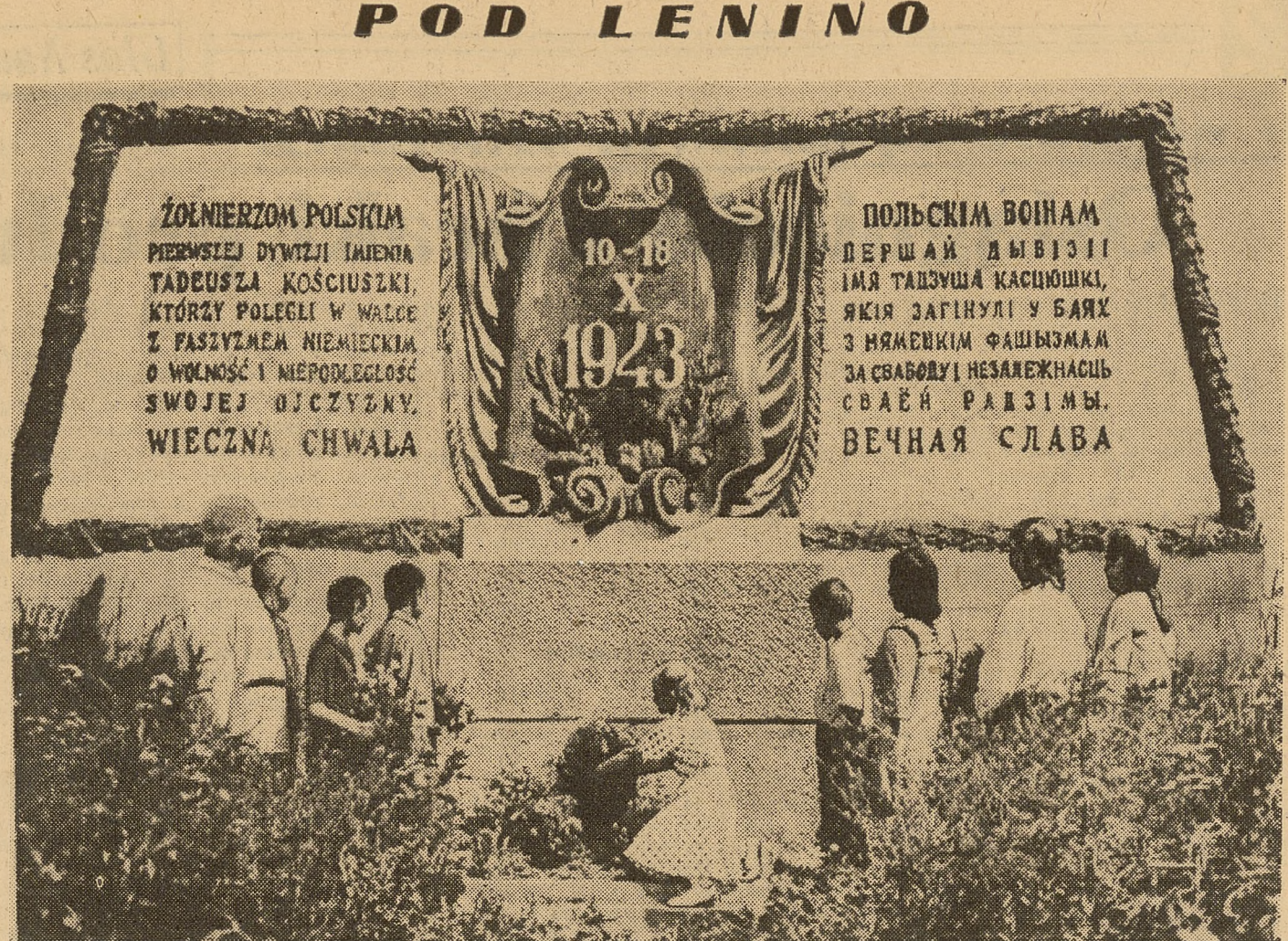
Uczniowie z białoruskiej wsi, Lenino składają kwiaty pod pomnikiem ku czci żołnierzy polskich poległych w historycznej bitwie w dniach 12-13 października 1918 roku.

Z uchwałami Plenum aktyw oświatowy zapoznać się na okręgowych i powiatowych naradach, a ogół nauczycieli, członków Związku, omówi je w toku narad ZOZ i MOZ.