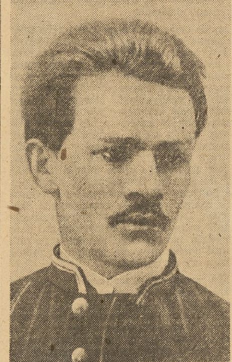
Stefan Żeromski jako uczeń gimnazjum kieleckiego (1886)

Wiele lat potem napisze Zeromski w "Elegiach": "Bem, ten mój mistrz młodych lat i nigdy niezapomniany dobroczyńca duchowy..."