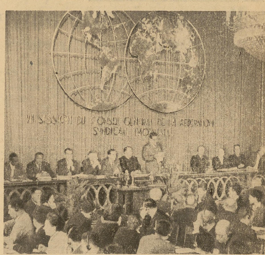
W ostatnich dniach w Warszawie obradowała VII Sesja Rady Generalnej SFZZ, w której uczestniczyli czolowi przedstawiciele międzynarodowego ruchu związkowego z 40 krajów