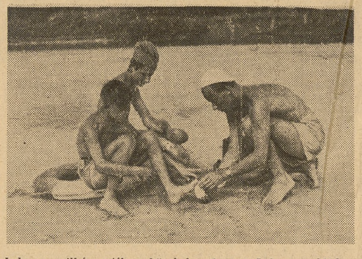
Jeden z „wikłok wiślanych” skaleczył nogę. Lekarz „pokładowy” przy pomocy sanitariusza zakładu opatrunkowego własnego kajaka. Ale od czego jest przedsiębiorczość i pomysłowość harcerska?

ARTYKUŁ dyskusyjny kol. E. Jackiewiczowej (nr 47 „Głosu Naucz.”) dotknął palącego i istotnego zagadnienia: atrakcyjności zajęć harcerskich.