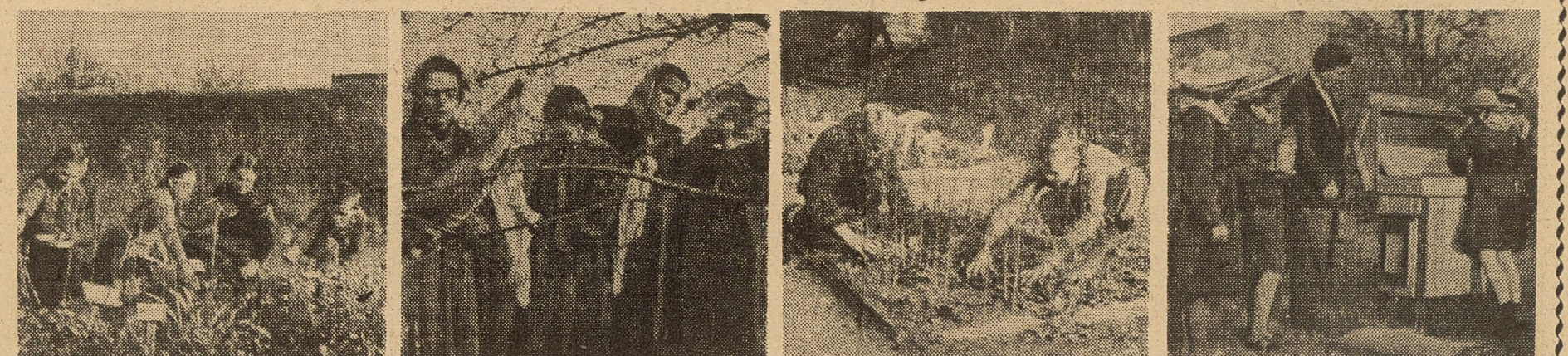
Zbieranie nasion kwiatowych, Przygotowania do sztucznego zapylania, W szkółce drzewek owocowych, Zabezpieczenie ula przed zimą