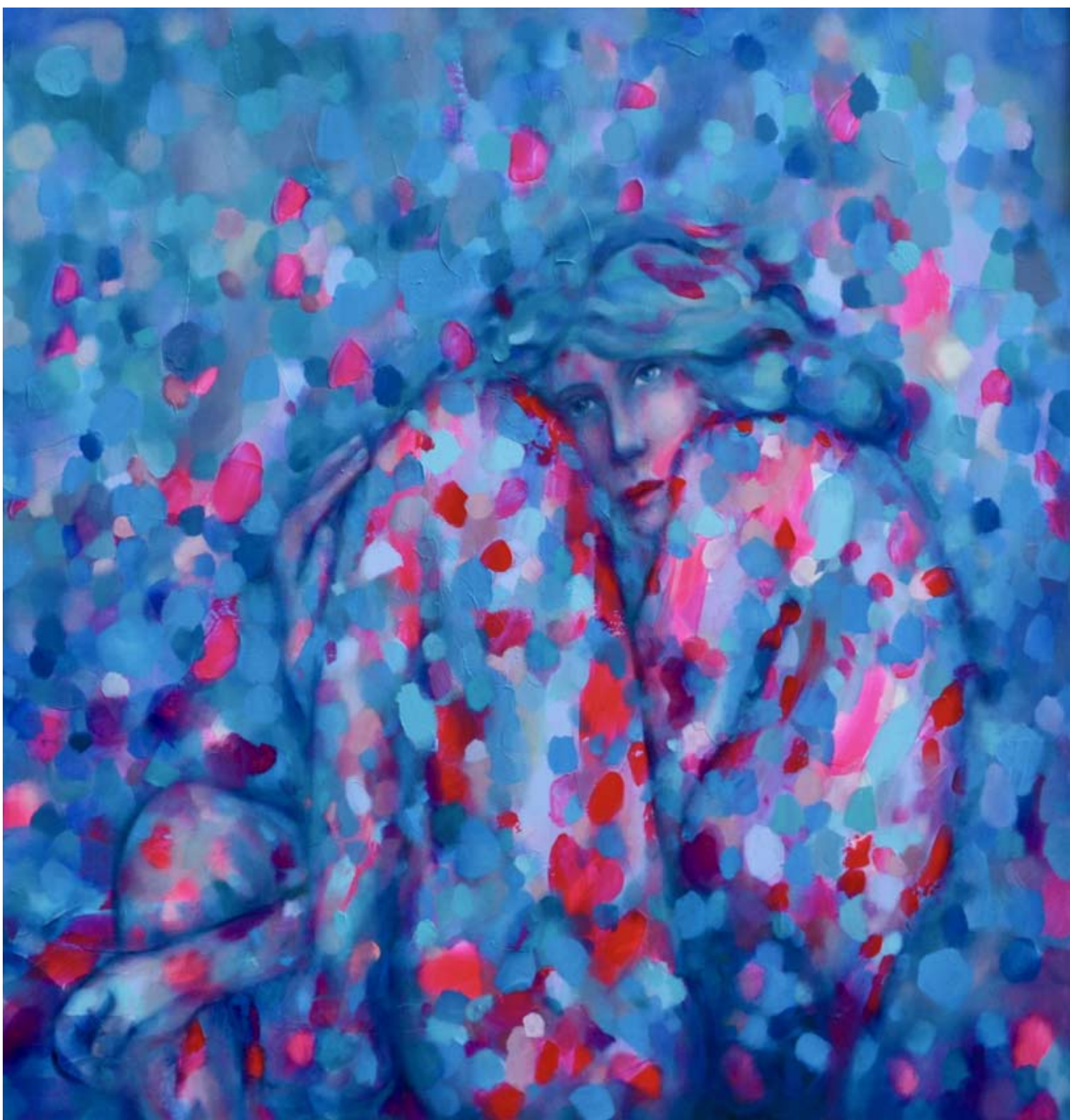
Katarzyna Zawierucha, „Paź”, olej na płótnie 100x100 cm