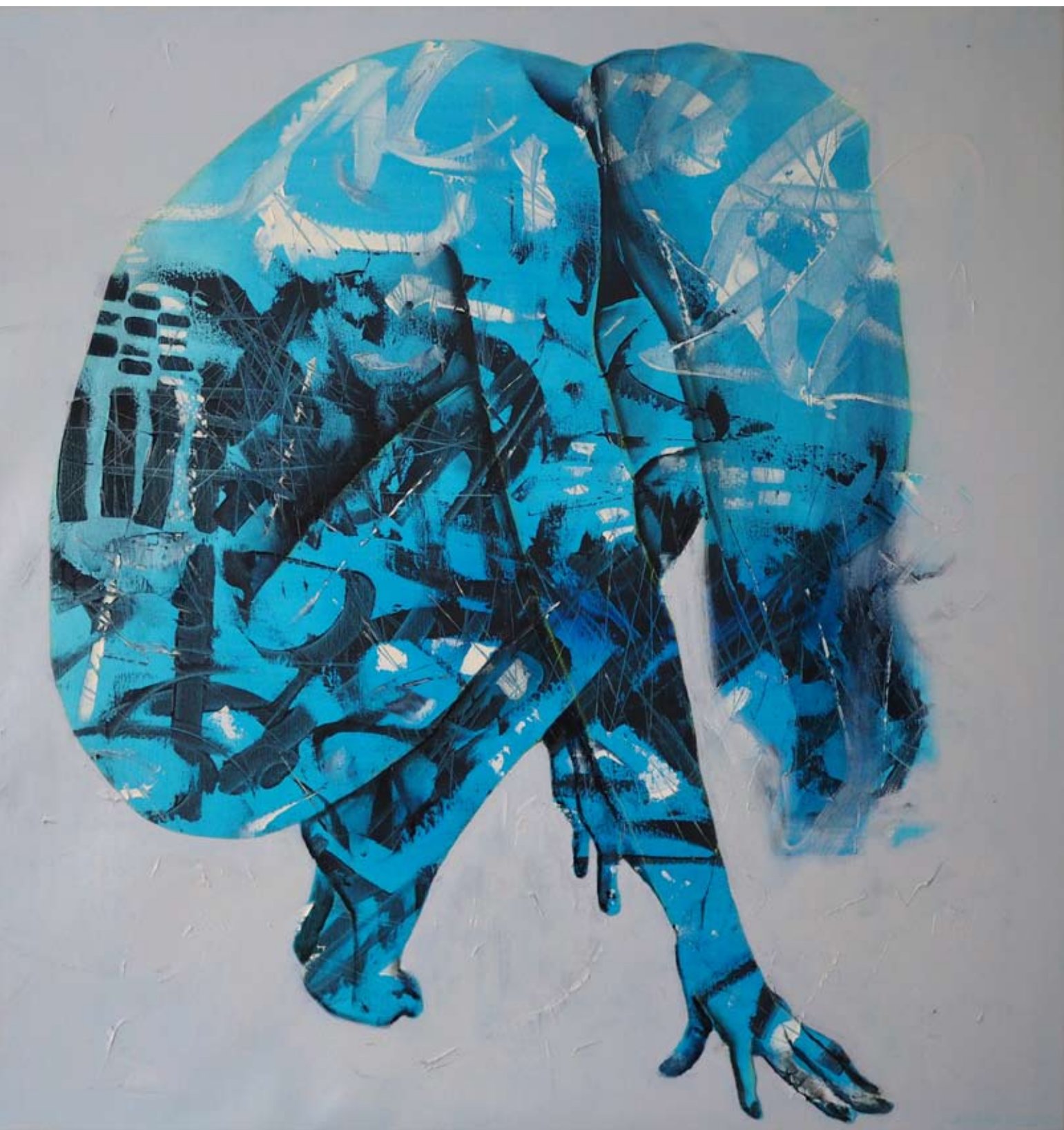
Kaja Solecka, „Uziemienie”, olej na płótnie 100x100 cm