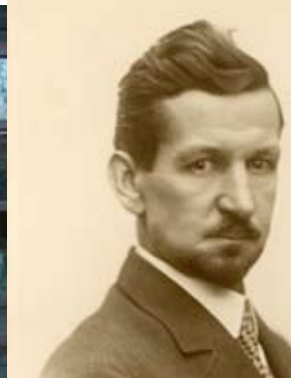
"Orkanówka", tablica pamiątkowa na budynku oraz Władysław Orkan

W hotelu „Górski Raj” w Koninkach zorganizowaliśmy Konferencję naukową pt. Władysław Orkan. Piewca Gorców i Podhala . Przygotowali tę imprezę Niepubliczny Instytut Kształcenia Nauczycieli Wydawnictwa Edukacyjnego, przy współpracy Katedry Mediów i Badań Kulturowych UP im. KEN w Krakowie.