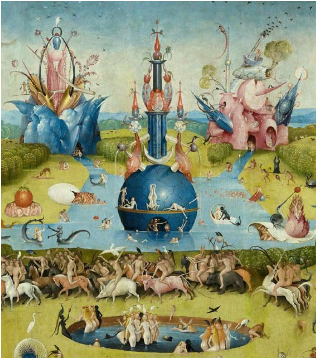
Ogród rozkoszy ziemskich

w kontyngencji. Odrzucenie jej założeń skutkuje natomiast nagromadzeniem błędnych przekonań, tautologii, wszelkiego rodzaju ideologii, które posługując się wspomnianą dezinformacją, relatywizowaniem sensów i zwykłym kłamstwem – zamykają nas w skostniałym, zamkniętym, pełnym cierpienia świecie.