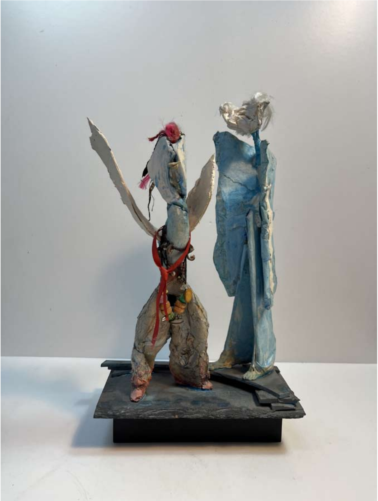
Wojciech A. Sobczynski, Old man and Odalisque