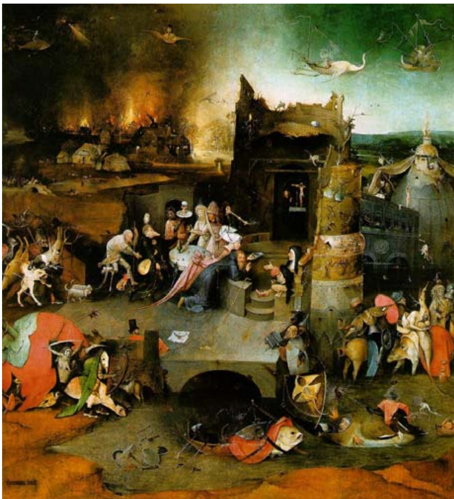
Tryptyk Lizboński - Kuszenie św. Antoniego

obowiązywania praw natury. Na gruncie tej zasady można wyobrazić sobie dowolną liczbę możliwych światów, w których przedmioty mogą się zacząć zachowywać w sposób dowolny nawet kapryśny i nieprzewidywalny. Choć racja tego, że i jak cokolwiek istnieje, jest niedostępna naszemu rozumowi (istnienie jest bez racji) pozostając dla nas zagadkowa, to jednak w tej zagadkowości kryje się jego zdaniem nadzieja, a także schronienie przed chaosem. U podstawy tej zagadkowości leży bowiem zabsolutyzowana kontyngencja (konieczność niekonieczności), która otwiera przed nami obszar nieskończonych możliwości, mówiąc nam, że jeżeli wszystko jest możliwe, to możliwa jest również rzeczywistość, w której nie istnieje zło 4 .