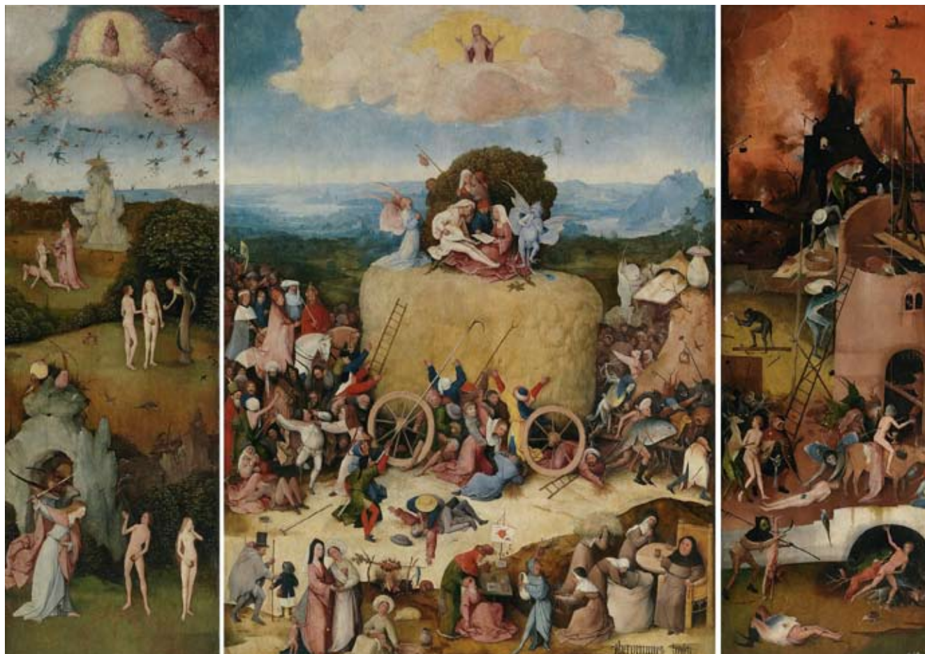
Wóz z sianem

lękami, traumą, nerwicami czy psychozami – swoistymi rodzajami indywidualnych piekieł psychicznych. Oczywiście ich źródłem są nie tylko religijne zakazy, ale również w obu przypadkach szeroko pojęta przemoc - z jednej strony fizyczna, z drugiej emocjonalna. Przejawiający się w historii wachlarz tych cierpień zdawał się wymagać pewnego uniwersalnego odniesienia – miejsca, w którym wszelkie lęki, ból i cierpienie skupiały się niczym w soczewce. Miejscem takim było oczywiście piekło wraz z całym spektrum występujących w nim rekwizytów oraz aktorów. Tychże nie brakuje na obrazach Boscha. Musimy jednak zauważyć, że choć mówimy tutaj o naszej reakcji na źródła zбору fenomenów rozumianych jako zło, to ono samo na poziomie koncepcyjnym ujmowane zostaje nie bezpośrednio, lecz poprzez symbole i pojęcia 1 .