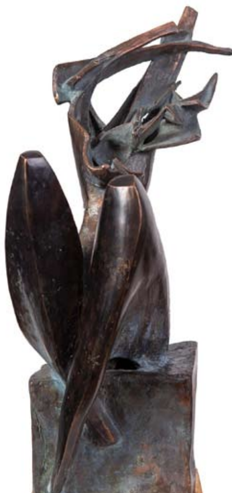
Krystyna Nowakowska, Estymacje