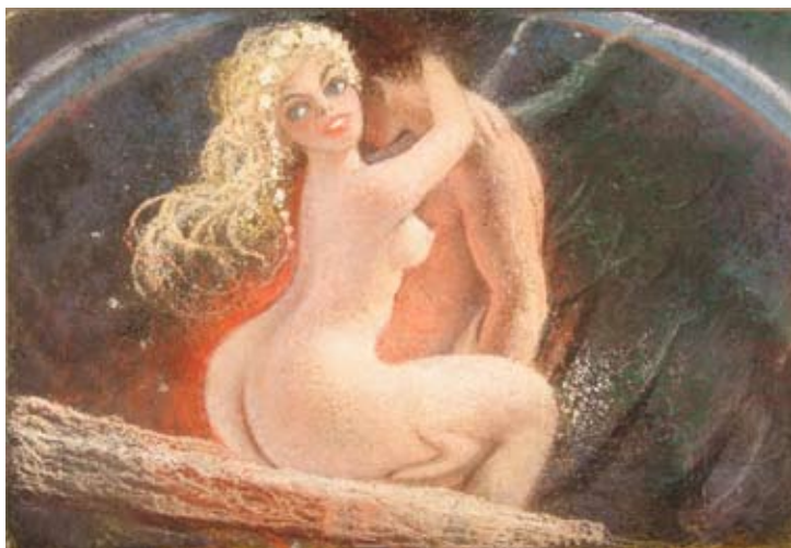
Jacques-Louis David, Eros i Psyche

funkcję, motywację, wpływ oraz komentarz społeczny. Artykuł zmierza do wykazania, że seks w literaturze nie jest jedynie formą estetycznego dodatku czy kontrowersji – ale istotnym narzędziem artystycznym i poznawczym, pozwalającym eksplorować najgłębsze warstwy ludzkiego doświadczenia.