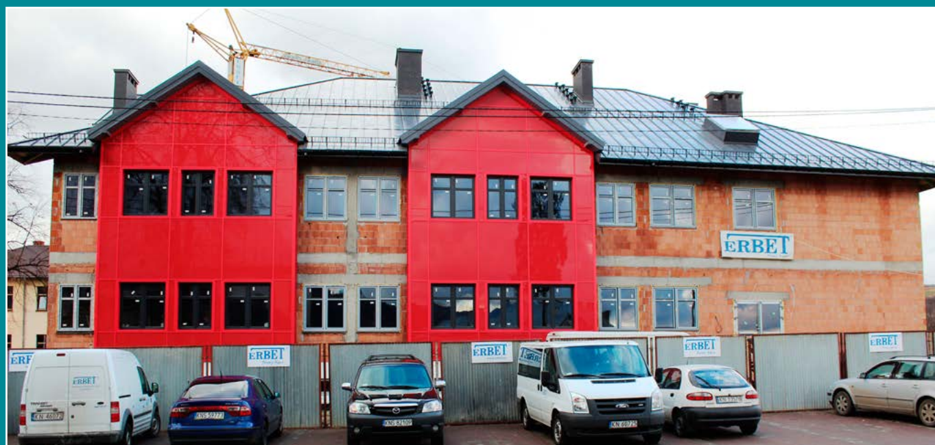
Rozbudowa Zespołu Szkolno-Gimnazjalnego w Łącku.