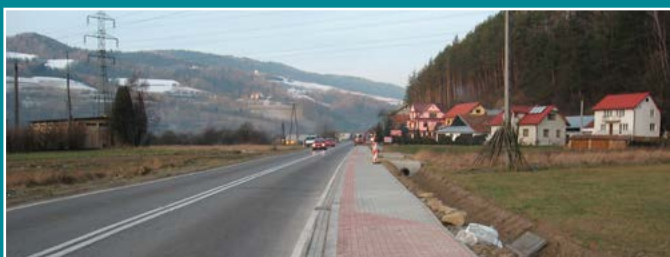
Chodnik w Zabrzeży.