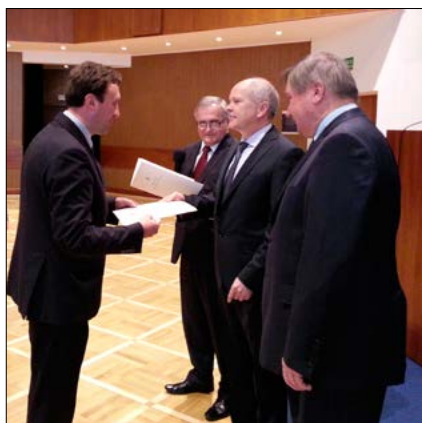
Wójt Gminy Łącko odbiera promesę na budowę mostu w Kadczy.

do zwiększenia promesy przez Ministerstwo Administracji i Cyfryzacji do 10 960 tys. złotych.