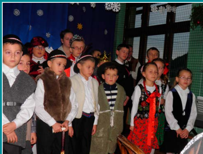
Jasełka w SP w Kiczni.