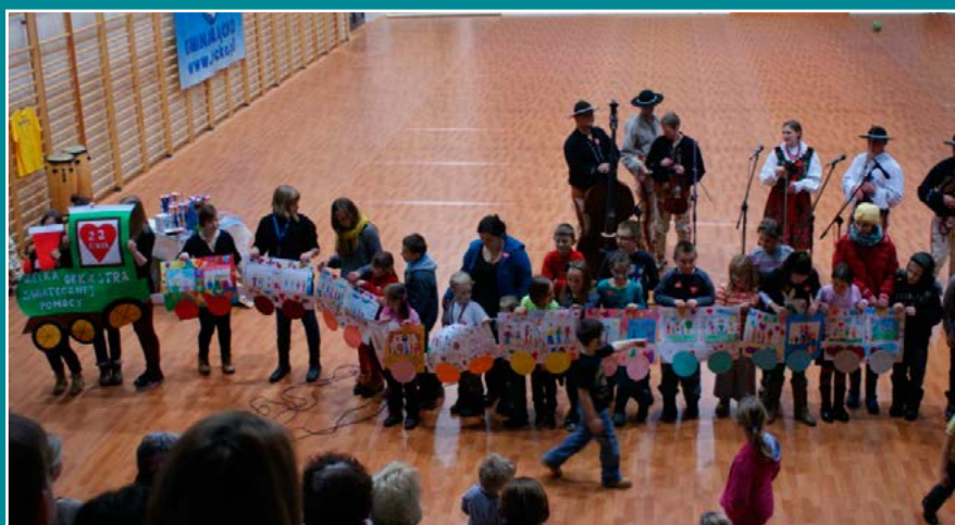
Finał WOŚP w Łącku.