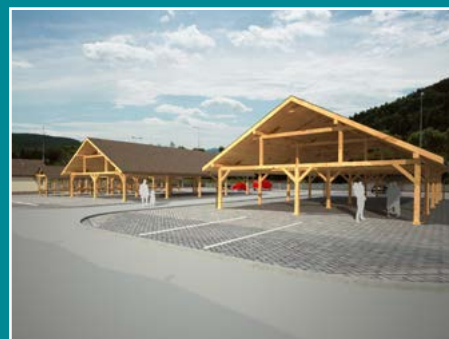
Wizualizacja przebudowy placu targowego w Łącku.