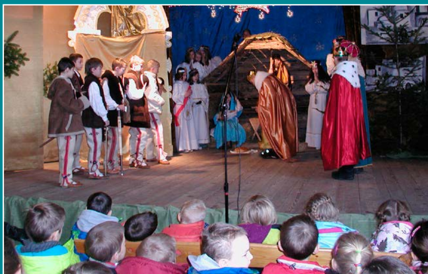
„Na góralską nutę” – Jasełka SP w Łącku.