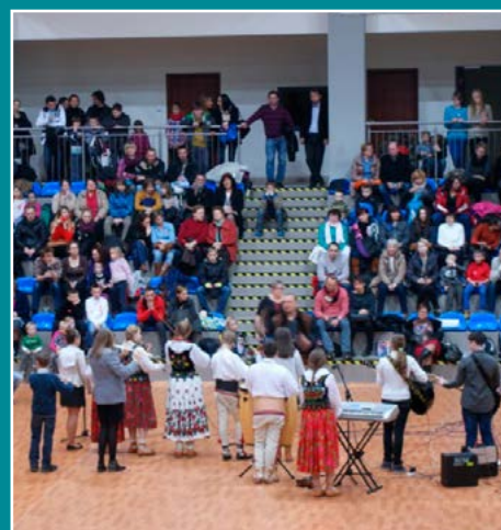
Finał WOŚP w Łącku.