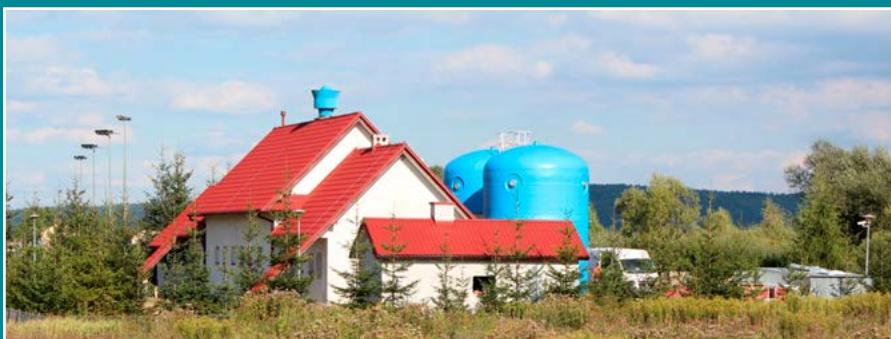
Rozbudowa oczyszczalni ścieków w Jazowsku.