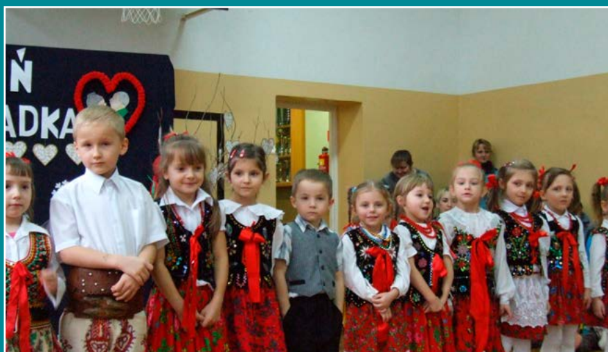
Dzień Babci i Dziadka w SP w Obidzy.