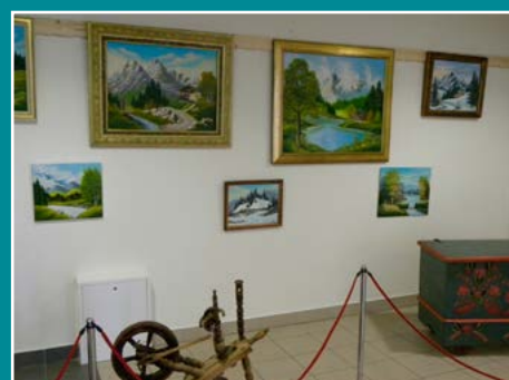
Fragment wystawy Jadwigi Ząbek z Łącka.