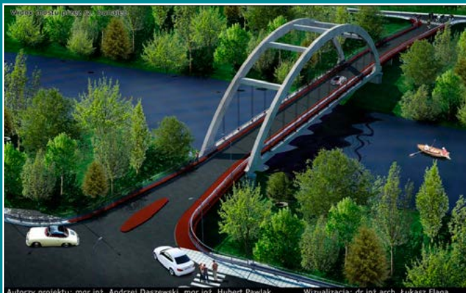
Wizualizacja mostu w Kadczy.