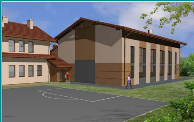
Wizualizacja sali gimnastycznej w Zabrzeży.