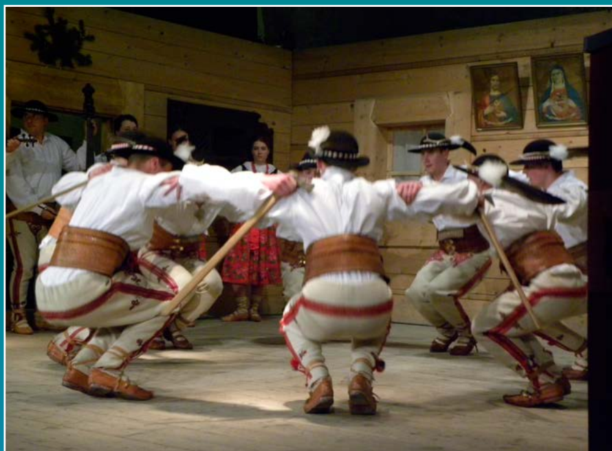
Zbójnicki w wykonaniu Górali Łąckich w trakcie Góralskiego Karnawału w Bukowinie Tatrzańskiej.