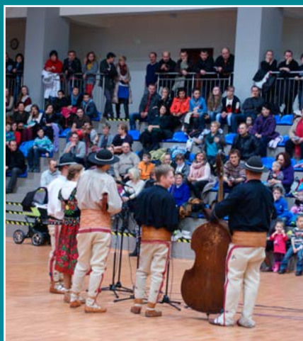
Finał WOŚP w Łącku.