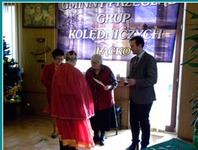
Gminny Przegląd Grup Kołędniczych.