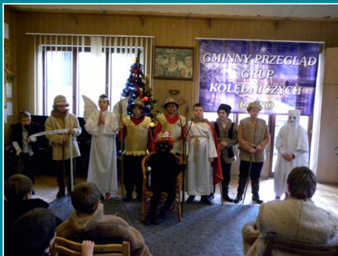
Gminny Przegląd Grup Kołędniczych.