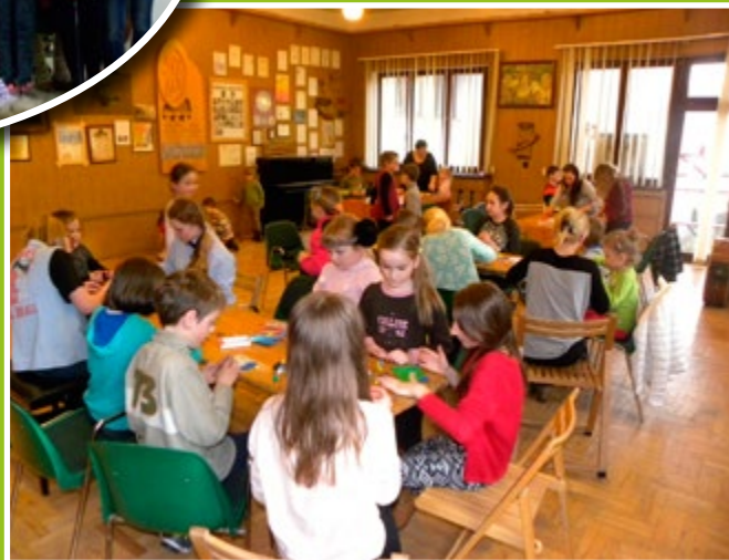
Ferie z GOKiem