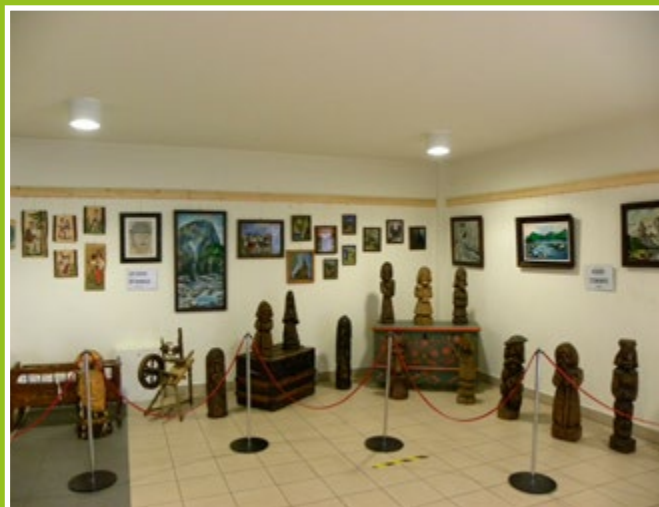
Wystawa prac Józefa Tokarza /rzeźba/ z Jazowska i Leszka Stanisza /malarstwo/ z Zabrzeży hala widowiskowo-sportowa w Łącku