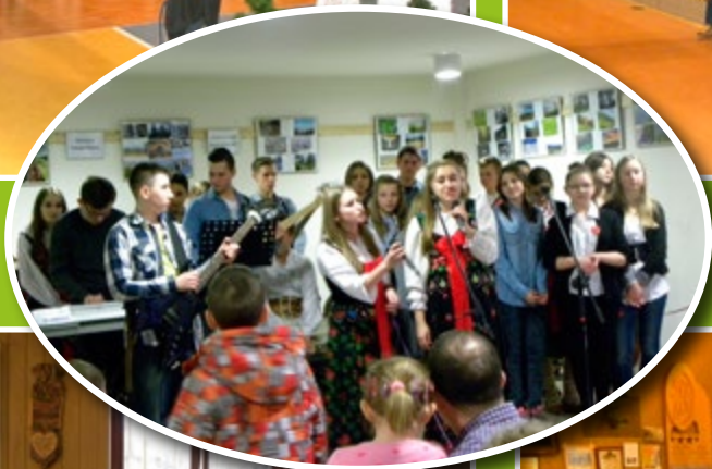
23. Finał WOŚP w Łącku