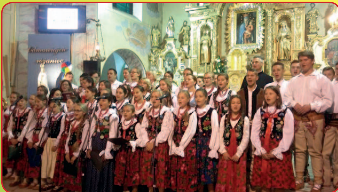
XVI Dzień Papieski „Bądźcie świadkami Miłosierdzia”