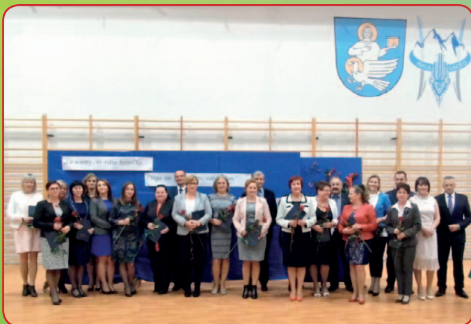
Dzień Edukacji Narodowej w Łącku