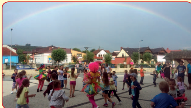
Festyn Rodzinny na łąckim Rynku