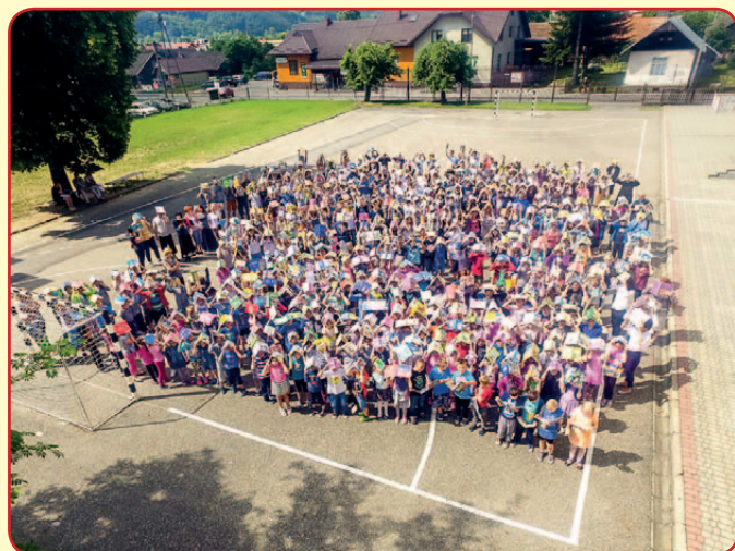
Jak nie czytam jak czytam – w ZSG w Łącko