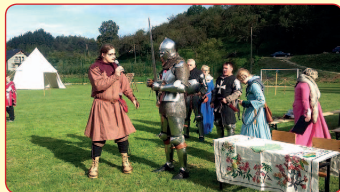
Piknik średniowieczny w Maszkowicach