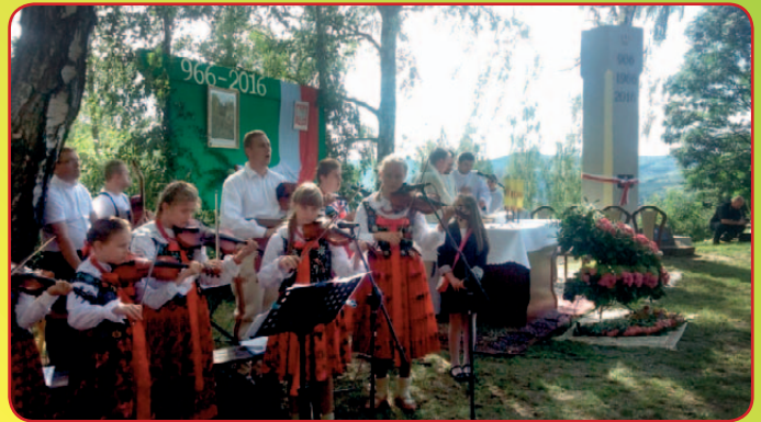
Obchody 1050. rocznicy Chrztu Polski