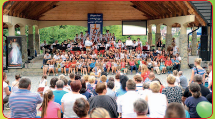
Świątowe Dni Młodzieży w Łącku