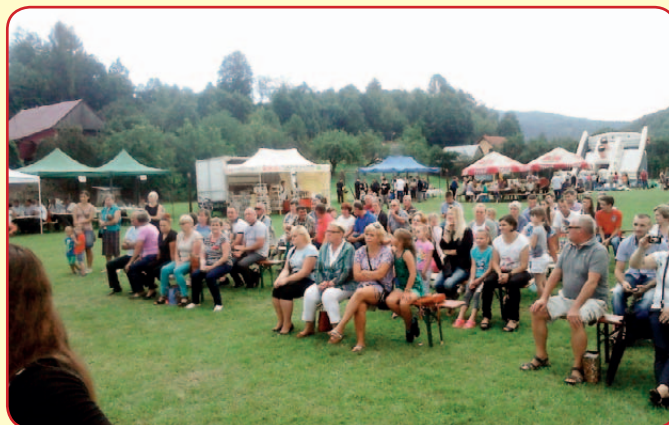
Otwarcie nowej drogi i festyn w Zarzeczcu