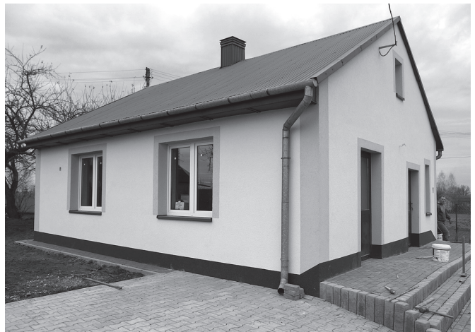
Budynek wiejski w Zagaju.

Trzecim blokiem zadań, które też udało się zrealizować był remont budynków wiejskich i zagospodarowanie terenu wokół nich. Dotyczyło to Siedlisk, Malkowic, Jankowic, częściowo Książnic Małych. W ostatnich dniach kończone jest podobne zadanie przy świetlicy w Zagaju.