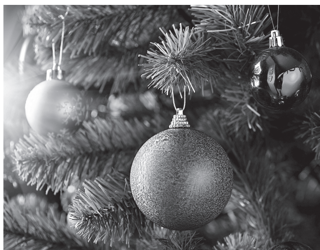
Bombki choinkowe.

W dzieciństwie wiedziałam, że nie bombki są najważniejsze, ale lampki, orzechy i jabłka. Mieliśmy w ogrodzie specjalnie w tym celu posadzoną jabłonkę o małych czerwonych owocach.