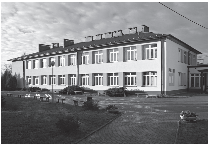
Budynek Centrum Oświatowego w Koszycach po termomodernizacji.