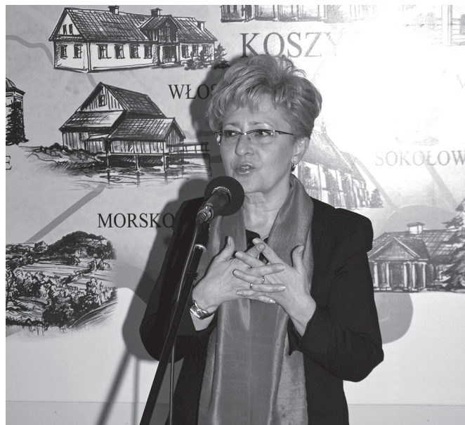
Pani Elżbieta Radziszewska – wicemarszałek Sejmu RP podczas otwarcia Szkoły Muzycznej w Koszycach.

Szóstą, bardzo ważną sprawą, było otwarcie nowej placówki samorządowej gminy – Szkoły Muzycznej I Stopnia w Koszycach. We wrześniu szkoła rozpoczęła działalność, uczy się w niej blisko 50 dzieci. Myślę, że przyszłość potwierdzi trafność tej inwestycji.