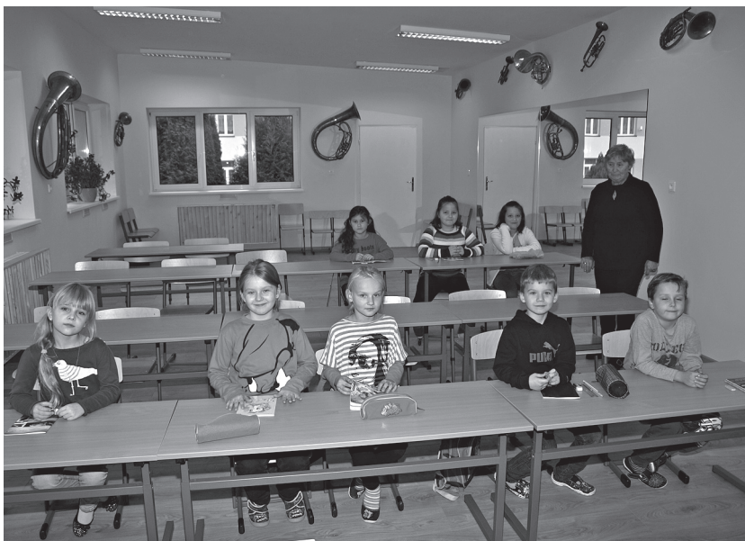
Zajęcia w Szkole Muzycznej w Koszycach.

Niezwłocznie po odbytych w dniu 16 listopada bieżącego roku wyborach przystąpiliśmy do intensywnych działań. 21 listopada odbyła się inauguracyjna sesja nowej rady gminy na której dokonano wszystkich niezbędnych formalności organizacyjnych, a więc wręczono zaświadczenia o wyborze dla radnych i dla wójta, odbyło się ślubowanie tych osób, odbył się wybór władz rady gminy a więc przewodniczącego i jego zastępcy, ustalono również składy osobowe komisji rady gminy. Na 15 i 17 grudnia zaplanowano odbycie posiedzeń wszystkich czterech komisji rady gminy a na 30 grudnia bieżącego roku ustalono termin roboczej