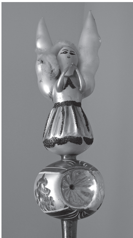
Szpic choinkowy.

Kto przynosi te prezenty? U nas może to być: Aniołek, Dzieciątko, Gwiazdka, Gwiazdor, św. Mikołaj, a nawet Dziadek Mróz (postać z obrzędowości rosyjskiej wmuszana nam w czasie PRL-u). W mojej rodzinie często przebie-