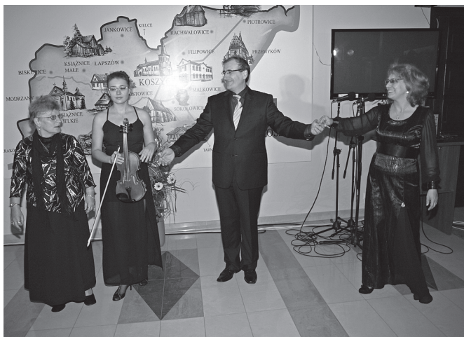
Koncert artystów Opery Krakowskiej.