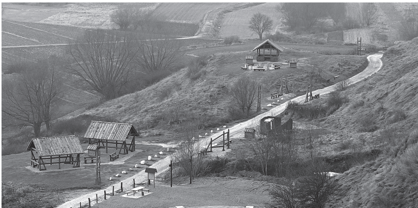
Fragmety ścieżki rekreacyjnej w Morsku.