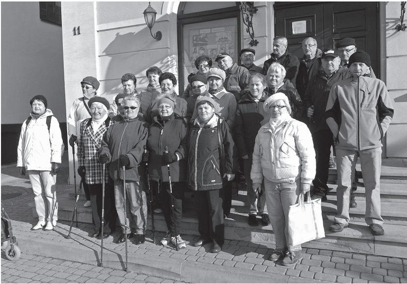
Zbiórka przed wycieczką