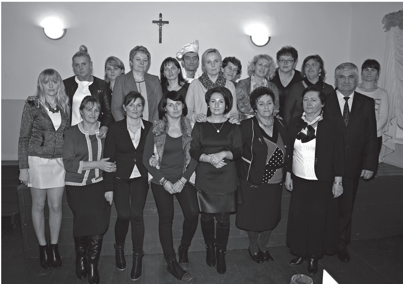
Uczestnicy uroczystego zakończenia warsztatów kulinarnych.