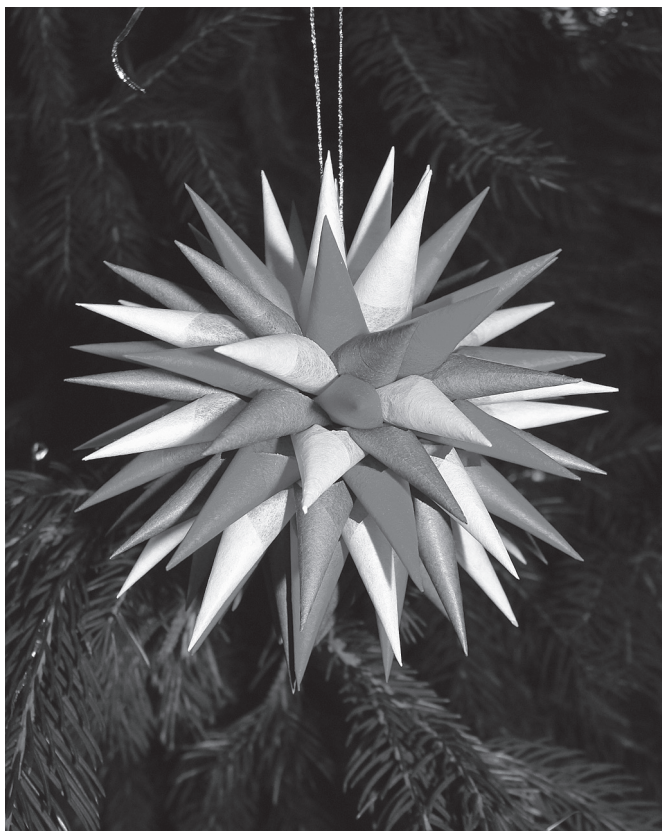
Tak wyglądają „światy”.

był stawiany przez gospodarza w kącie izby. Wyciągano z niego w czasie Wigilii źdźbła słomy i po ich wyglądzie (proste, krzywe, nadłamane itp.) wróżono przyszłość. Stał ten Diduch do Trzech Króli, a potem palono.