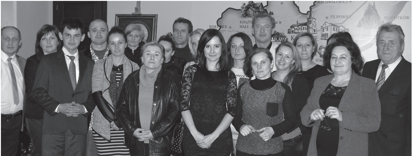
Uczestnicy projektu 2014

zaświadczenia o ukończeniu kursów oraz dyplomy ukończenia projektu. Celem spotkania było dokonanie ewaluacji przebiegu projektu z perspektywy uczestników, kierownictwa projektu a także władz samorządowych i społeczeństwa. W miłej i przedświątecznej atmosferze zakończyliśmy przedostatni etap projektu, wszyscy goście otrzymali gadzety promujące projekt.