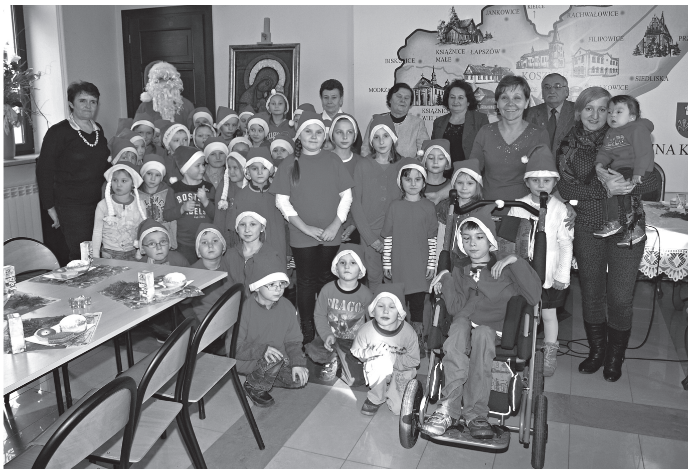
Dzieci z Mikołajem, gośćmi i opiekunami z TPD.