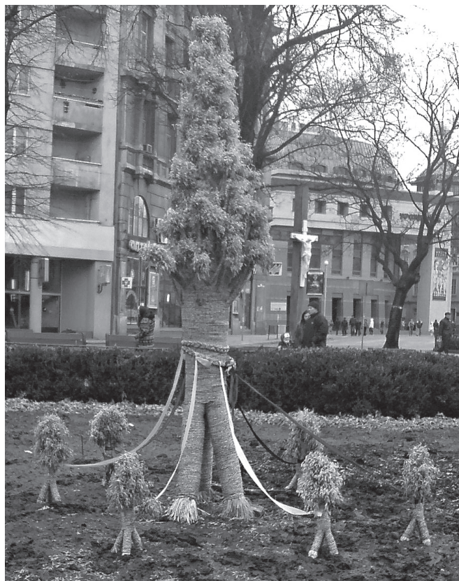
Współczesny Diduch ustawiony we Lwowie.

Dodać trzeba, że jeszcze w tradycji przedchrześcijańskiej drzewo symbolizowało siły żywotne natury.