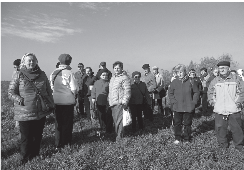
Na wzgórzu św Tekli