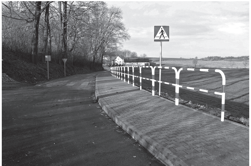
Zmodernizowany odcinek drogi w Rachwałowicach.

Po drugie, zmodernizowaliśmy wiele odcinków dróg w większości miejscowości naszej gminy, tu wymienię tylko przykładowo: Jankowice, Rachwałowice, Malkowice, Filipowice, Książnice Małe, Witów, Morsko, Zagaje, Modrzany, Dolany i Przemysłów.