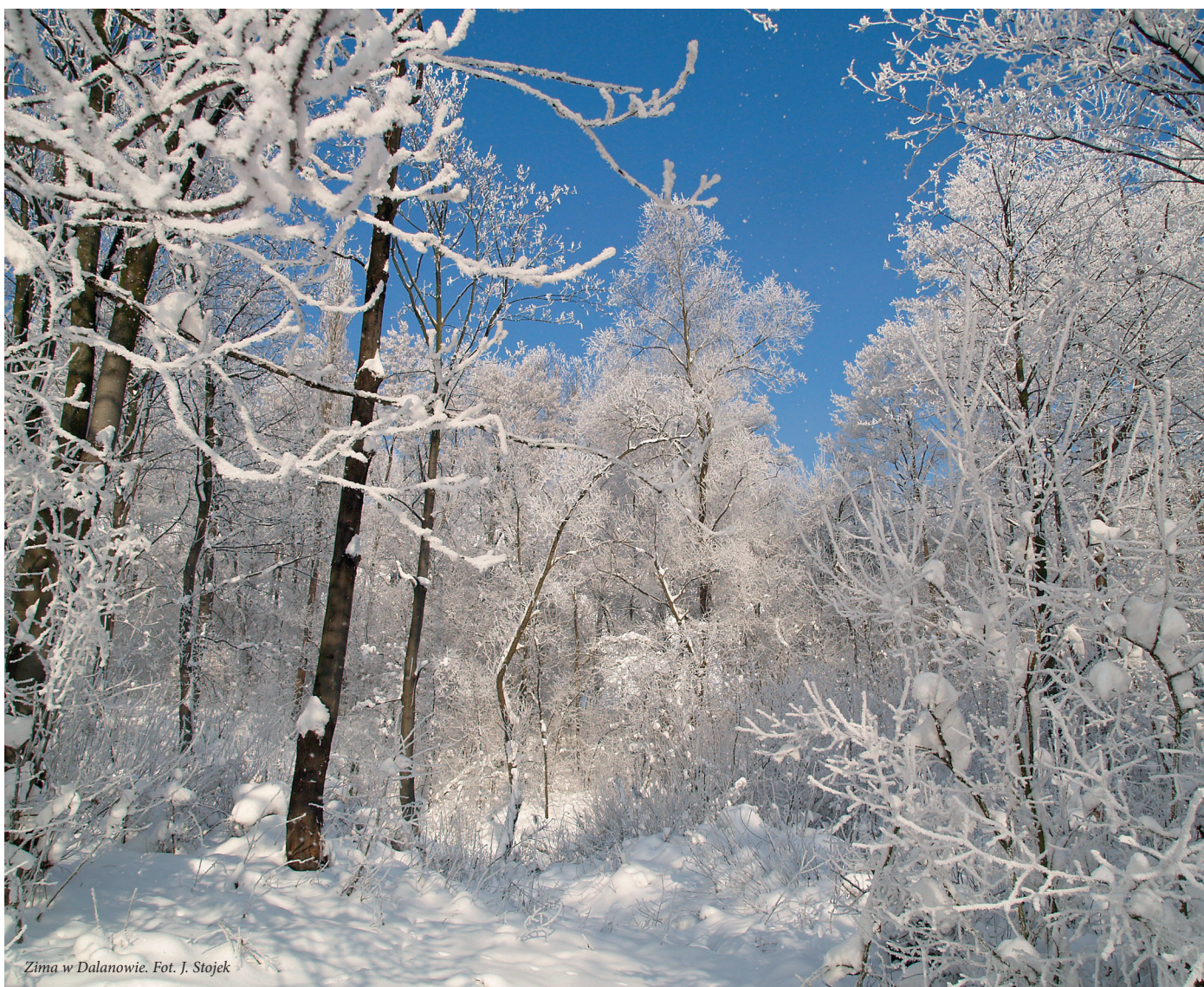
Zima w Dalanowie.

Pięknych i wesołych Świąt Bożego Narodzenia a w Nowym 2015 roku zdrowia i wszelkiej pomyślności Mieszkańcom Gminy oraz Czytelnikom życzą Wójt Gminy Koszyce i Redakcja Gazety Koszyckiej