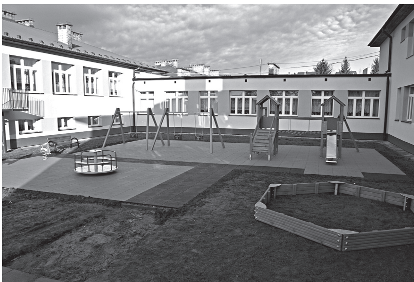
Nowy plac zabaw przy Centrum Oświatowym w Koszycach.