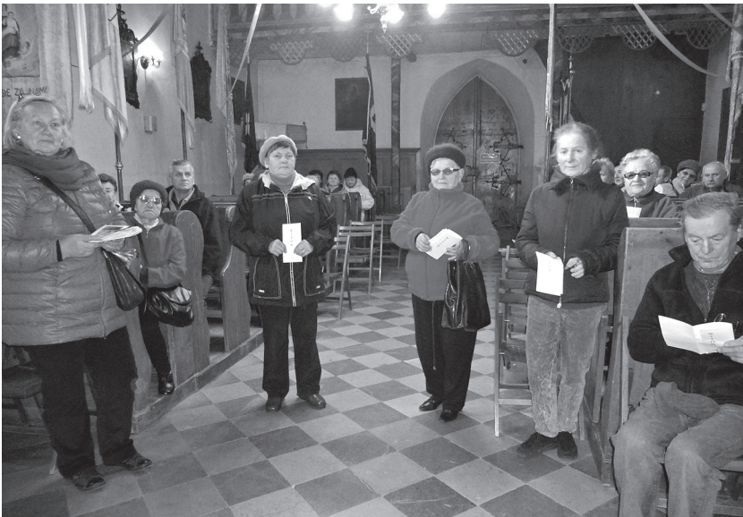
Zwiedzanie kościoła w Witowie