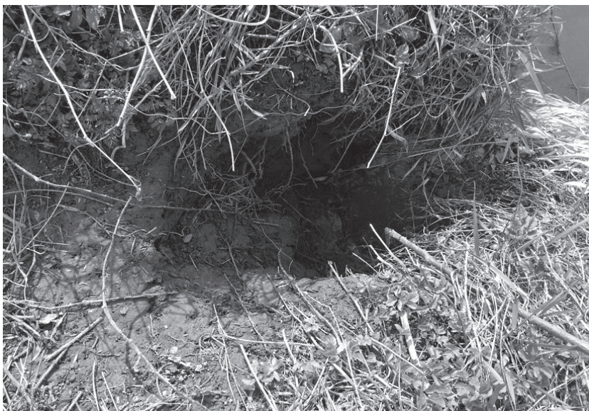
Wejście do nory bobrów na brzegu Szreniawy w pobliżu starego młyna.

Wydry żyją przede wszystkim przy zbiornikach i ciekach wodnych, lecz spotyka się je także z dala od wody. Zamieszkują opuszczone żeremia bobrów lub ich nory, a także dziuple i wykroty pod korzeniami powalonych drzew. Są terytorialne, samiec kontroluje na swoim terenie kilka samic. Swoje tereny znakują odchodami, ponadto używają stale tych samych miejsc, w których pozostawiają odchody (tzw. latryny wydr). Aktywność rozrodczą wykazują przez cały rok, jednak samica wydaje potomstwo zwykle co 2 lata. W jednym miocie może urodzić się 2–4 młodych, które pozostają z matką przez pierwszy rok życia. Żywią się głównie rybami jednak uzupełniają też dietę żabami, rakami