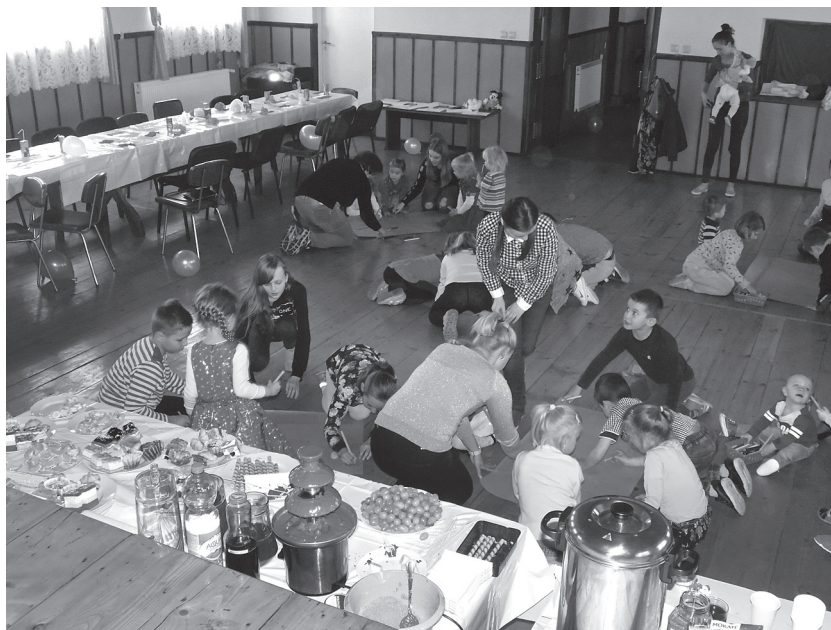
Warsztaty majowe w Rachwałowicach

Dziękujemy wszystkim osobom zaangażowanym w przygotowaniu Dnia Dziecka oraz wspinałym sponsorom.