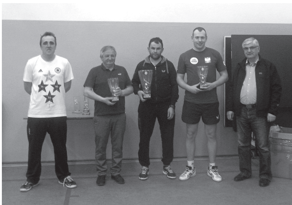
Zakończenie 4 edycji ligi tenisa stołowego