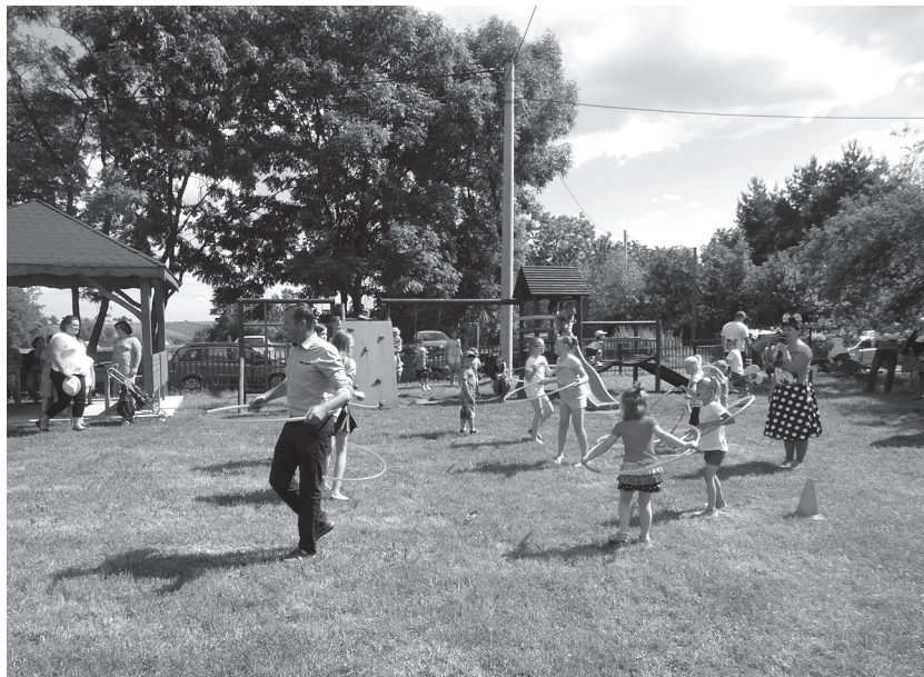
Dzień Dziecka w Rachwałowicach