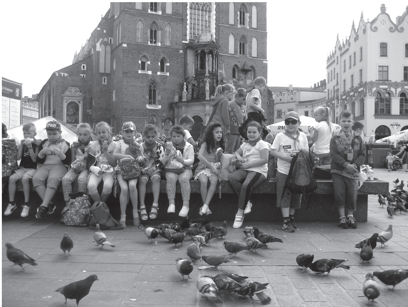
Odpoczynek na Krakowskim Rynku