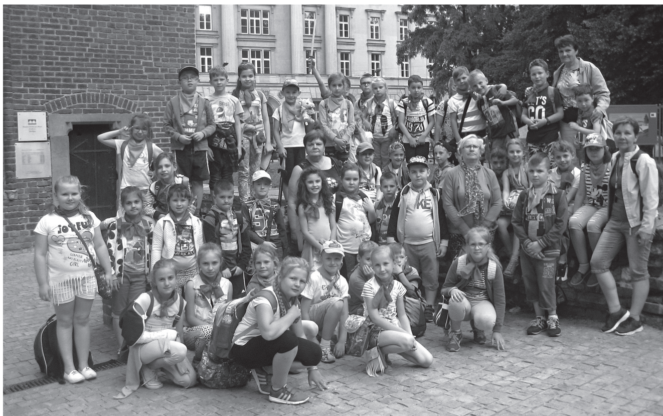
Uczestnicy wycieczki do Krakowa