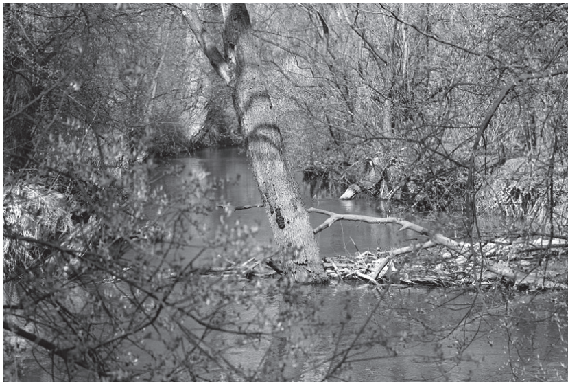
Tama bobrów (i śmieci naniesione przez wodę) na Szreniawie, w pobliżu stawów rybnych.

Zajac występuje na terenie całego kraju. Jego liczebność i rozmieszczenie jest różne, ale najwięcej osobników można spotkać w centralnej Polsce. Unika terenów podmokłych i wilgotnych. Zajac był pierwotnie gatunkiem stepowym, więc najbardziej odpowiadają mu tereny nizinne, głównie w urozmaiconym krajobrazie rolniczym. Zamieszkuje również lasy, wydmy nadmorskie, obszary rekultywowane, a nawet tereny miejskie. Zajace są terytorialne i żyją pojedynczo z wyjątkiem okresu parkotów (godów). Liczebność zajęcy w danym roku zależy przede wszystkim od pogody, jaka panowała podczas wykotów. Stałym czyn-