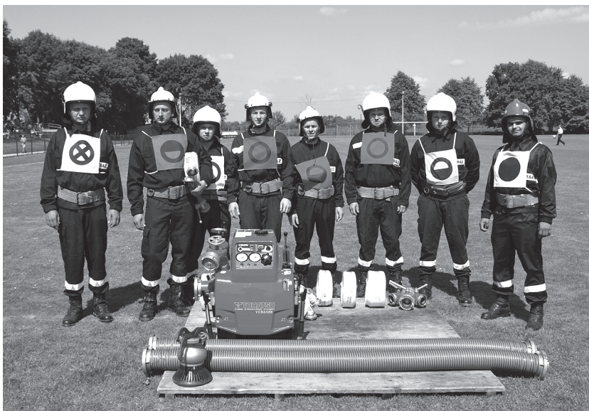
Drużyna OSP Książnice Wielkie przed ćwiczeniem bojowym

Zawody odbyły się na odnowionym przez gminę obiekcie sportowym – stadionie KS Szreniawa, na którym w ramach projektu: „Rozbudowa urządzeń terenowych stadionu sportowego „Szreniawa” w Koszycach” zrealizowano następujące prace: zamontowano nowe trybuny, postawiono kontener biurowy, odnowiono budynki, wymieniono sanitariaty w pomieszczeniach szatniowych, zamontowano piłkochwyty, ogrodzono boisko treningowe, wykonano nową bramę wjazdową, wykonano oświetlenie boiska.