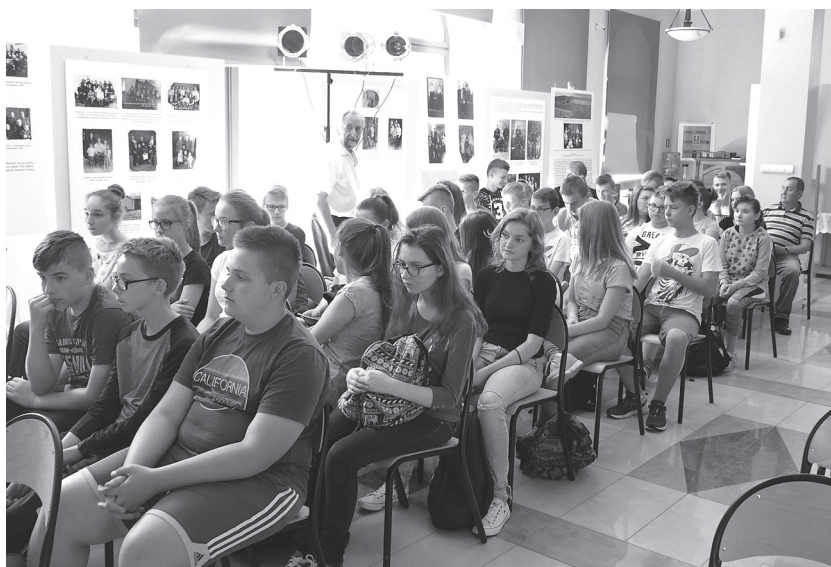
Uczestnicy spotkania – młodzież koszyckiego gimnazjum