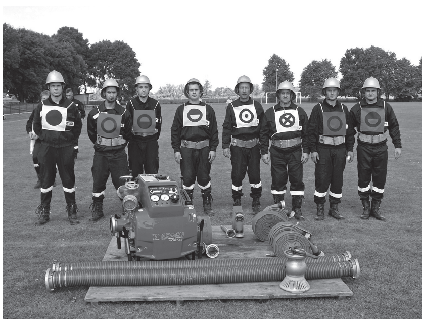
Drużyna OSP Łąpszów przed ćwiczeniem bojowym