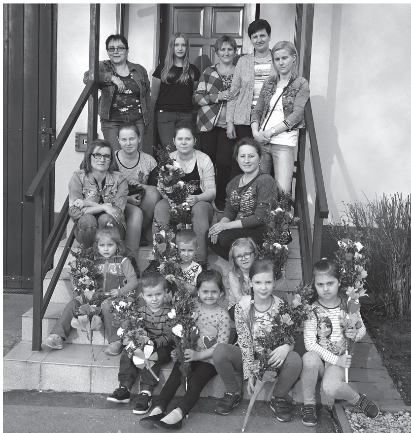
Palmy wielkanocne wykonane wspólnie z dziećmi