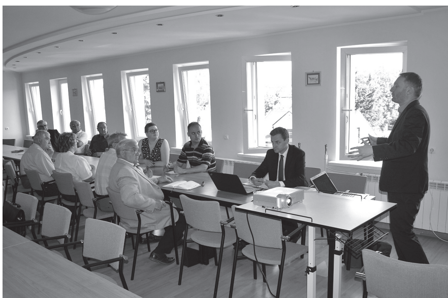
Warsztaty 9 czerwca 2017 r.