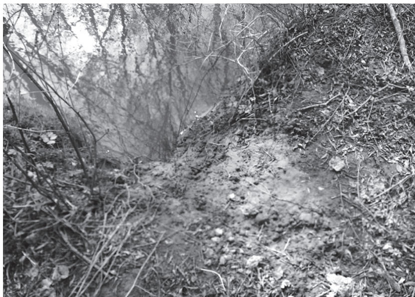
Ślizgawka (zejście wydr do wody) na brzegu Szreniawy.

Jest najpospolitszym drapieżnikiem w naszym kraju. Biotopem lisa są lasy, pola, łąki. Ulubionym jego siedliskiem są małe lasy śródpolne. W dużych kompleksach trzyma się raczej na obrzeżach lub w enklawach śródleśnych. Są nosicielami chorób zakaźnych i pasożytów.