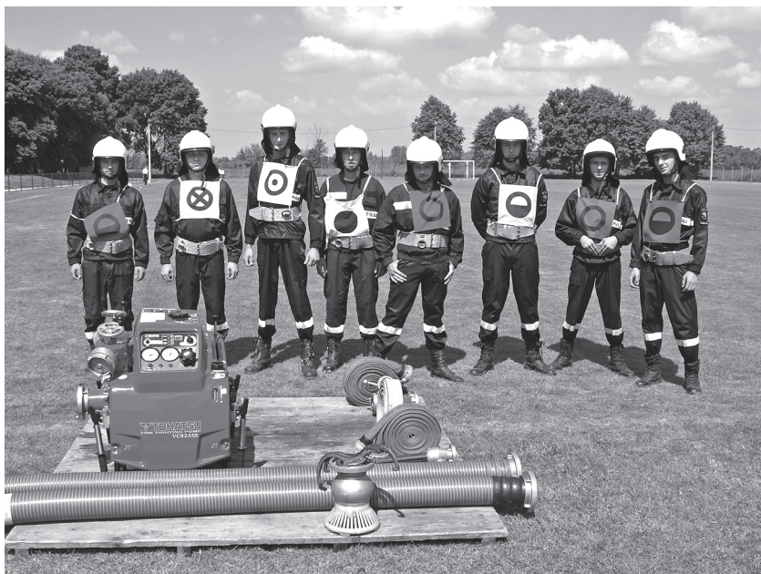
Drużyna OSP Przemyków przed ćwiczeniem bojowym