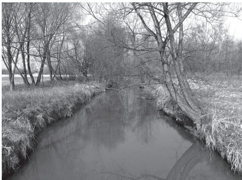
Siedlisko bobrów na rzece Szreniawa w pobliżu starego młyna.

Bobry są silnie terytorialne. Wielkość terytoriów zależy od ich zasobności w pokarm i przeważnie osiąga od 1–4 km długości ciek. Żyją do 30 lat, ale okres ich intensywnego rozrodu przypada między 5 a 10 rokiem życia. Roczny przyrost populacji w naszych warunkach po uwzględnieniu ubytków wynosi od kilku do kilkunastu procent, w zależności od regionu kraju, zagęszczenia i struktury wiekowej populacji, warunków wodnych środowiska, dostępności pokarmu oraz liczby miejsc możliwych do kolonizacji. Bóbr wywiera znaczny wpływ na ekosystemy wodne i błotne. Jego wpływ na środowisko sięga znacznie dalej niż wyznaczają to jego wymagania, co do przestrzeni życiowej i zapotrzebowań pokarmowych. Zmiany, jakich dokonują na środowisku zależą od zagęszczenia i dynamiki populacji oraz czasu przebywania bobrów w terenie. Przekształcając jego układ hydrologiczny, zwiększają bioróżnorodność, inicjują naturalne procesy bagienne a nawet wpływają na zmianę krajobrazu. W okolicy stawów bobrowych podwyższa się i stabilizuje poziom wody gruntowej, zmniejsza się erozja oraz zwiększa osadzanie cząstek mineralnych i organicznych. Inicjowane są naturalne procesy bagienne i wpływa korzystnie na