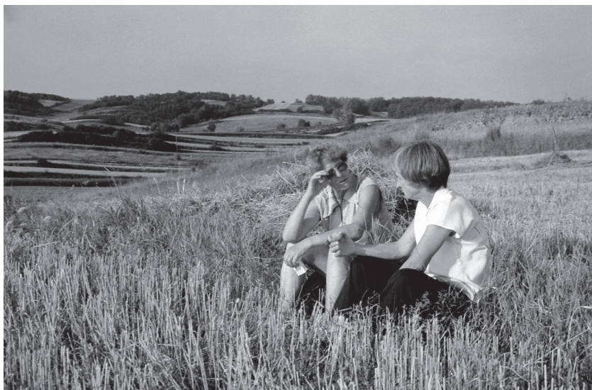
Piękno krajobrazu nad Koszycami

mrówek i wielu innych. Wszystkie te zwierzęta są ważnymi ogniwami w łańcuchu pokarmowym, zachowując jego ciągłość i równowagę.