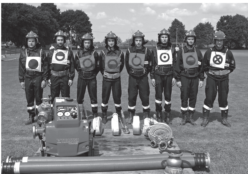
RS Drużyna OSP Koszyce przed ćwiczeniem bojowym