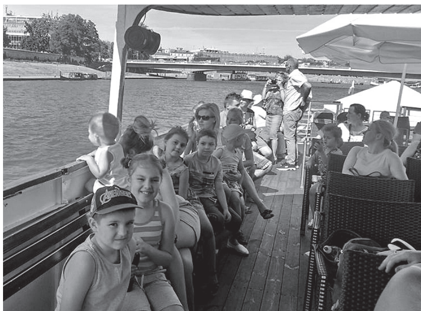
Rejs statkiem po Wiśle w Krakowie