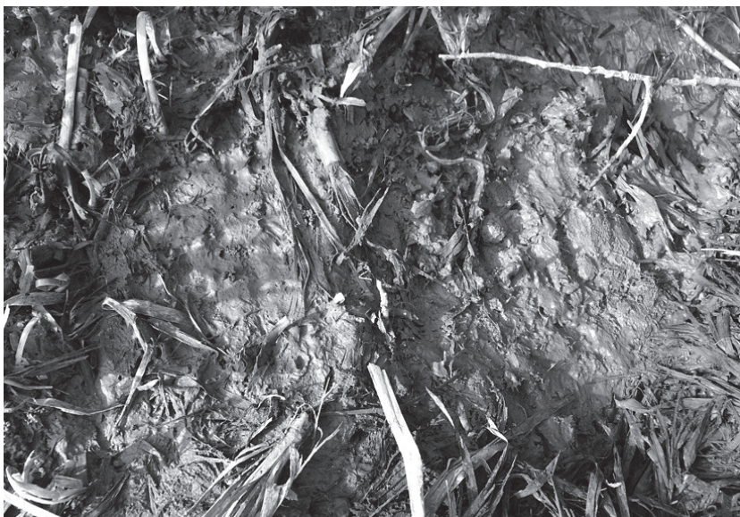
Tropy bobrów na brzegu Szreniawy.