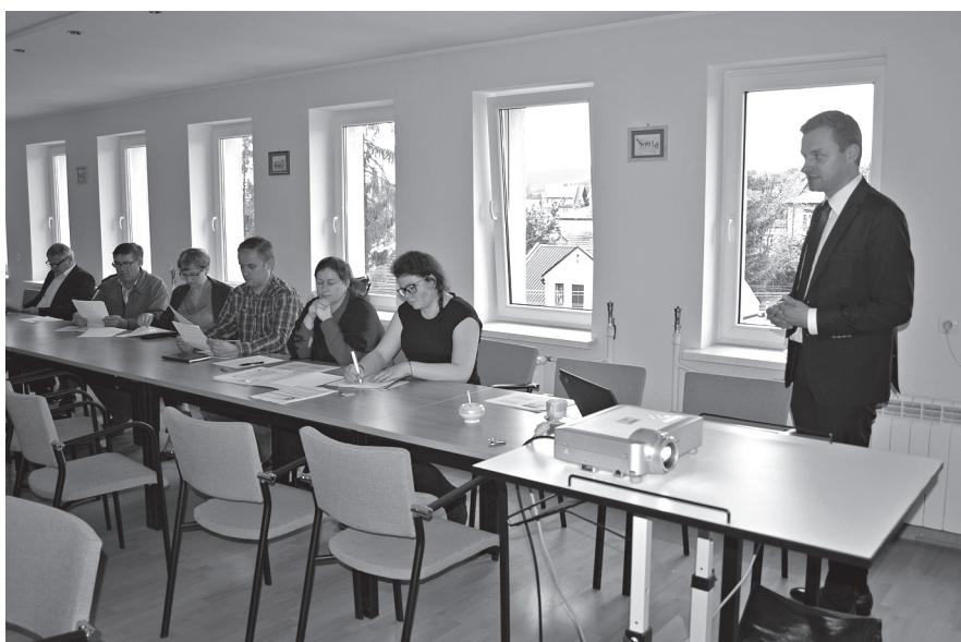
Spotkanie informacyjne w ramach konsultacji społecznych 16 maja 2017 r.