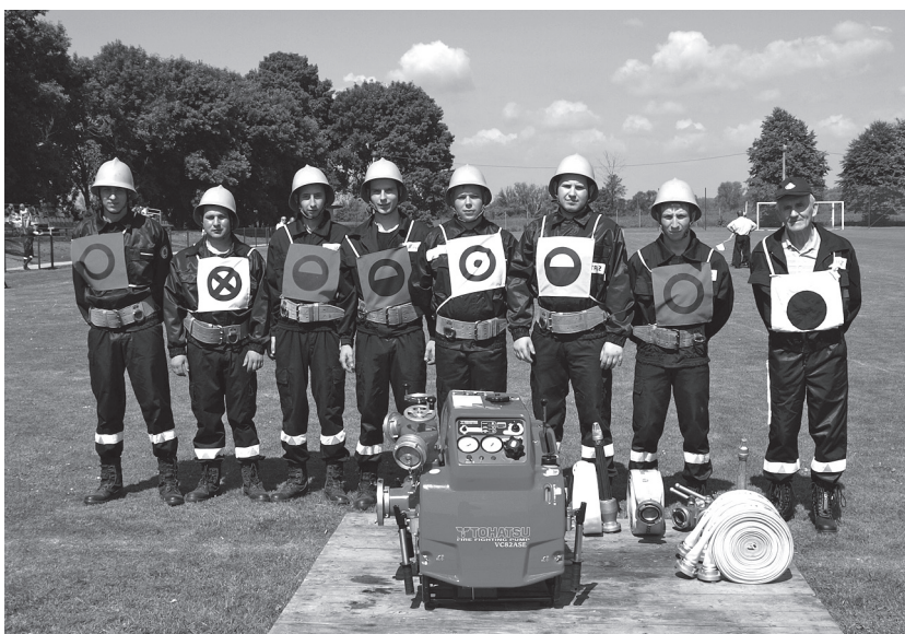
Drużyna OSP Rachwałowice przed ćwiczeniem bojowym