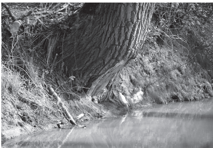
Pień drzewa podgryziony przez bobry na brzegu Szreniawy.

i małżami. Im mniejszy zbiornik wodny i jego zasobność w ryby tym większy jest udział płazów w diecie wydr. W małych ciekach wodnych i stawach żaba trawna może stanowić nawet 100% diety. Zdobyty pokarm spożywają zwykle w wybranych, zawsze tych samych miejscach. Dlatego łatwo jest stwierdzić występowanie osobników tego gatunku na danym terenie.