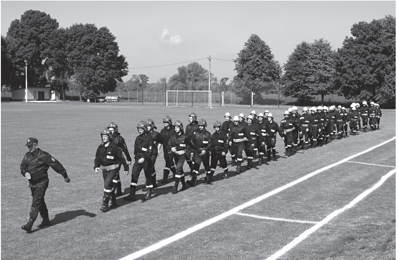
Przemarsz jednostek OSP

9 lipca 2017 r. na stadionie KS Szreniawa w Koszycach odbyły się Gminne Zawody Sportowo-Pożarnicze. W zawodach wzięły udział: OSP Koszyce, OSP Książnice Wielkie, OSP Łąpszów, OSP Przemyków, OSP Rachwałowice. Strażacy rywalizowali w sztafecie pożarniczej 7 × 50 m z przeszkodami, oraz ćwiczeniu bojowym. Dodatkową konkurencją była musztra.