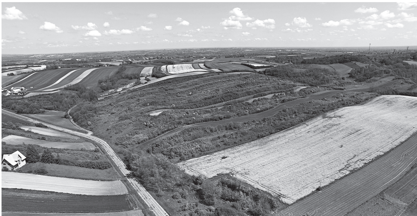
Geometryczne pola rzepaku

kie warunki jakości. Ale na pewno wybiórczo, a my w najlepszej wierze pijemy owe napary i ekstrakty.