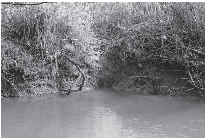
Ślizgawka z tropami wydry na brzegu Szreniawy.