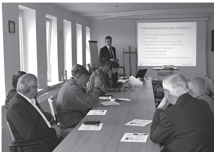
Spotkanie informacyjne w ramach konsultacji społecznych 16 maja 2017 r.

W urzędzie gminy jak i na stronie internetowej w zakładce „Gminny Program Rewitalizacji” przez cały czas konsultacji dostępne były Ankiety,