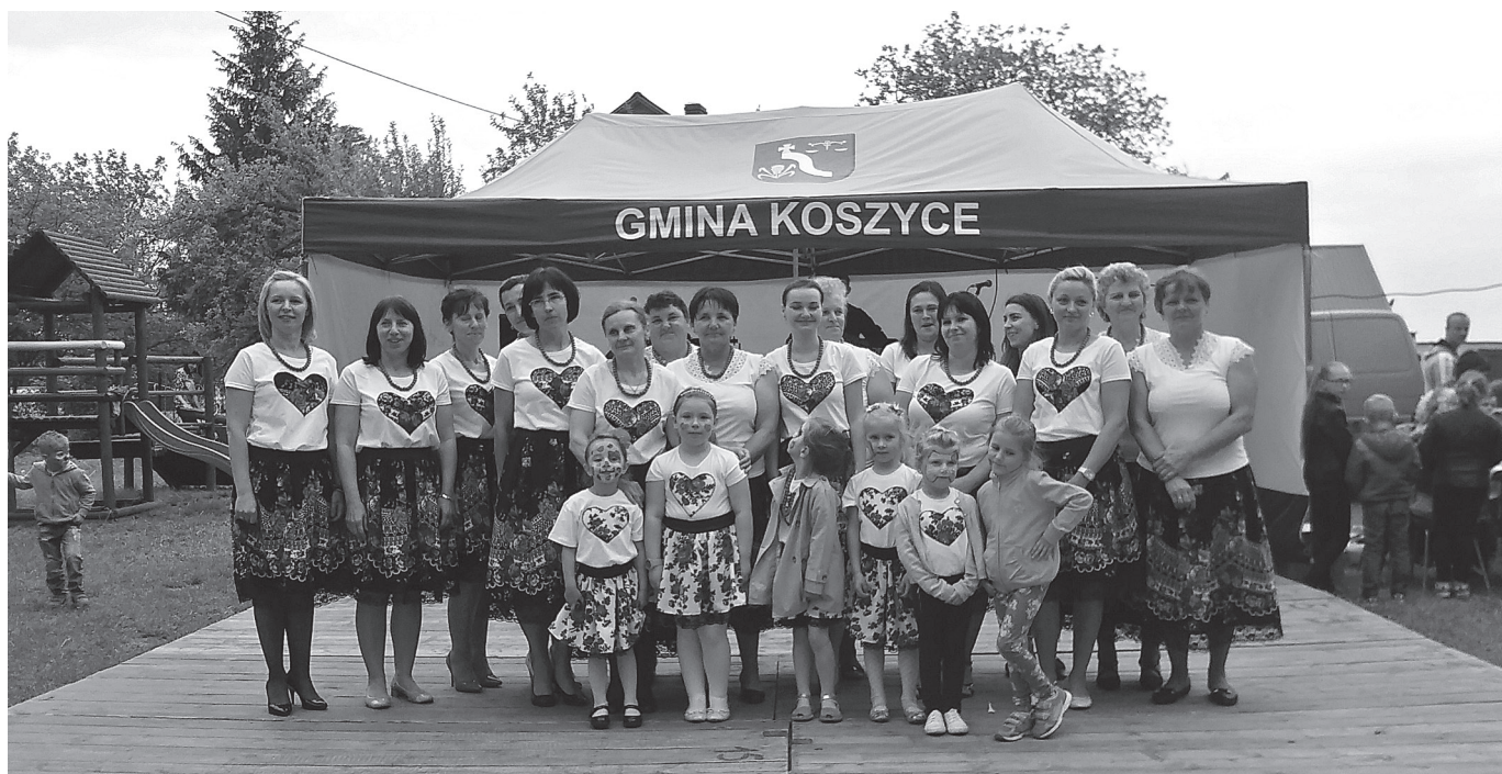
Stowarzyszenie w zakupionych strojach ludowych