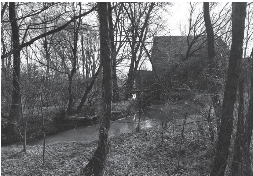
Siedlisko bobrów przy starym młynie.