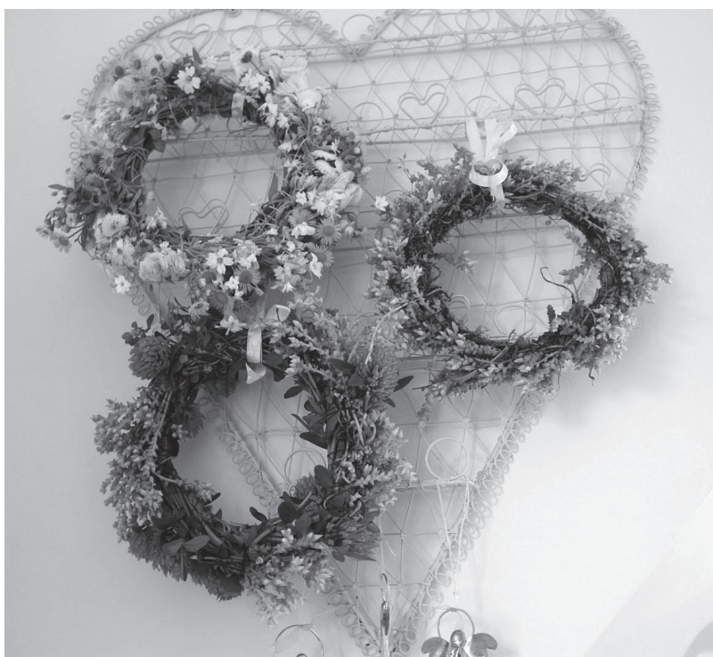
Wianuszki na oktawę Bożego Ciała

Czy wobec tego jest możliwe, aby wartość ziół uprawianych na dużych obszarach, w glebie może częściowo, ale na pewno niewystarczająco dostosowanej do wymogów danego zioła, mogła dorównać wartości ziołom rosnącym naturalnie, w miejscach najlepszych dla danego gatunku pod względem podłoża, jego składu chemicznego, nawodnienia, nasłonecznienia? A właśnie ta