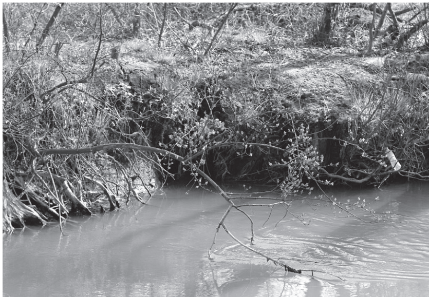
Wejście do nory bobrów na brzegu Szreniawy.