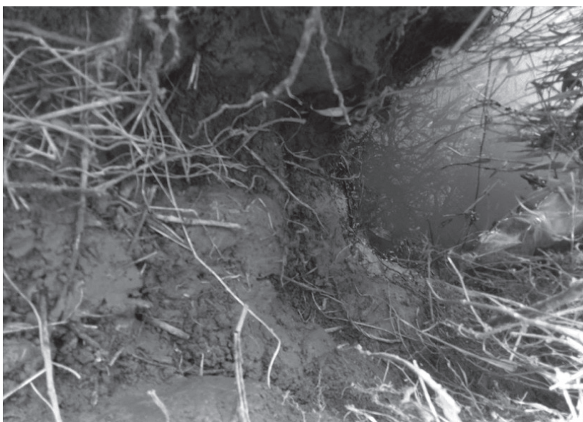
Ślizgawka (zejście wydr do wody) na brzegu Szreniawy.