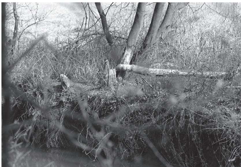
Drzewa zgryzione przez bobry nad Szreniawą.