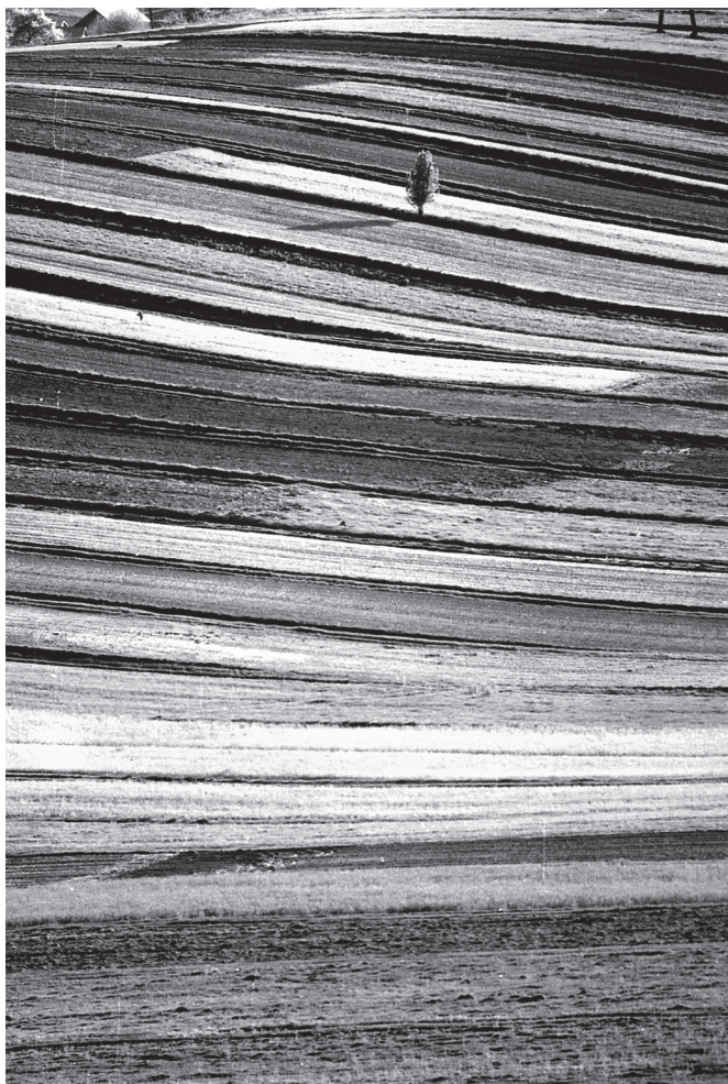
Samotne drzewo na miedzy

mnem”), występujący w filmach (np. „Sami swoi” Sylwestra Chęcińskiego”).