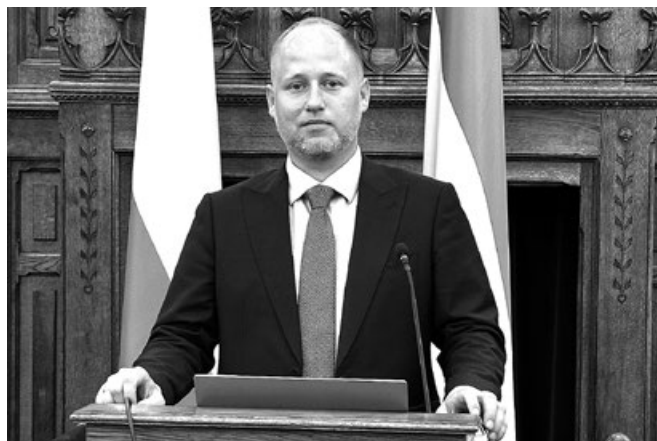
Burmistrz Miasta i Gminy Koszyce podczas prezentacji efektów naszej dotychczasowej współpracy międzynarodowej