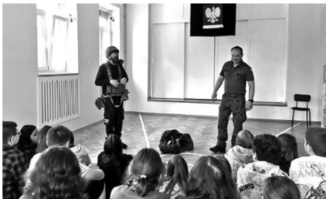
Szkolenie dla uczniów z klas VI-VIII