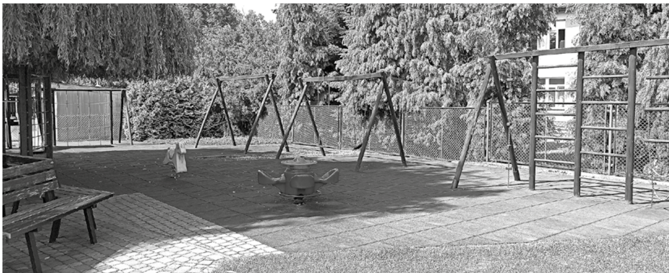
Plac zabaw w Koszycach objęty modernizacją