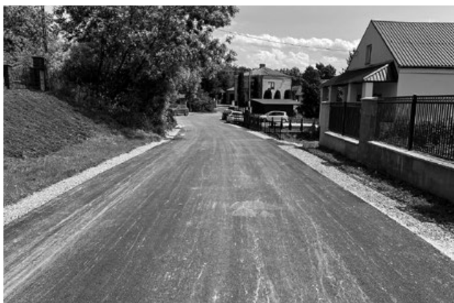
Droga gminna - Sokołowice Stara Wieś

działce nr 25 o dl 302 mb”. Projekt współfinansowany jest ze środków Województwa Małopolskiego. Gmina na realizację w/w zadania otrzymała dotację w kwocie 289 997,00 zł. Koszt zadania będzie znany po rozstrzygnięciu postępowania o udzielenie zamówienia publicznego. W wyniku realizacji powstanie droga o nawierzchni z kruszywa. Przedmiotowa droga stanowi dojazd do okolicznych gruntów rolnych oraz stanowi uzupełnienie brakującego połączenia pomiędzy parcelami w Biskupicach.