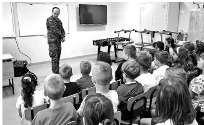
Zajęcia dla klas młodszych