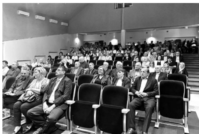
Goście obecni na wydarzeniu z okazji Dnia Samorządu