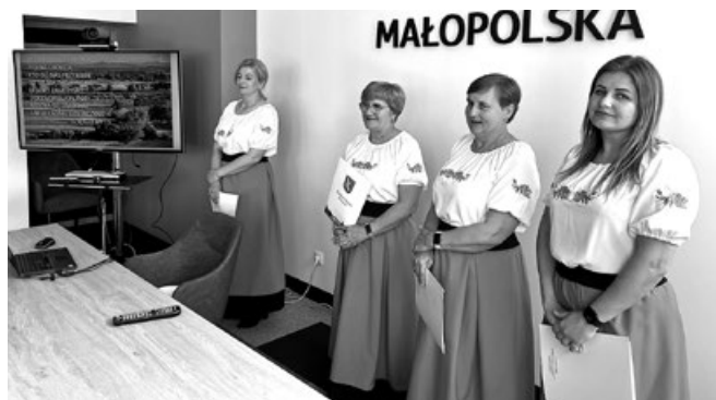
Stowarzyszenia Morskowianie na II etapie konkursu „Małopolska Wieś 2025” w Urzędzie Marszałkowym Województwa Małopolskiego.