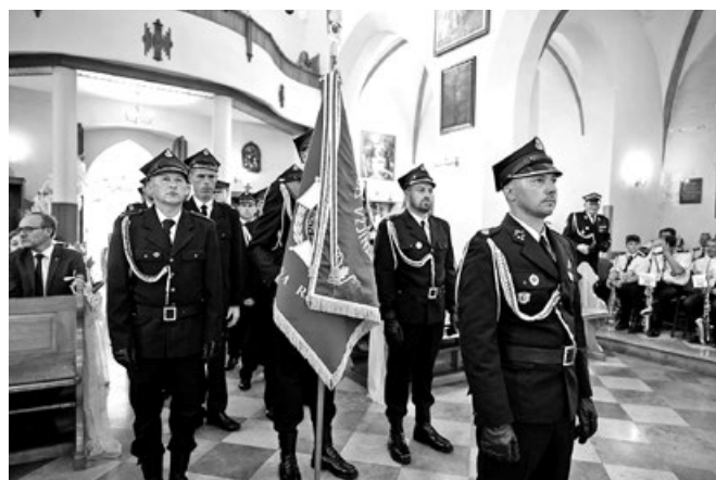
Poczet sztandarowy OSP Przemyków podczas Mszy Świętej