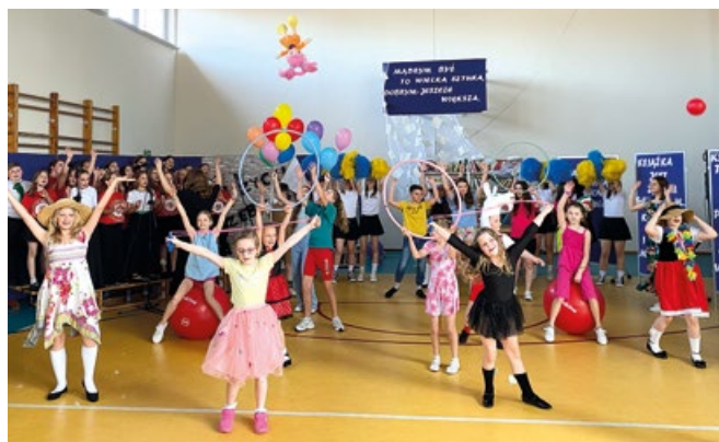
Występ dzieci i młodzieży