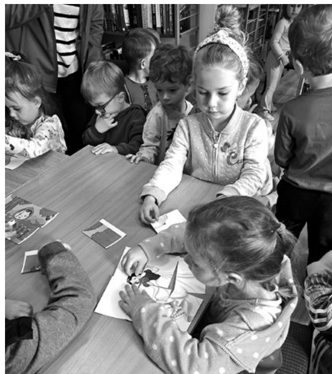
Przedszkolaki podczas zajęć w bibliotece