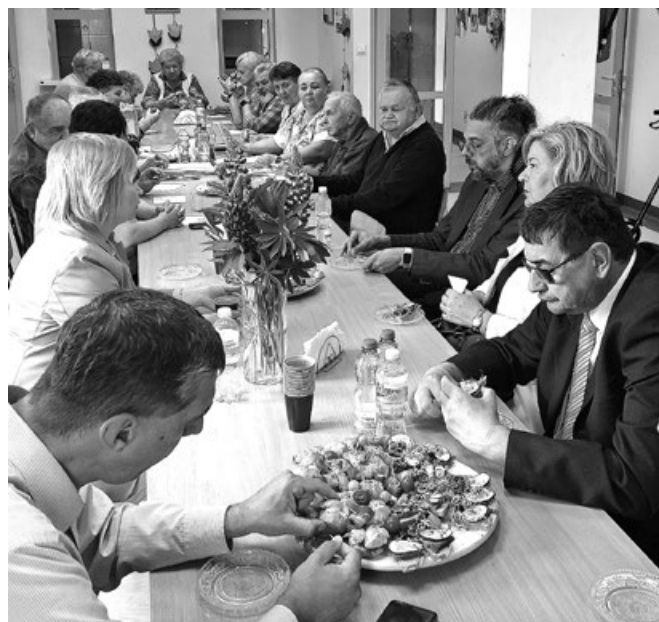
Spotkanie z seniorami w Dziennym Domu Senior+ w Książnicach Małych

doświadczeń, a uwieńczeniem tej wizyty i wielką przyjemnością dla podopiecznych świetlicy środowiskowo-socjoterapeutycznej w Przemyskowie był mecz piłkarzyków rozegrany z przedstawicielami miasta partnerskiego Derecske. Następnie delegacja odwiedziła kościół parafialny p.w. Katarzyny Męczennicy w Przemyskowie oraz wysłuchała historii kościoła opowiedzianej przez proboszcza tej parafii. Kolejnym punktem tego dnia było zwiedzanie wieży widokowej w Witowie. Podczas spaceru na terenie tego obiektu przedstawiciele Urzędu Miasta i Gminy Koszyce omówili historię powstania wieży, a także plany jej rozbudowy i zwiększenia potencjału turystycznego tego miejsca. Po zakończonym zwiedzaniu wieży widokowej w Witowie delegacja przejechała na ścieżkę turystyczno-rekreacyjną w MorSKU. Zwiedzanie ścieżki połączone było z przejściem po pobliskim zakolu Wisły i obserwowaniu bogatej fauny i flory w tamtym rejonie. Kończąc zwiedza-