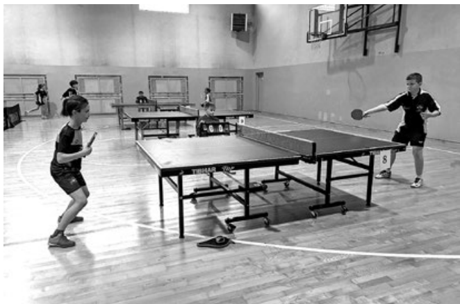
Półfinały Wojewódzkie w Tenisie Stołowym

Jak sami uczniowie stwierdzili, możliwość uczestnictwa w turnieju na tym szczeblu rozgrywek był dużym przeżyciem.