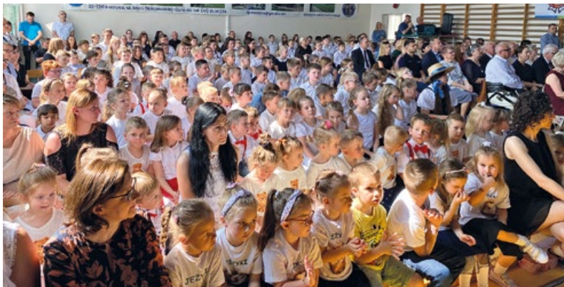
Społeczność szkolna podczas występu