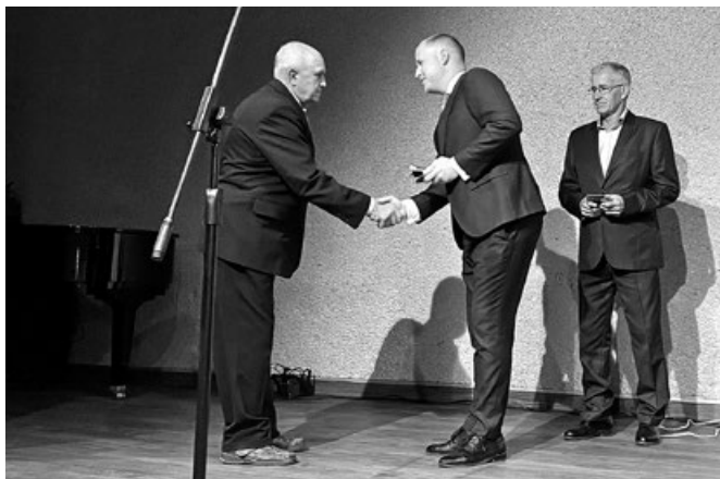
Wręczenie medali „Za zasługi dla Miasta i Gminy Koszyce” przez Burmistrza Miasta i Gminy Koszyce

Koszyce złożył serdeczne życzenia wszystkim Mamom z okazji Dnia Matki, a następnie zaprosił gości na poczęstunek przygotowany przez Koszycką Spółdzielnię Socjalną.