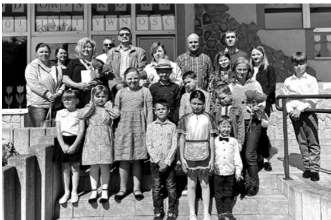
Wizyta w świetlicy środowiskowo-socjoterapeutycznej w Przemyskowie