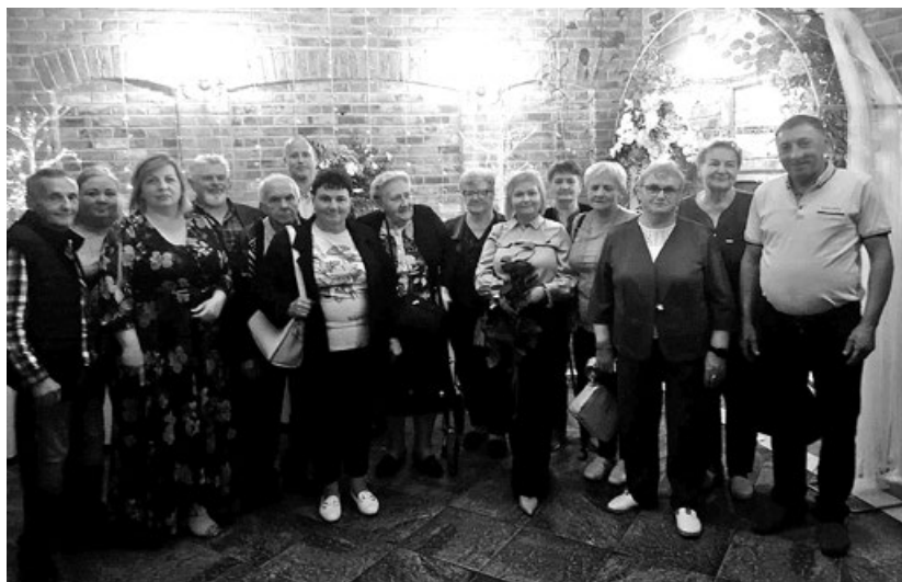
Uczestnicy spotkania z okazji Powiatowego Dnia Osób z Niepełnosprawnością