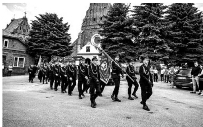
Przemarsz Pocztów Sztandarowych