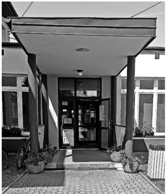
Istniejące wejście do szkoły planowane do dostosowania dla osób niepełnosprawnych