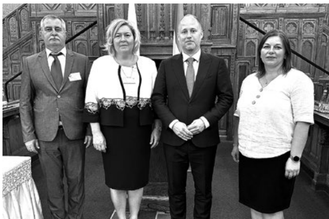
Przedstawiciele miast Koszyce oraz Derecske na III Konferencji Polskich i Węgierskich Miast Partnerskich