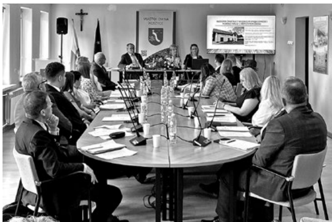
Prezentacja i debata nad Raportem o stanie Gminy Koszyce w roku 2024