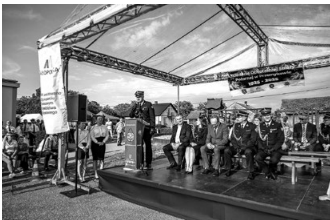
Goście uroczystości 100-lecia OSP Przemysłowców