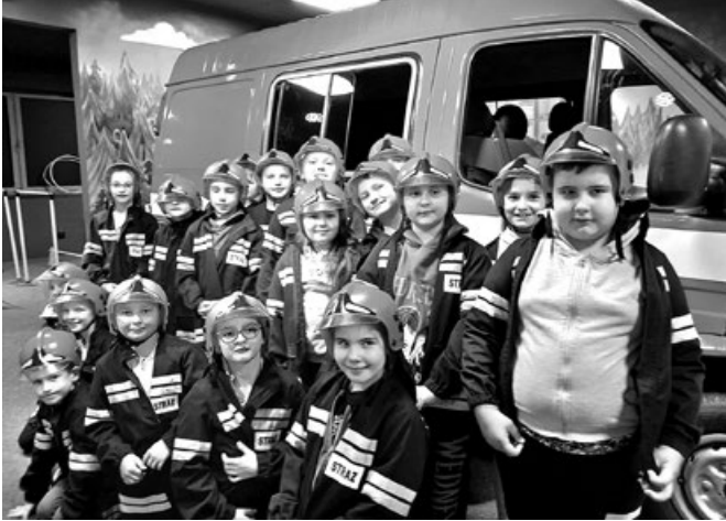
Wycieczka do Dobczyc

udali się w prawdziwych mundurach i prawdziwym wozem strażackim, którym sami kierowali. To była fantastyczna, niezapomniana przygoda! Uwieńczeniem wycieczki był McDonald's, gdzie zregenerowali siły, aby ze śpiewem wrócić do Koszyc.