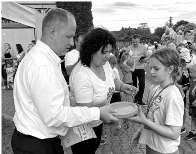
Wręczenie nagród i dyplomów za udział w konkurencjach sportowych

Na zakończenie tego pełnego wrażeń dnia zorganizowano plenerowe kino – dzieci tłumnie zasiadły