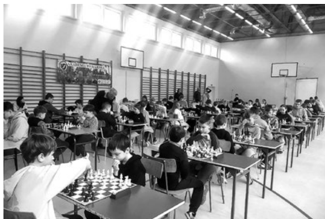
Powiatowy Turniej Szachowy

Naszemu uczniom gratulujemy osiągniętych wyników i życzymy dalszych sukcesów sportowych.