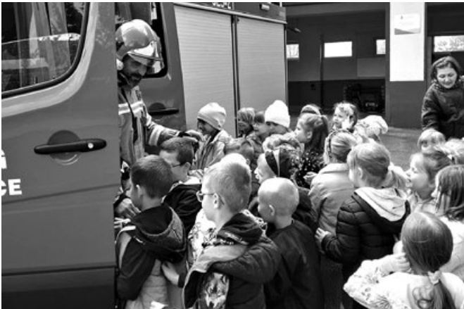
Przedszkolaki z wizytą w OSP Koszyce

Kierując się złotą radą Benjamina Franklina: ważna sprawa, to nigdy nie przestać pytać , zebraliśmy wiele nurtujących nas pytań i wybraliśmy się na wycieczkę do Ochotniczej Straży Pożarnej w Koszycach. Przedszkolaki to niezwykle wymagający słuchacze, dlatego tym bardziej dziękujemy druhom z OSP za wspaniałe przyjęcie i niezwykle lekcję wzbogaconą o doświadczenia i przeżycia.