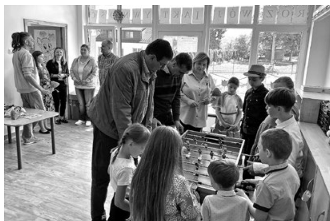
Wspólne gry i zabawy podopiecznych świetlicy środowiskowo-socjoterapeutycznej z przedstawicielami delegacji