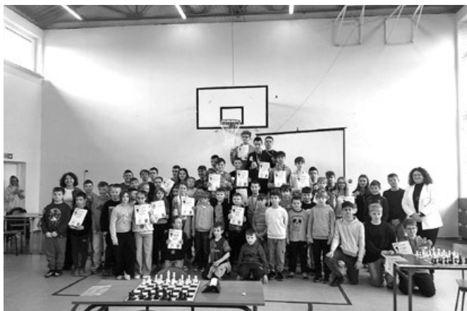
Powiatowy Turniej Szachowy