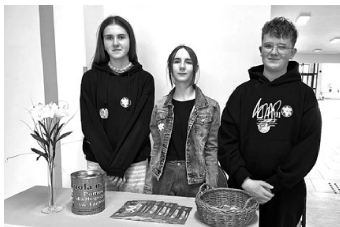
Młodzież podczas akcji Pola Nadziei

Wszystkim - młodszym i starszym uczniom, ich rodzicom, pracownikom szkoły – serdecznie dziękujemy za okazane serce! Pomoc nie spada z nieba... Pomoc to WY!