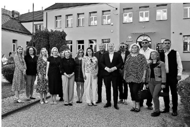
Wizyta w Szkole Podstawowej w Książnicach Wielkich