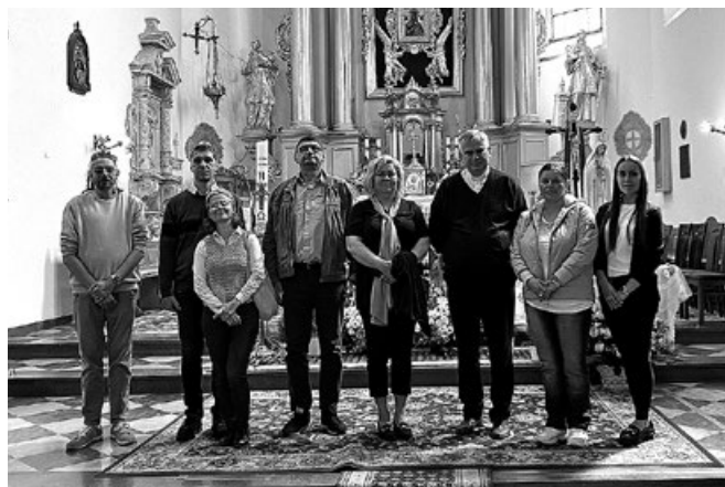
Zwiedzanie kościoła p.w. Katarzyny Męczennicy w Przemyskowie