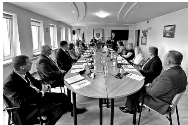
Obrady Sesji absolutoryjnej Rady Miejskiej w Koszycach, przemówienie Burmistrza Miasta i Gminy Koszyce