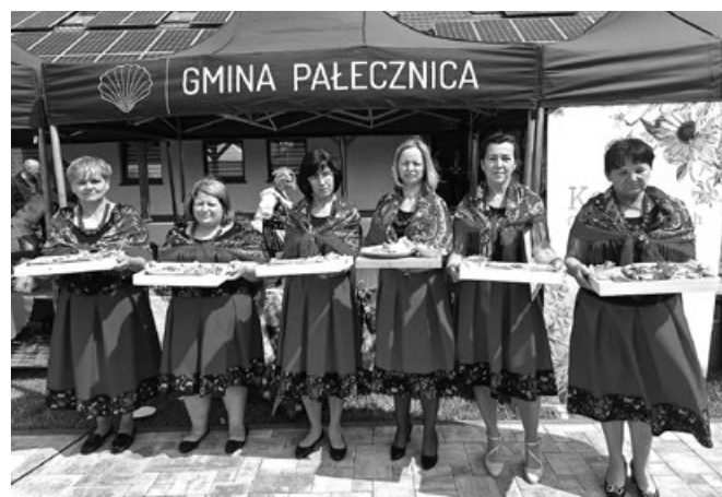
Prezentacja potrawy przez KGW Zosie Samosie na X edycji konkursu kulinarnego Bitwa Regionów w Pałeczniczy