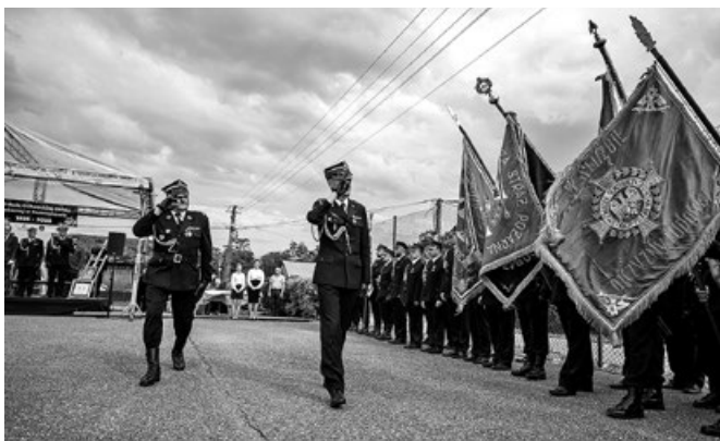
Odprawa Pocztów Sztandarowych