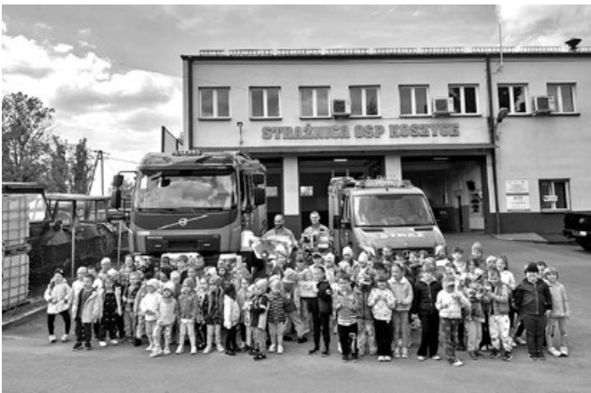
Przedszkolaki w OSP w Koszycach