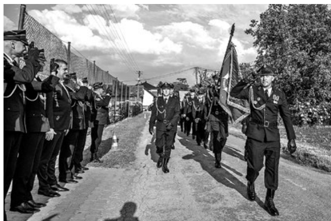
Uroczysty przemarsz jednostki OSP Przemysłowców