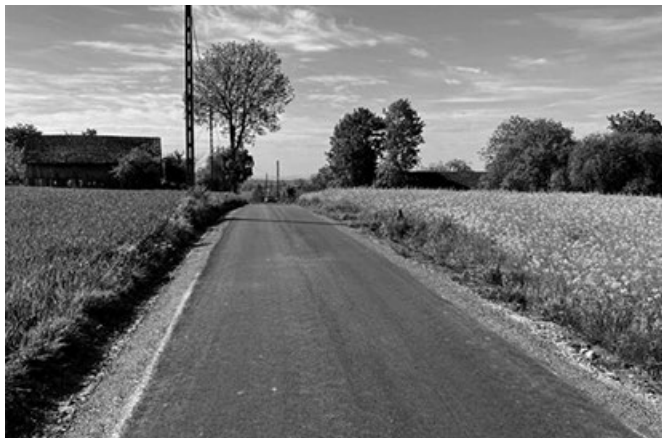
Remont drogi gminnej w miejscowości Biskupice

Kolejnym projektem jest zadanie „Remont drogi dojazdowej do pól w miejscowości Biskupice na