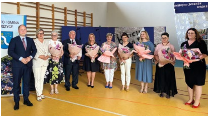
Podziękowania dla dyrektorów szkoły