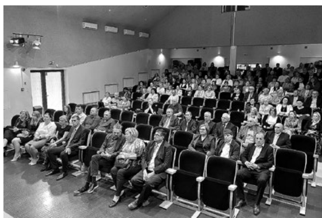
Koncert zorganizowany z okazji Dnia Samorządu Terytorialnego w Gminie Koszyce

nie Gminy Koszyce w tym dniu, delegacja obejrzała nowopowstałą świetlicę wiejską w Morsku, po czym została zaproszona na obiad przygotowany przez Stowarzyszenie Morskowianie. W drugiej części dnia delegacja brała udział w pikniku rodzinnym zorganizowanym z okazji Dnia Matki, Dnia Dziecka i Dnia Ojca w Szkole Podstawowej w Książnicach Wielkich. Podczas pikniku uczestnicy mieli również możliwość obejrzenia wielu zmian jakich dokonano w czasie modernizacji w budynku Szkoły Podstawowej w Książnicach Wielkich.