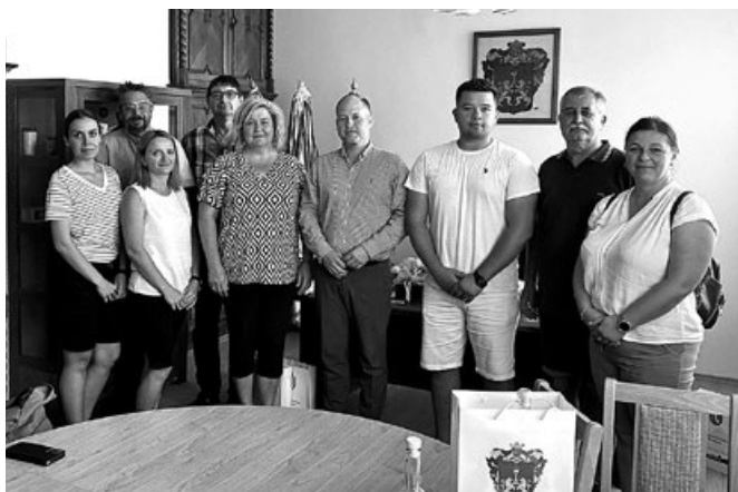
Delegacja z Polski na spotkaniu w Urzędzie Miasta Derecske

Po zakończonej konferencji obie delegacje udały się na spacer deptakiem wzdłuż rzeki Dunaj gdzie mogły podziwiać najbardziej symboliczne miejsca stolicy Węgier.