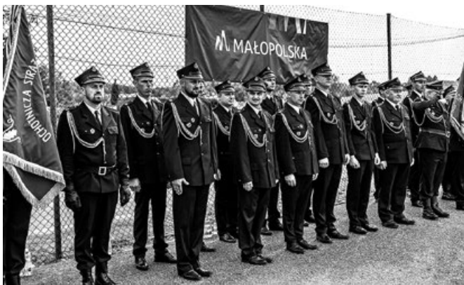
Strażacy z OSP Przemyków