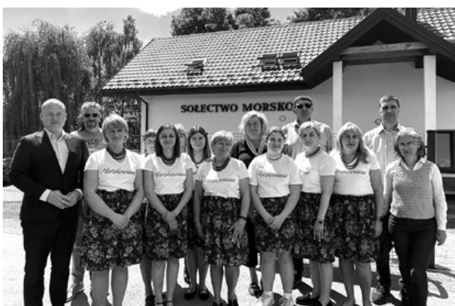
Przedstawiciele delegacji wraz z Burmistrzem Miasta i Gminy Koszyce oraz Stowarzyszeniem Morskowianie