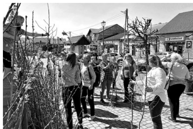
Mieszkańcy, którzy otrzymują sadzonkę drzewka owocowego