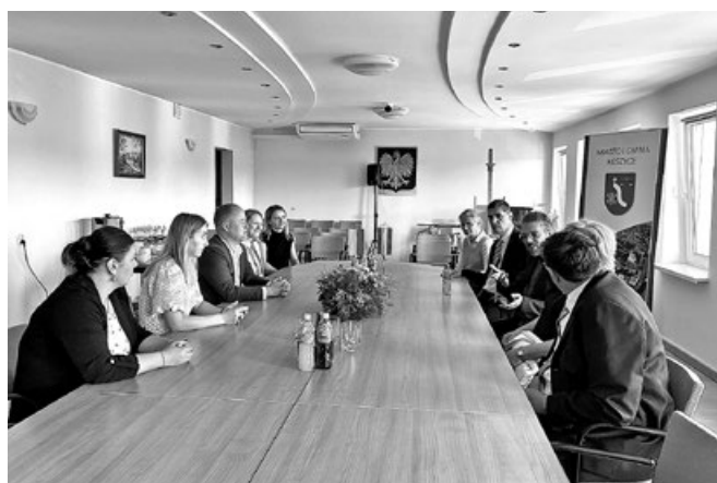
Spotkanie samorządowe w Urzędzie Miasta i Gminy Koszyce