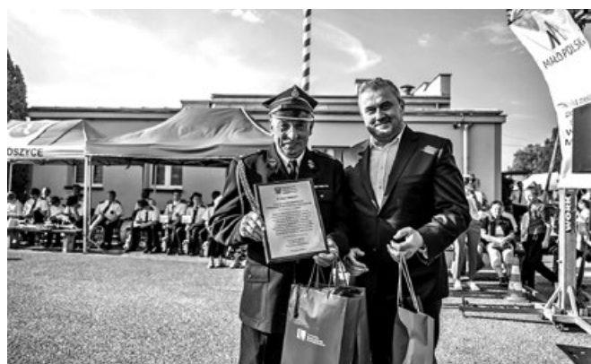
List gratulacyjny dla OSP Przemków od Stanisława Bukowca Wiceministra Infrastruktury