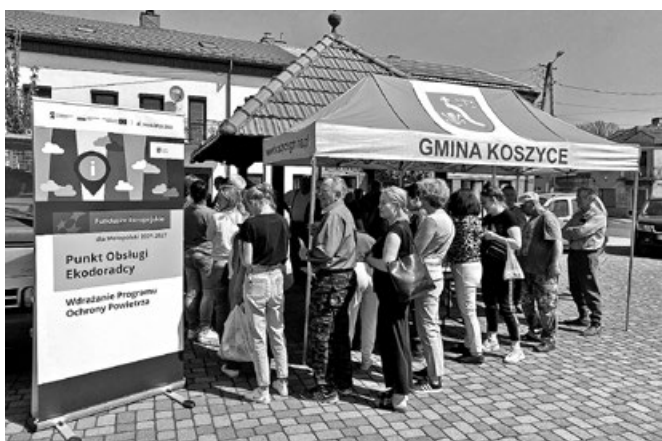
Mieszkańcy podczas akcji rozdawania drzewek

Akcja rozdawania drzew cieszyła się dużym zainteresowaniem mieszkańców. Wydarzenie odbyło się na Rynku w Koszycach. Rozdano aż 200 sztuk sadzonek drzew owocowych- śliw, jabłoni, wiśni i brzoskwini. Podczas spotkania Ekodoradca przeprowadzał rozmowy na tematy związane z ochroną środowiska dot. m.in. wymiany starych „kopciuchów” na ekologiczne źródła ciepła, ochrony powietrza i ziemi, oszczędzania wody. Udział tak