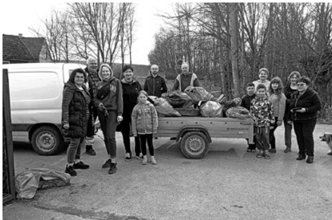
Mieszkańcy Łapszowa z zebranymi śmieciami