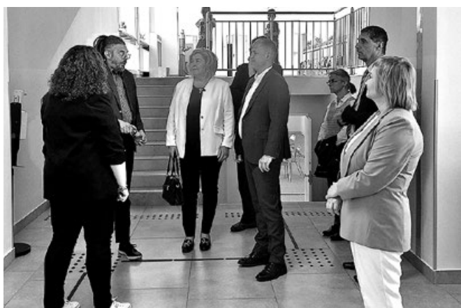
Wizyta w Centrum Oświatowym w Koszycach