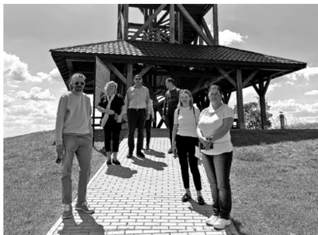
Zwiedzanie wieży widokowej w Witowie