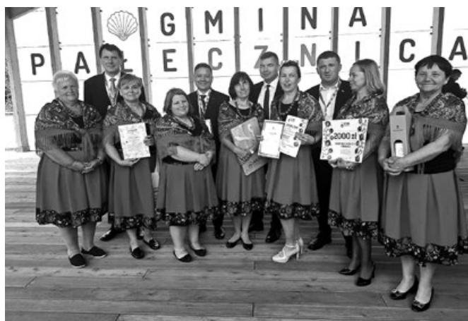
Wręczenie nagrody dla KGW Zosie Samosie za zdobycie I miejsca w powiatowym konkursie kulinarnym

Od 3 lat, czyli tyle ile KGW ZOSIE SAMOSIE istnieje, próbujemy naszych sił w tym konkursie (nie bez sukcesów – 4 miejsce w pierwszym roku naszych zmagania i w kolejnym – wyróżnienie). Jak to mówią do „trzech razy sztuka” – w końcu się udało