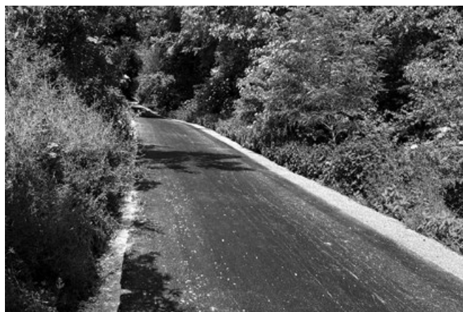
Droga gminna - ul. Wirecka