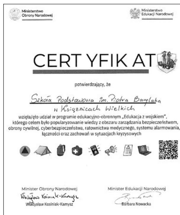
Certyfikat udziału szkoły w programie