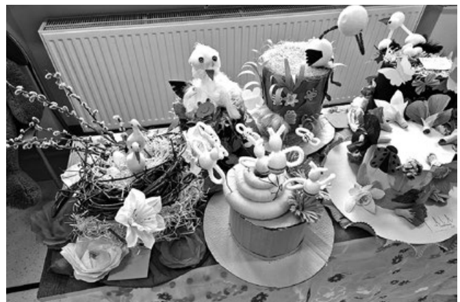
Konkurs Wiosenne Kapelusze