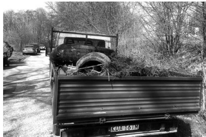
Śmieci zebrane w lesie przez Koło Łowieckie Szarak