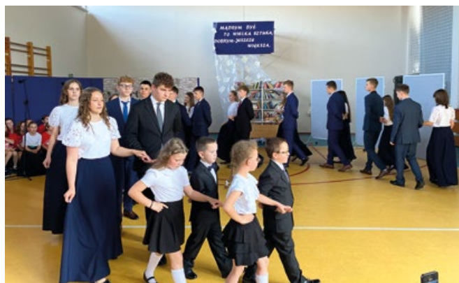
Polonez w wykonaniu uczniów