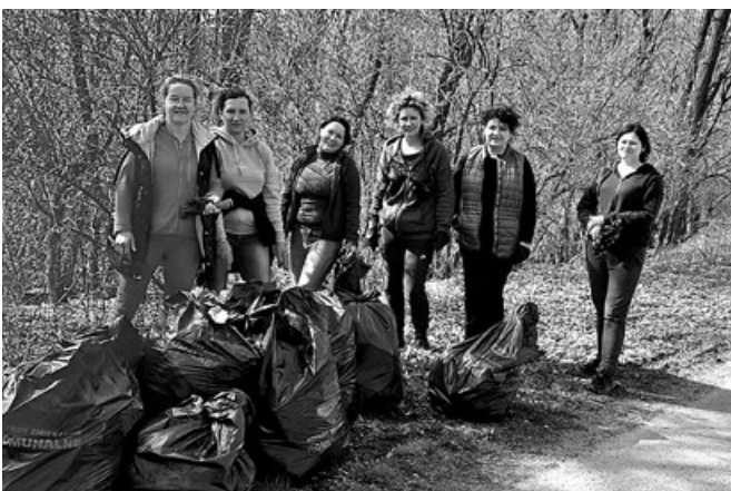
KGW Przemyków podczas Akcji Sprzątania

Za nami kolejna edycja Akcji Sprzątania Przestrzeni Publicznej w Gminie Koszyce, która miała miejsce pierwszych dniach kwietnia. Zgłosiła się rekordowa ilość 1122 osób, dla których bliska jest ochrona środowiska. Uczniowie szkół wraz z nauczycielami, organizacje pozarządowe z terenu gminy, Koła Łowieckie, PZH Gołębi pocztowych, Polski Związek Wędkarski, mieszkańcy Sołectw aktywnie uczestniczyli w sprzątaniu terenu gminy Koszyce. Integracja mieszkańców, edukacja ekologiczna to dodatkowy aspekt oprócz aspektów środowiskowych. Fakt, iż w akcji sprzątania biorą udział mieszkańcy od najmłodszych przedszkolaków po