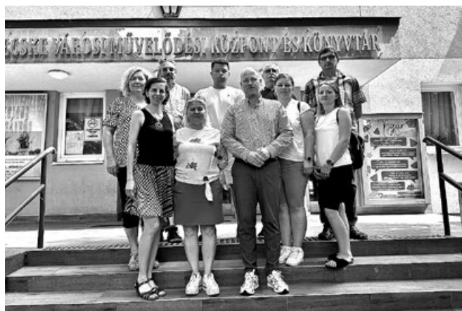
Wizyta w Miejskim Centrum Kultury w Derecske