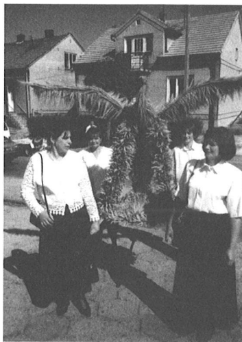
Wieniec z Podgaja.

Zwykle dożynki organizowano w Koszycach 15