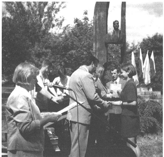
Wręczenie nagród w Piotrkowicach Małych.