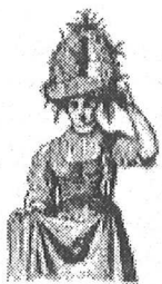
Przodownica w wieńcu na głowie z Mogilan pod Krakowem.

Niwo ma, niwo! Skibo ziemi plennej, Ty co raz wieniec żytni, także pszenny Spokojnie na mej gdy położysz głowie, Za fraszkę wasze korony królowie.