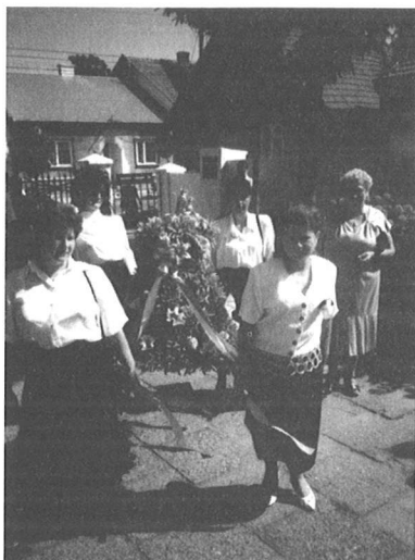
Wieniec z Koszyc.

Koszycach i widzieć wspaniałe wieńce dożynkowe z Podgaja, Sokołowic, Włostowic i Koszyc. Zachwycaly kształtami, pomysłowością projektantów i wykonawców, tworzywem - wieloma zbożami, owocami, makiem, kukurydzą i prosem. Raziły sztucznymi kwiatami nie z tego okresu kwitnienia. Był wspaniały wiejski chleb z Sokołowic, którego smak