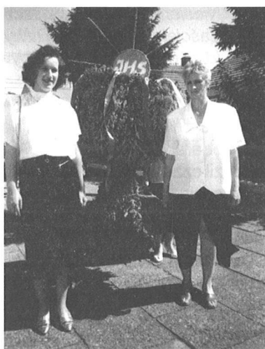
Wieniec z Włostowic.