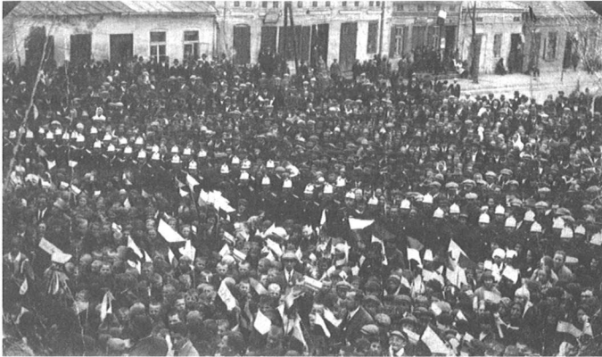
Koszycy Rynek 3 maja 1927 lub 1928 roku.

chłopcy stawiali na Rynku „Maja”. Było to drzewko z młodymi listeczkami, ustrojone wstążkami i kokardami, na rano jaśniało świeżością i barwą. Na estradzie, takim „Balkonie” były przemówienia i występy. Tam właśnie śpiewaliśmy pieśni patriotyczne i wojskowe - legionowe i recytowaliśmy wiersze.