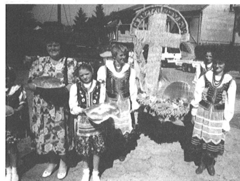
Wieniec z Sokołowic.

długo się pamięta i żal, że grupom kobiet i dzieci nie towarzyszyły barwne gromady ich współmieszkańców, muzyka, śpiew. Nie było „Wiślan” i dęciaków... i ten najpiękniejszy plastycznie złoty orzeł z Podgaja. To dzieło sztuki - nie wiem czy ludowej? - winno zająć miejsce w specjalnej gablocie. Tylko Sokołowice były wierne tradycyjnemu strojowi ludowemu.