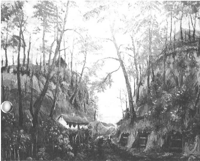
Wąwóz w Przemysławie - piwnice w glinianej skarpie (obraz Mieczysława Wójcika)

Dawna wieś wśród pagórków, przylasków ze swymi błotnymi drogami, studniami – żurawiami wiklinowymi opłotkami, ginie już z