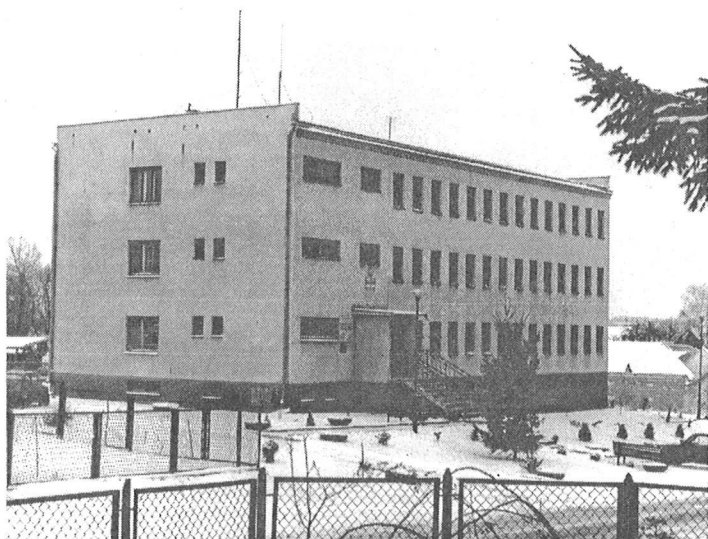
Budynek Urzędu Gminy w Koszycach