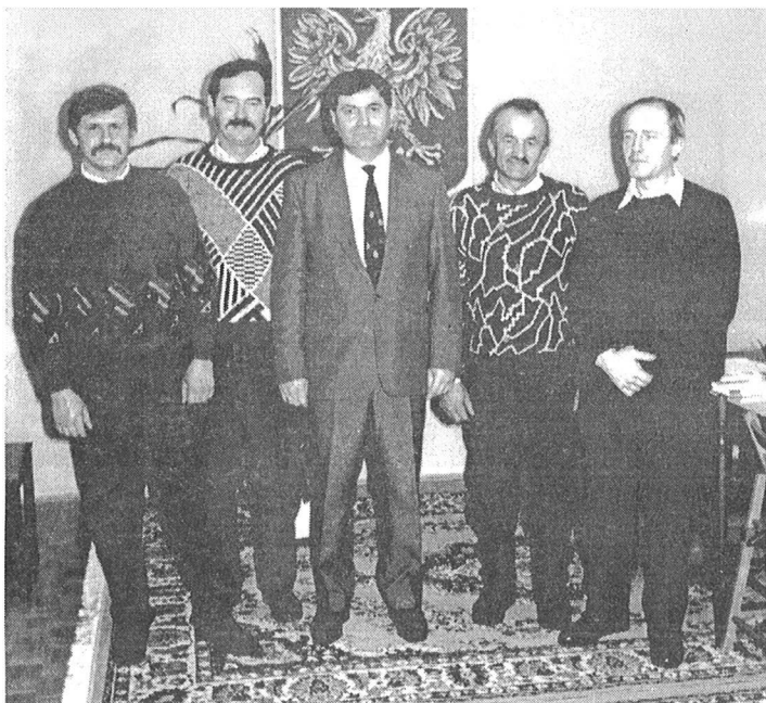
ZARZĄD GMINY KOSZYCE

Składa się z pięciu członków. Na czele stoi Przewodniczący Zarządu, którym z mocy prawa jest Wójt Gminy.