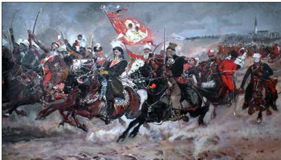
Kazimierz Pułaski pod Częstochową, obraz Józefa Chełmońskiego z 1875 roku