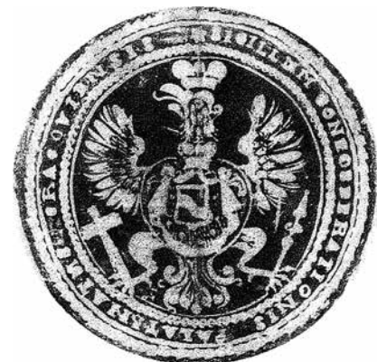
Pieczęć konfederacji województwa krakowskiego w konfederacji barskiej w 1769 roku

częsteczki energii, która zdaje się nie wyczerpywać i być nieproporcjonalną do masy tej cząsteczki. Mówimy: „Duch narodu”, i wyobrażamy całość pewnego obszaru ziemi, zamieszkałą przez ludzi, z których każdy jest tym duchem ogarnięty i daje w sumie to, co stanowi życie i historię narodu. A tymczasem duch ten niekiedy opuszcza tłumy i pozostaje jedynej duszy jak: Kordecki, Kościuszko... Były chwile, kiedy zdawało się, że na obszarze Polski nie było śladu tego ducha i serce jej biło we Włoszech – w legionach Dąbrowskiego. Odtąd rośnie on i potężnieje, niezdolny klęskami, nie dający się zabić przez żadne prześladowania. Jest to znamienym zjawiskiem, że Polska w ciągu tych stu lat, staczając się z klęski w klęskę, z nieszczęścia w nieszczęście, w miarę jak polityczny jej upadek, wyrażający się utratą resztek cieniów jej niepodległości, zwiększa się, że Polska