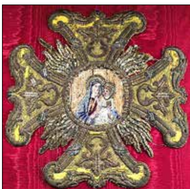
Krzyż konfederacji barskiej

częsteczki energii, która zdaje się nie wyczerpywać i być nieproporcjonalną do masy tej cząsteczki. Mówimy: „Duch narodu”, i wyobrażamy całość pewnego obszaru ziemi, zamieszkałą przez ludzi, z których każdy jest tym duchem ogarnięty i daje w sumie to, co stanowi życie i historię narodu. A tymczasem duch ten niekiedy opuszcza tłumy i pozostaje jedynej duszy jak: Kordecki, Kościuszko... Były chwile, kiedy zdawało się, że na obszarze Polski nie było śladu tego ducha i serce jej biło we Włoszech – w legionach Dąbrowskiego. Odtąd rośnie on i potężnieje, niezdolny klęskami, nie dający się zabić przez żadne prześladowania. Jest to znamienym zjawiskiem, że Polska w ciągu tych stu lat, staczając się z klęski w klęskę, z nieszczęścia w nieszczęście, w miarę jak polityczny jej upadek, wyrażający się utratą resztek cieniów jej niepodległości, zwiększa się, że Polska