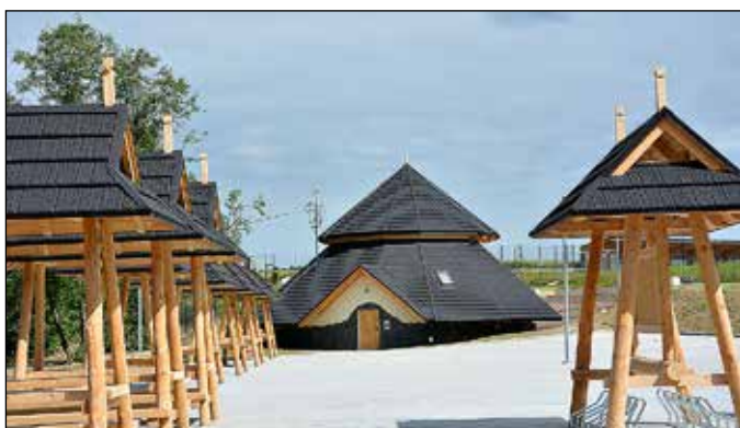
Centrum Produktu Lokalnego w Lipnicy Wielkiej