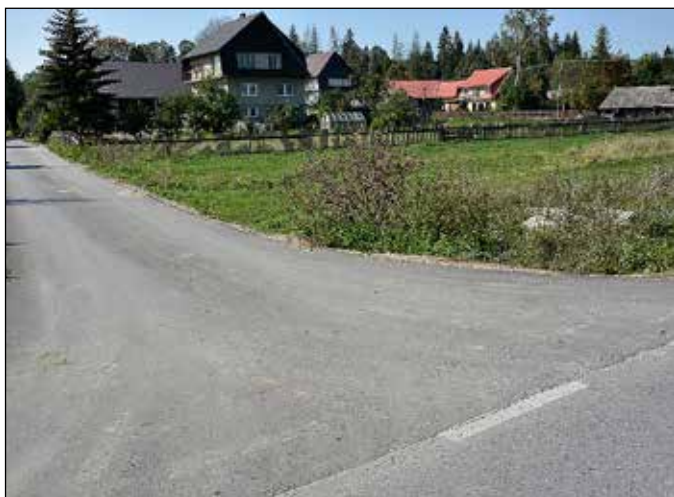
Droga koło Michalaków (Murowanica)