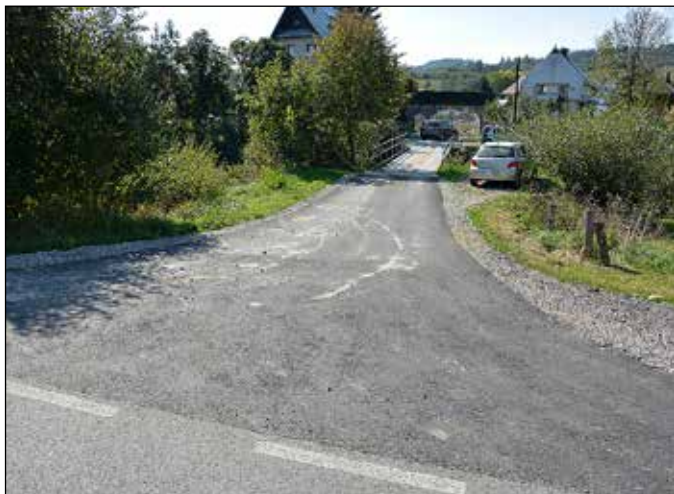
Droga na Tajwan (Centrum)