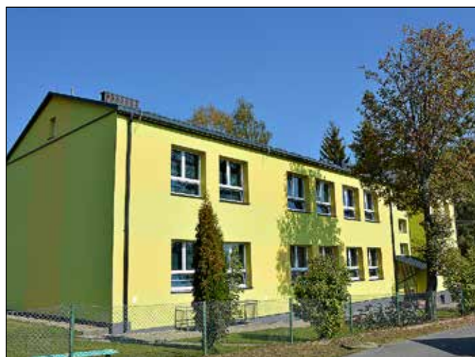
Szkoła Podstawowa Nr 4 – Lipnica Wielka – Przywarówka