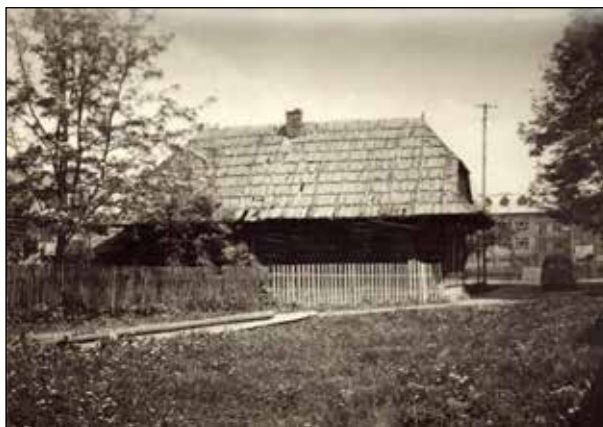
zabytkowy budynek szkoły w Skoczycach