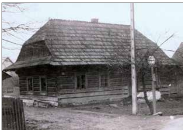
Zabytkowy budynek szkoły w Skoczycach obecnie znajdujący się w MOPE w Zubrzycy Górnej

Została jeszcze kuchnia. Mieściła się między pokojem a klasą. Na połowie kuchnia, na połowie sionka. W kuchni 1 okno na zachód, duży piec kuchenny, nie wiem czy nie z cegły, świetna „bratrura” (przyp. red: piekarnik), można było wypiekać placki czy ciastka. Wykorzystywałam ją raz na 3 tygodnie, jak wypadało