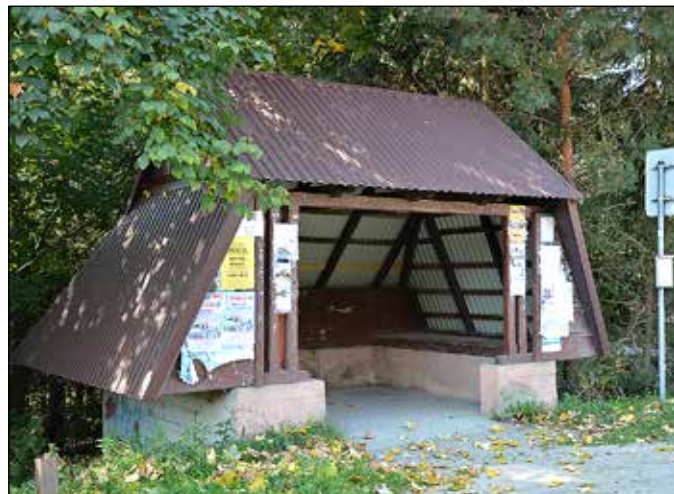
Wymiana zadaszona na sześciu wiatach przystankowych