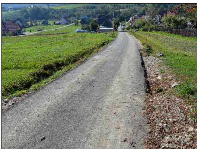
Droga Koło Spyrków – Skoczycy