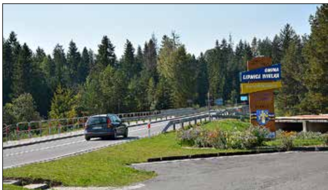
Witacze na początku wsi (Winiarczykówka i Kozubek)