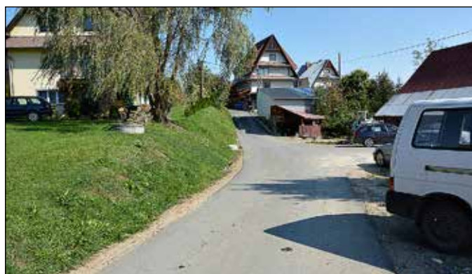
Droga koło Adama Surowczyka