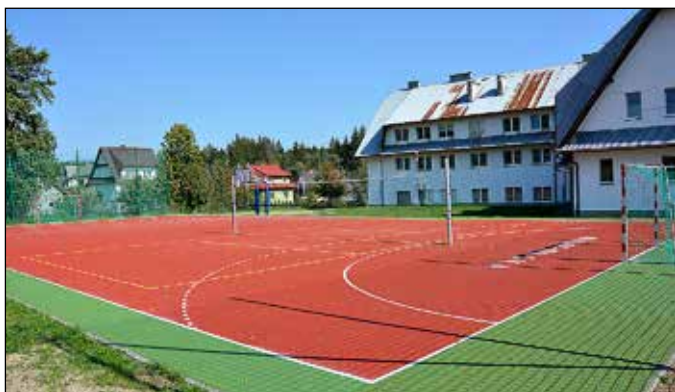
Boisko przy Szkole Podstawowej w Kiczorach