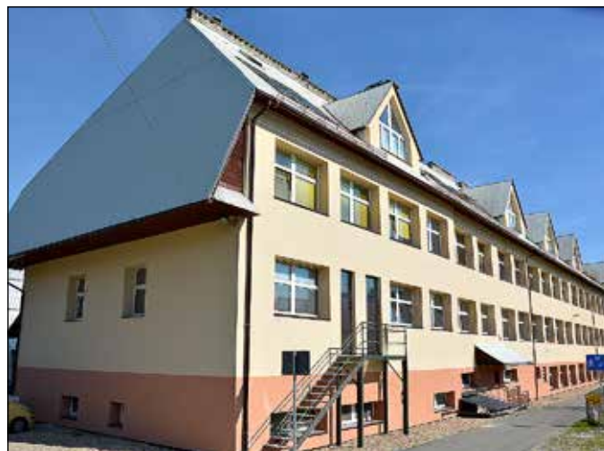
Szkoła Podstawowa Nr 2 – Lipnica Wielka – Centrum (Liceum)