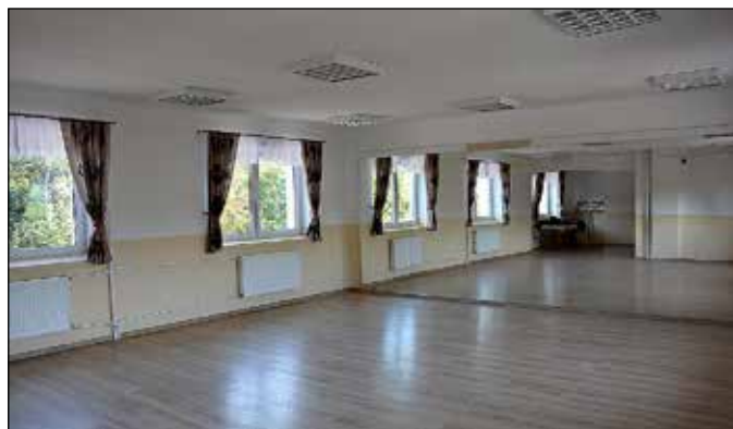
Sale regionalne w budynku Remizy OSP Przywarówka dla Zespołu Orawianie