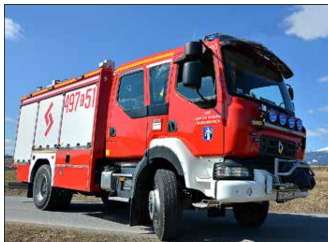
Samochód strażacki dla OSP Murowanica