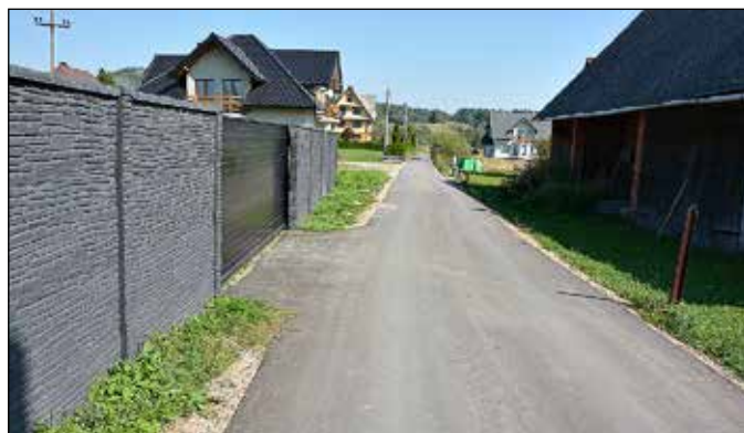
Droga koło Pani Karlak w Skoczyskach