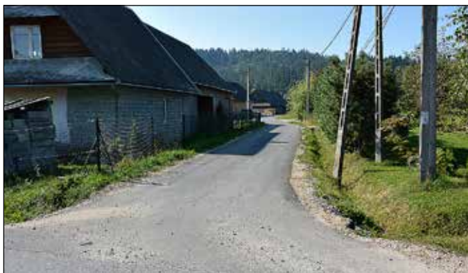
Droga do Małego Rynku - Przywarówka