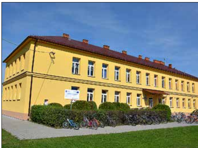
Szkoła Podstawowa Nr 1 – Lipnica Wielka – Murowanica