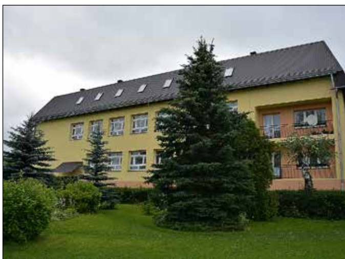
Szkoła Podstawowa Nr 3 – Lipnica Wielka – Skoczycy