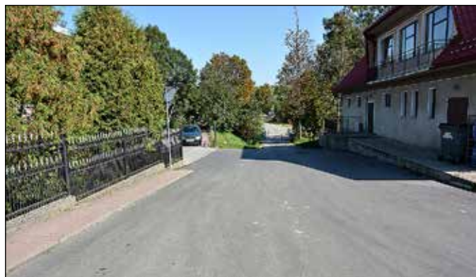
Droga na Amfiteatr Stadion