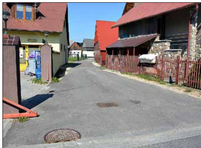
Droga koło sklepu Lenart (Murowanica)