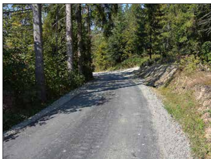
Droga Koło Węgrzynów Jakubinów – Przywarówka