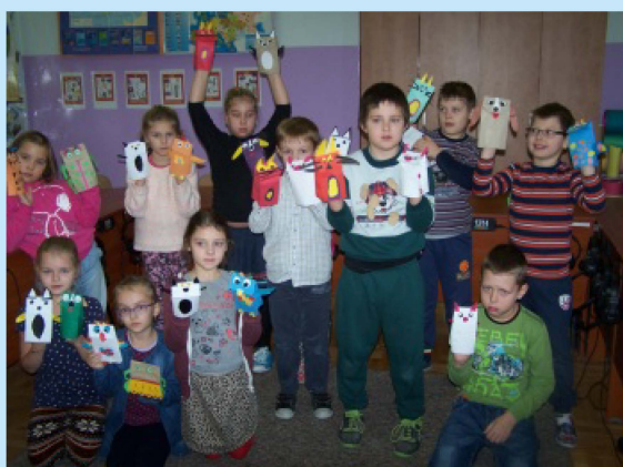
Uczniowie z Czechówki uczestnicy projektu TIK? Tak! str.14