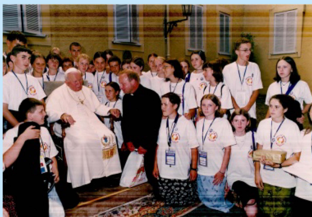
Castel Gandolfo audiencja uczestników XV ŚDM str.15