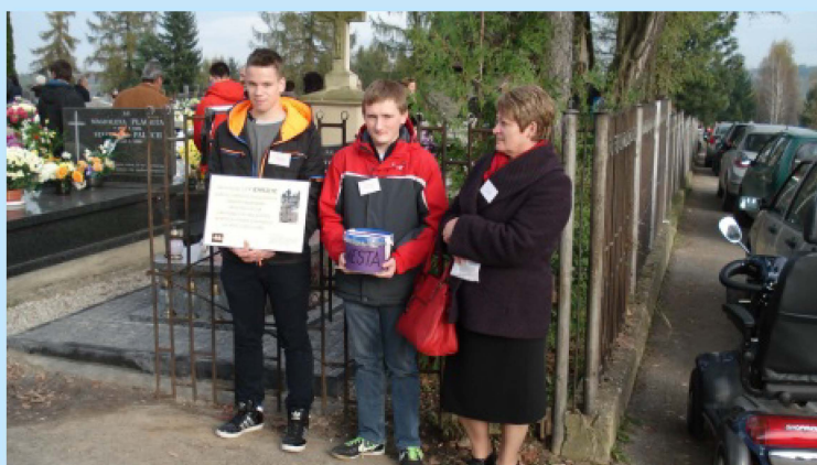
Kwesta na cmentarzu w Zakliczynie str.31