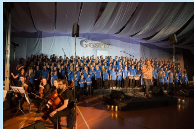
Koncert finałowy IX edycji GOSPEL str.30