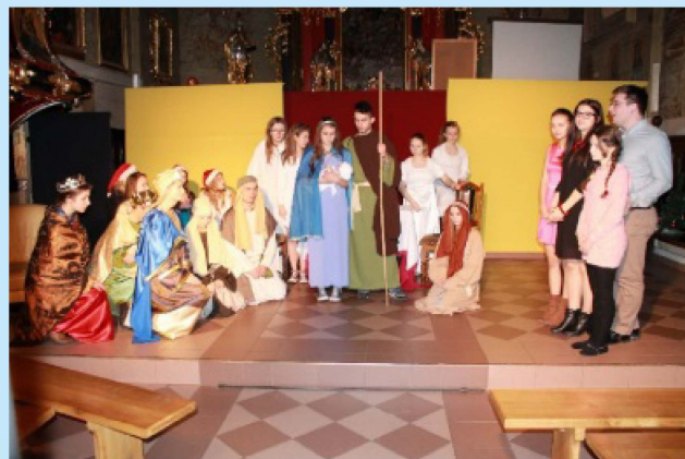
Spektakl wigilijny Teatralnej Grupy Apostolskiej z Zakliczyna str.10