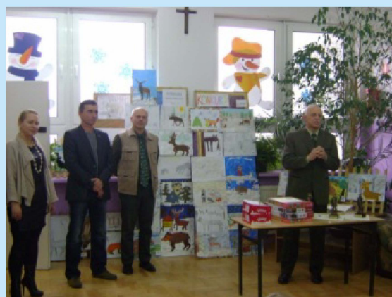
Uroczyste wręczenie nagród w konkursie „Zwierzę łowne zimą” str.13