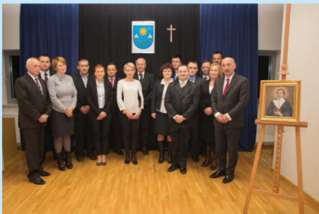
Rada Gminy Siepraw obecnej kadencji samorządu str.3