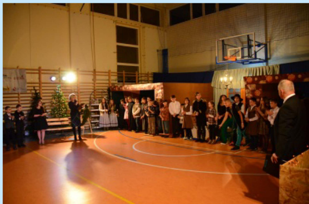
Opowieść wigilijna w Szkole Podstawowej w Łyczance str.10