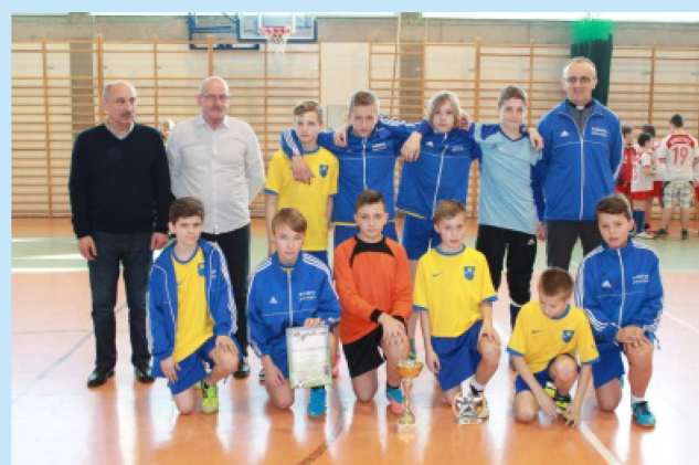
Grupa ministrantów i lektorów z Zakliczyna uczestnicy turnieju piłkarskiego str.34