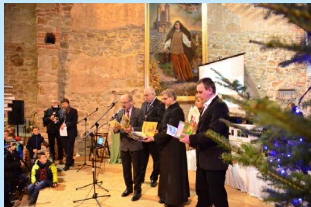
Wręczenie nagród laureatom Konkursu Szopek str.11