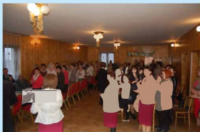
Dzień Seniora w Zakliczynie str.32