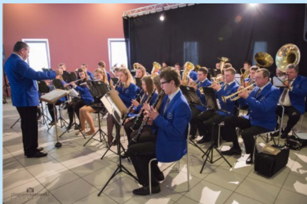
Koncert Orkiestry Sieprawianka str.30