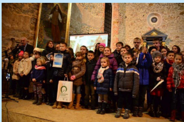
Laureaci XIV konkursu Szopek Tradycyjnych i Krakowskich str.11