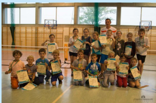
Uczestnicy Małej Tenisowej Olimpiady str.34