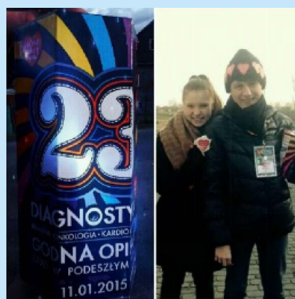
Gimnazjaliści kwestują dla WOŚP str.15