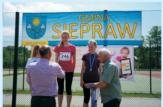
II Bieg „Sieprawska Piątka” str 38