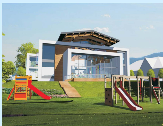
Wizualizacja budynku przedszkola - zadanie inwestycyjne Gminy str 7