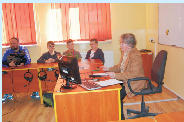
Spotkania z ciekawymi ludźmi „Budujemy mosty” Str 21