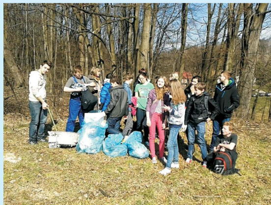
Z życia Gimnazjum w Sieprawiu str 13