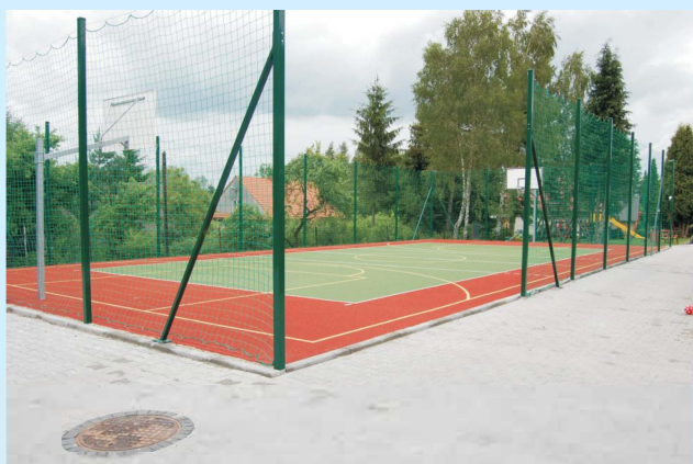
. Ogólnodostępne boisko przy Szkole Podstawowej w Zakliczynie str 5