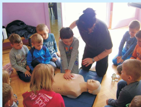
Uczymy się przez działanie str 22