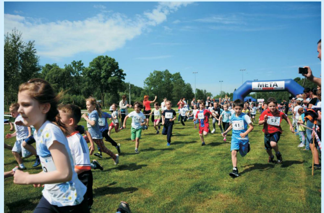
II Bieg „Sieprawska Piątka” str 38