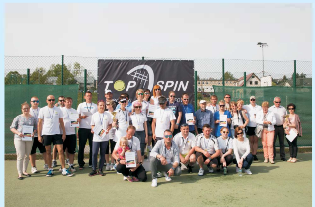
Turniej Tenisa Ziemnego w międzynarodowej obsadzie str 41