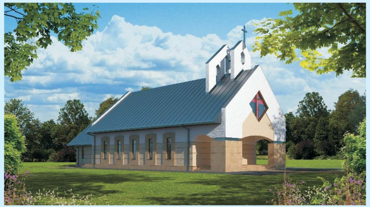
Wizualizacja kaplicy cmentarnej w Zakliczynie str 33