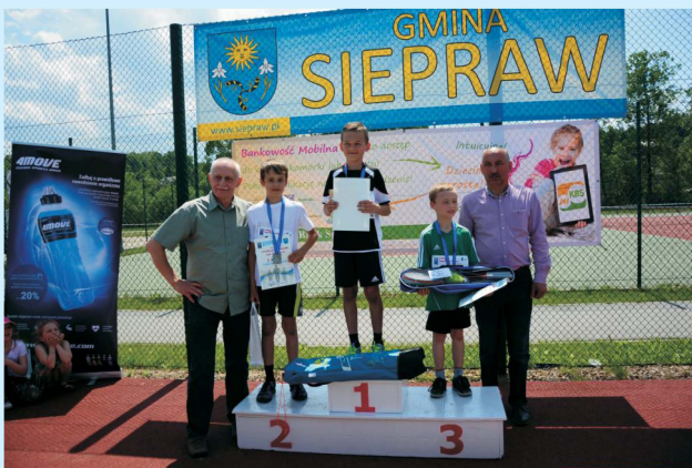
II Bieg „Sieprawska Piątka” str 38