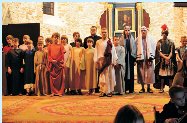
„W poszukiwaniu Mistrza” str 11