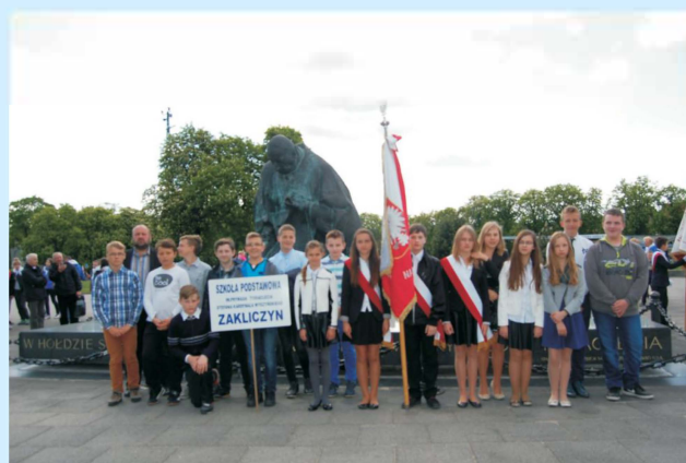
Śladami życia Kardynała Stefana Wyszyńskiego str 20