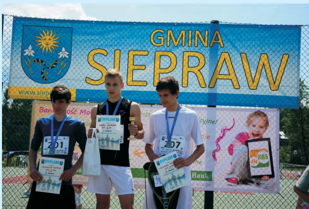
II Bieg „Sieprawska Piątka” str 38