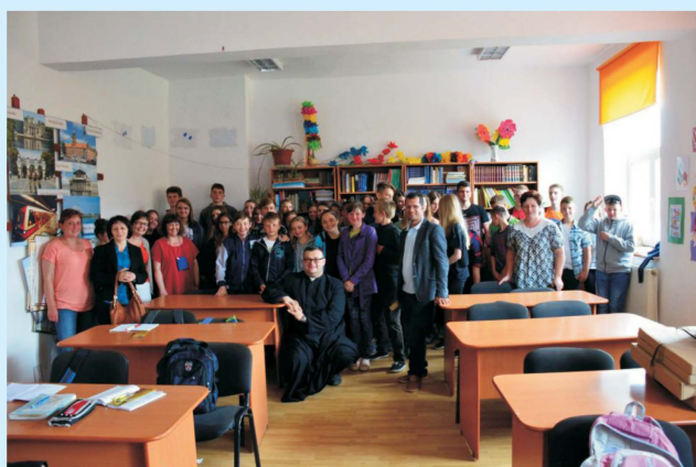
Współpraca Siepraw - Beclean (pobyty młodzieży z Polski w Rumunii) str 15