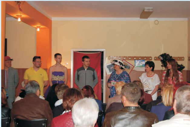
„Teatr w Stodole” gości w gminie str 37