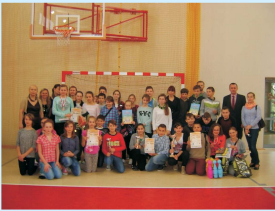
Na mnie zawsze możesz liczyć str 23