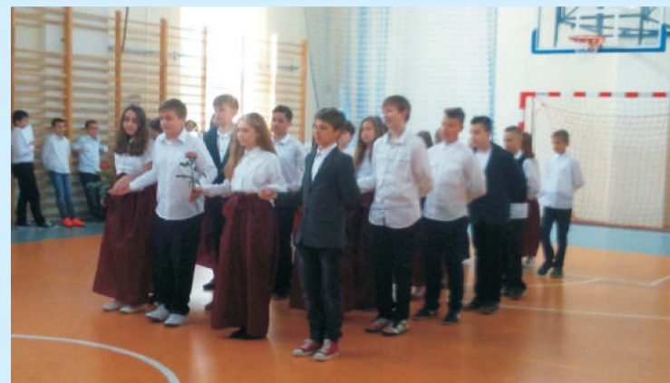
Majowe święto w Szkole Podstawowej w Łyczance str. 22