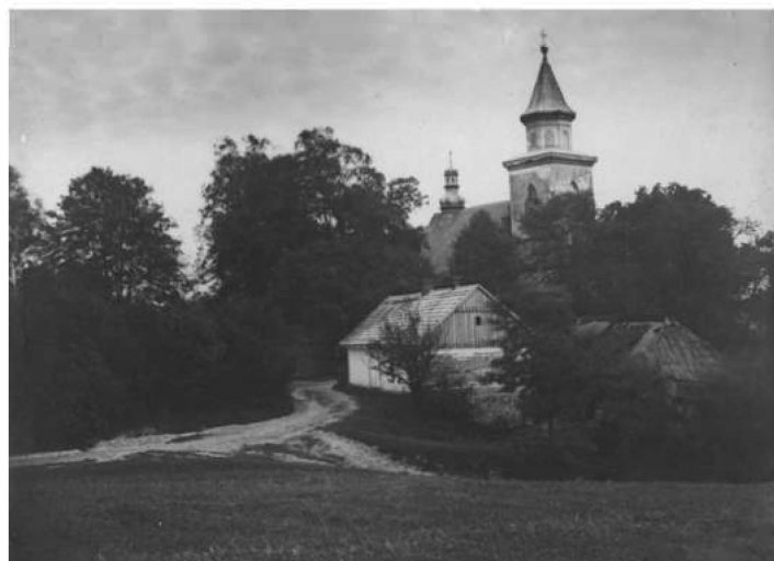
Organistówka i stary kościół w Sieprawiu (I lub II dekada XX wieku), /Archiwum cyfrowe Krzysztofa Króla; oryginał zdjęcia pochodzi z prywatnej kolekcji Włodzimierza Kyrca/

(...) w domu organista żył sobie zwyczajnie jak służka