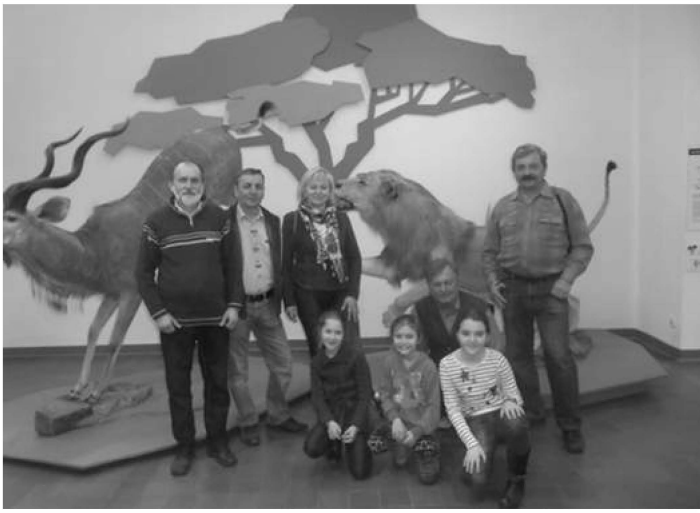
Przedstawiciele Koła Łowieckiego "Ponowa" wraz z uczniami SP w Sieprawiu i opiekunem koła

Znaczna część tej wystawy przez jakiś czas znajdowała się na Zamku w Niepołomicach. Dzięki zachęce Jerzego Galasa dwa lata wcześniej obejrzało ją ponad 100 uczniów naszej szkoły.