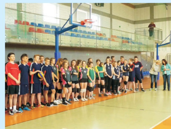
Turniej Siatkówki o Puchar Dyrektora Gimnazjum w Sieprawiu str. 23