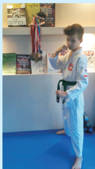
Mistrz Taekwondo z Czechówki str. 19