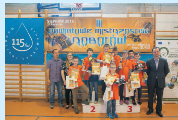
Roboty "Sumo" na zawodach str. 38