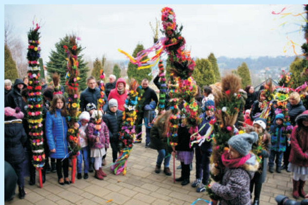
Konkurs palm w Sieprawiu str. 11