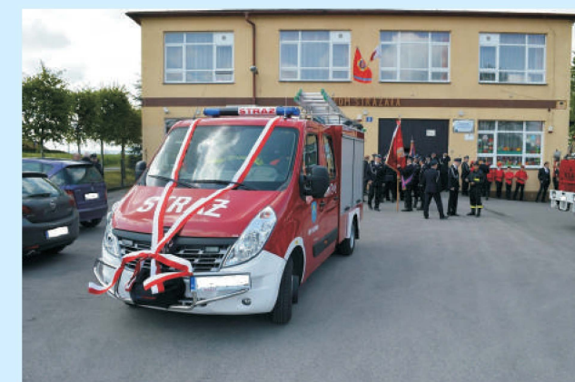
Uroczystość poświęcenia samochodu strażackiego OSP Łyczanka str. 35