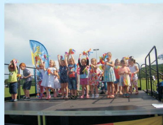
Gminny Dzień Dziecka w Zakliczynie str. 38