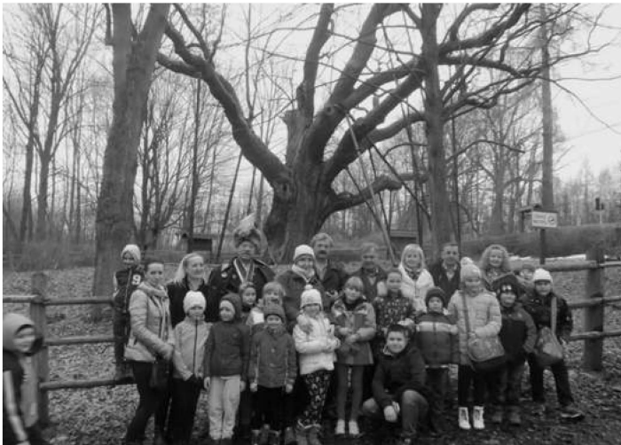
Pod dębem "Bartkiem" w Zagnańsku

Znaczna część tej wystawy przez jakiś czas znajdowała się na Zamku w Niepołomicach. Dzięki zachęce Jerzego Galasa dwa lata wcześniej obejrzało ją ponad 100 uczniów naszej szkoły.