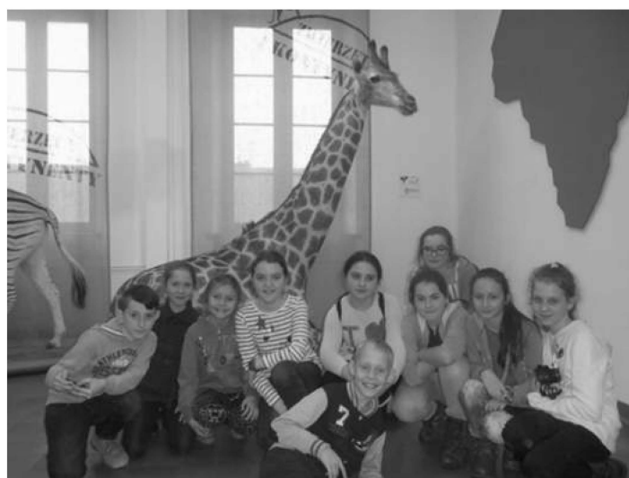
Uczniowie SP w Sieprawiu na wystawie łowieckiej w Kielcach