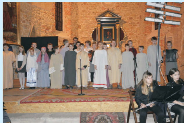
Wielkanocne Misterium str. 10