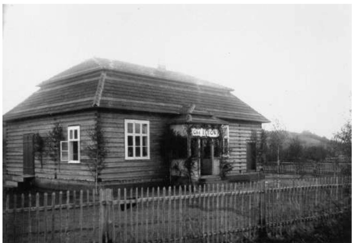
Dom Ludowy w Sieprawiu, lata 30. ub. wieku. Widoczna na zdjęciu dekoracja sugeruje, że mogło być zrobione ok. 4 czerwca 1933 r.