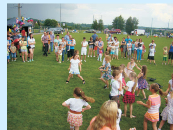
Gminny Dzień Dziecka w Zakliczynie str.38