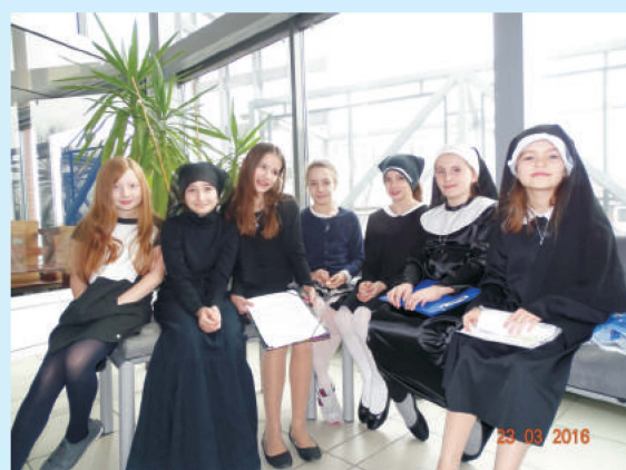
Św. Siostra Faustyna Apostolka Miłosierdzia Bożego str. 18