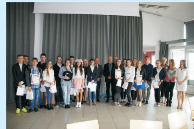
Międzygminny konkurs języka angielskiego str. 23