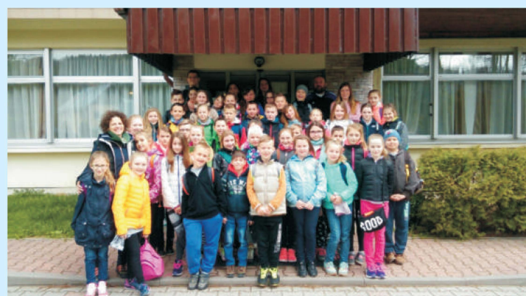
Zielona szkoła str. 19