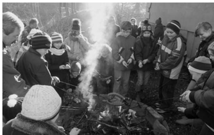
Ognisko przy domku myśliwskim w Sieprawiu