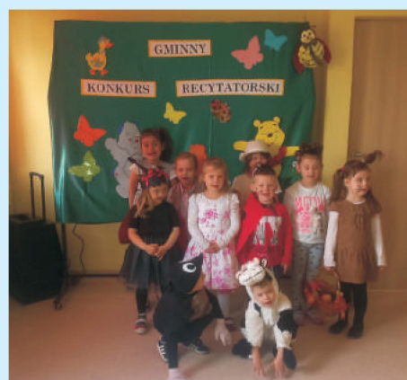
Udział w Gminnym Konkursie Recytatorskim dla przedszkolaków str. 22