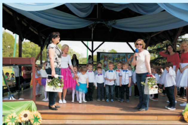
Przyjaciele przedszkola str. 12