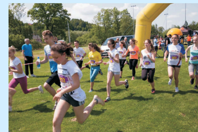
III Bieg Sieprawska Piątka - rodzinne święto biegowe str. 39