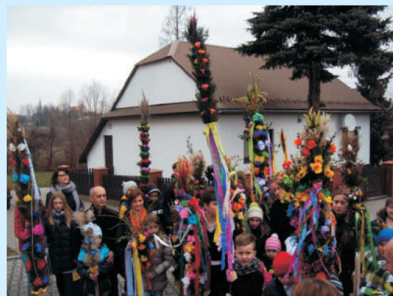
Konkurs palm w Zakliczynie str. 11