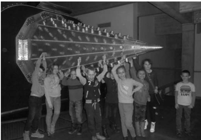
Uczniowie SP w Sieprawiu i w Centrum Geologicznym w Kielcach

W czasie wycieczki do Kielc atrakcją nie było końca, obejrzelśmy najstarsze drzewo w Polsce - dąb Bartek w Zagnańsku oraz centrum geologiczne w Kielcach. Tam w fantastycznej kapsule „odbyliśmy” niezwykłą podróż do wnętrza Ziemi.